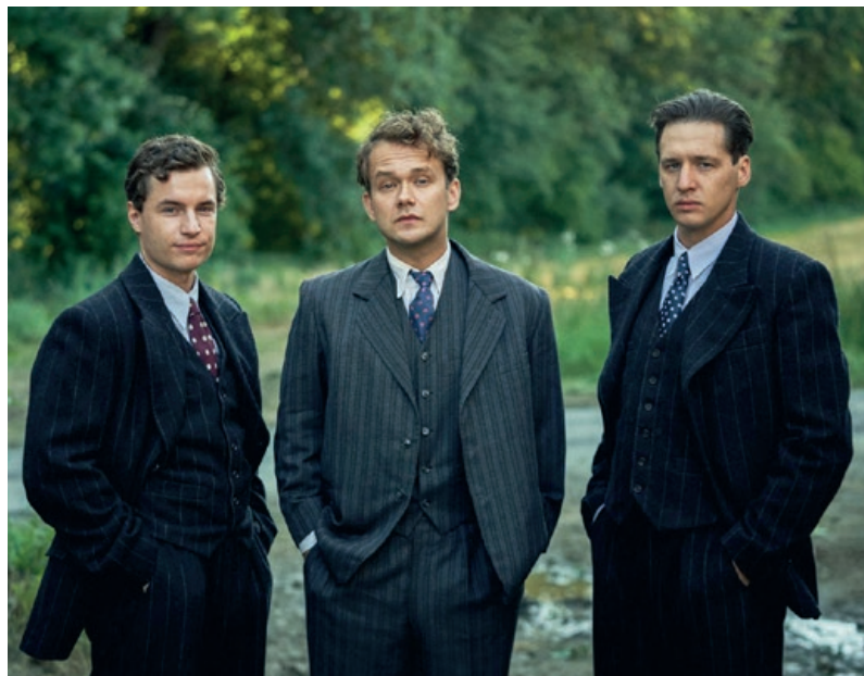
Filmové drama Bratři promítá ostrovský dům kultury 26. října.

Vstupenky zakoupíte v běžných předprodejích domu kultury: infocentrum DKO, zámek, Stará radnice, klášterní areál. On-line předprodej uskutečňte na našich webových stránkách dk-ostrov.cz , v rubrice kino.