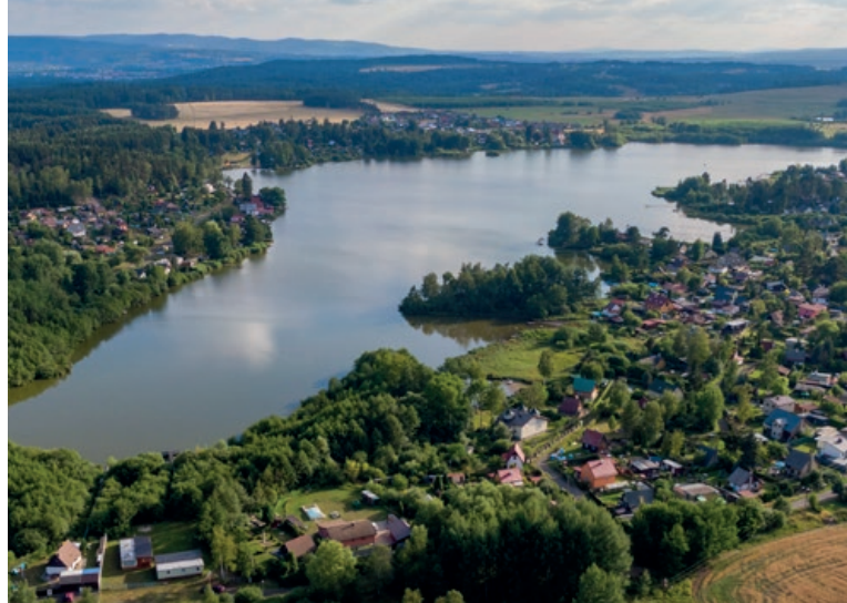
Ve vesnici Velký rybník trvale žije asi jen 250 lidí, přesto se tu místnímu spolku daří.

Díky dotaci jsme mohli rozšířit majetek spolku o několik nůžkových rozkládacích stanů, které jsme již využili právě při pořádání letošního Benefičního dne, a které využijeme i pro pořádání dalších budoucích spolkových akcí. Činnost velkorybnického spolku je totiž různorodá, a zdaleka se nezabývá jen přítomností, myslí také na budoucnost. Děkuji všem členům spolku, kteří se aktivně podílejí na jeho činnosti i na údržbě a rozvoji celé lokality Velkého Rybníka a Ruprechtova, a také děkuji