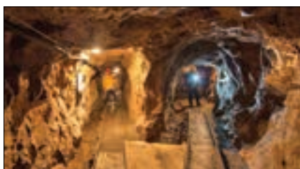
Štola č. 1

Dita Poledníčková manažer cestovního ruchu