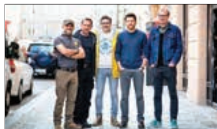
Prvok, Šampón, Tečka a Karel