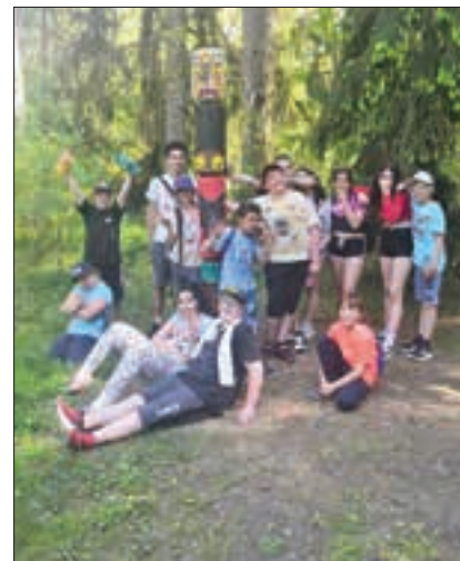
Během projektu „Indiáni“ měli svůj totem, tvořili oblečení, lapače snů a mnoho dalšího