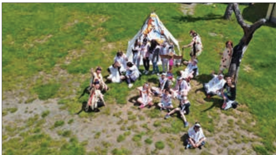
Na závěr školního roku strávili žáci pět dní jako indiáni