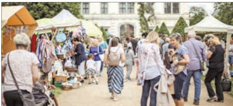
Na jarmark radosti jste zváni do Zámeckého parku.