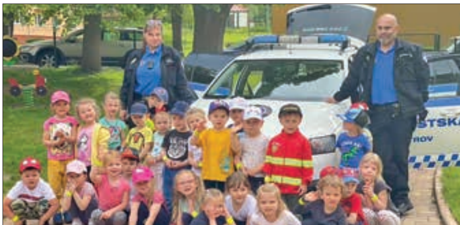
Děti si užily den s Městskou policií Ostrov