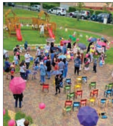
K závěru roku patří tradiční stužkování a loučení s předškoláky