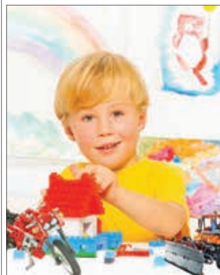
Na Staré radnici si můžete hrát