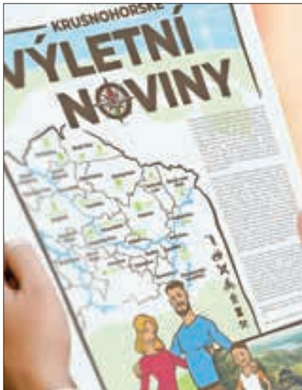
Titulní strana Krušnohorských výletních novin

činnosti, která mohla být praktikována v tu dobu ve venkovních prostorách. S postupnými vyhlídkami na rozvolnění jsme noviny obohatili i o místa, která nabízí zají-