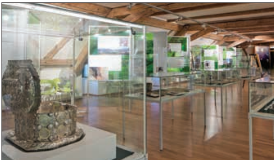
Celkový pohled do expozice Šlikové na ostrovském panství - bohatství a moc

Expozice je otevřena každý den kromě pondělí od 9.30 hod. do 16.30 hod. Neváhejte a navštivte expozici slavného rodu Šliků, který na ostrovském zámku v 17. století žil. Jako bonus k vaší návštěvě můžete zhlédnout zdarma, a to i o víkendu, expozici nejucelenější sbírky ostrovského porcelánu z kdysi světově významné, dnes již zaniklé, ostrovské porcelánky Pfeiffer & Löwenstein. Pro návštěvníky jsou připraveny další tipy na výlety za poznáním a nové propagační materiály i předměty.