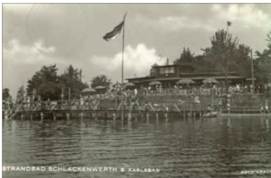
Městské koupaliště na Ottově rybníce ve 30. letech 20. století.

Nebylo tomu tak ale vždy. Dříve než bylo postaveno v novém městě moderní koupaliště, vyrážely děti za vodními radovánkami k okolním rybníkům. Snad nejčastěji se chodilo na Ottův rybník za klášterním areálem. Právě na tomto rybníce zřídilo město v roce 1929 městské koupaliště. Postupná výstavba měla probíhat v letech 1929 až 1931. Dřevěná mola ohraničovala bazény pro neplavce, nechyběly převlékací kabinky, byl zde i skokanský můstek či půjčovna lodiček. Zakrátko vyrostla i výletní restaurace a taneční parket. Nové sportoviště se