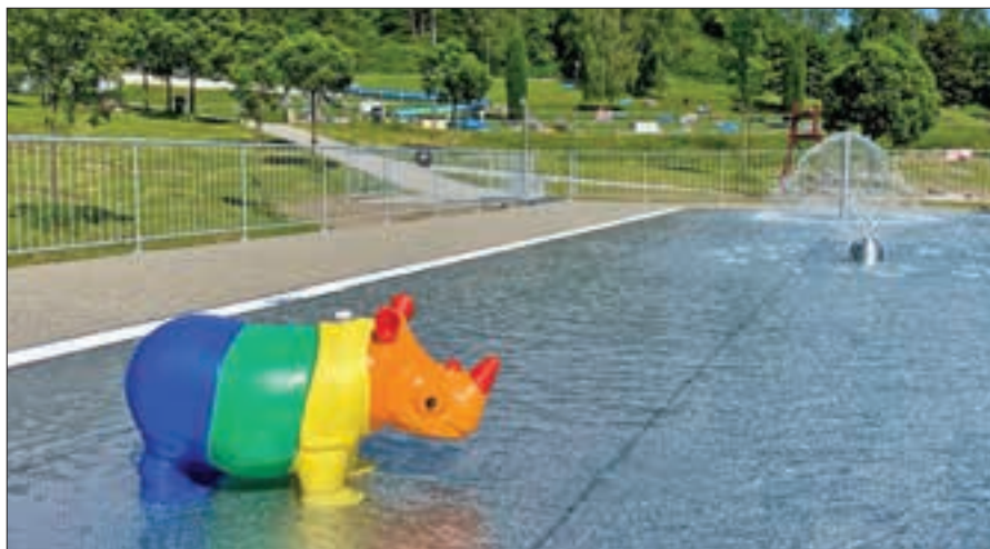
Sezona na městském koupališti letos začala 1. června

Jak již bylo avizováno v některém z minulých čísel Ostrovských měsíčníků, v další etapě, která začne ještě v tomto roce, bude realizována obnova velkého bazénu. Základ nového bazénu budou tvořit čtyři plavecké dráhy délky 25 m, které jsou částečně odděleny od části bazénu určené právě k relaxaci a zábavě. V relaxační plavecké zóně budou umístěna podvodní lehátka se vzduchovou masáží, chlříči a masážními tryskami. Zvláštní prostor pak zaujímá sektor pro děti a mladistvé, kde budou vybudovány široké skluzavky a dopadová místa pro tobogan. Chybět nebudou ani další oblíbené atrakce, jako houpací bazén s možností zhoupnutí se na vlastních vlnách, malé plovoucí ostrůvky