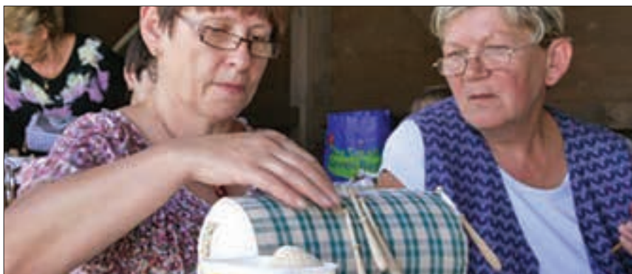
Stará radnice nabídne přehlídku zaniklých řemesel