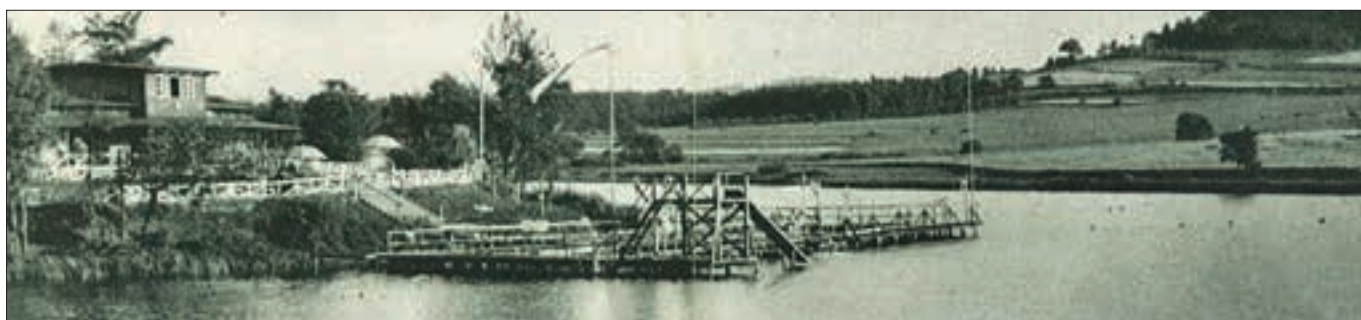
Městské koupaliště, snímek z dobového průvodce.

let později ale začalo koupaliště upadat a pustnout. Různé soukromé provozovatele v roce 1950 mělo ve správě vystřídat sokolské družstvo Vzlet. Snad měli sokolové dobré úmysly, ale 50. léta této tělovýchovné jednotě nepřála. Smlouva tak nebyla dokončena a zařízení koupaliště několik let nikdo neopravoval. Roku 1956 obyvatelé města neutěšený stav sportoviště a restaurace kritizovali. Národní výbor proto naplánoval provést v roce 1957 opravy v rámci akce Z. Plány šly dokonce tak daleko, že se v roce 1958 měla u koupaliště zřídit rekreační osada. Do