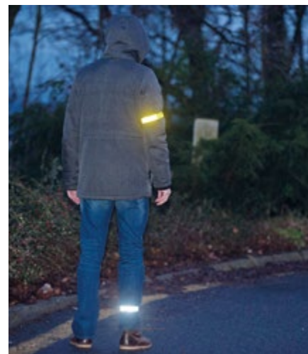
Reflexní prvky dokáží zachránit lidský život.

Chodci by tedy měli vždy pamatovat na to, že žádný řidič nedokáže zastavit vozidlo, pokud chodce zahlédne