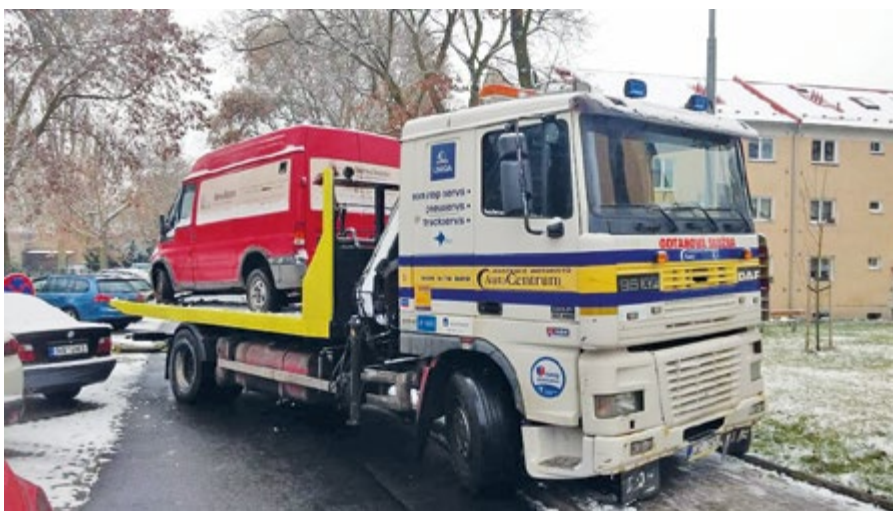
Z ulic města bylo v minulých dnech odtaženo už deset autovraků.