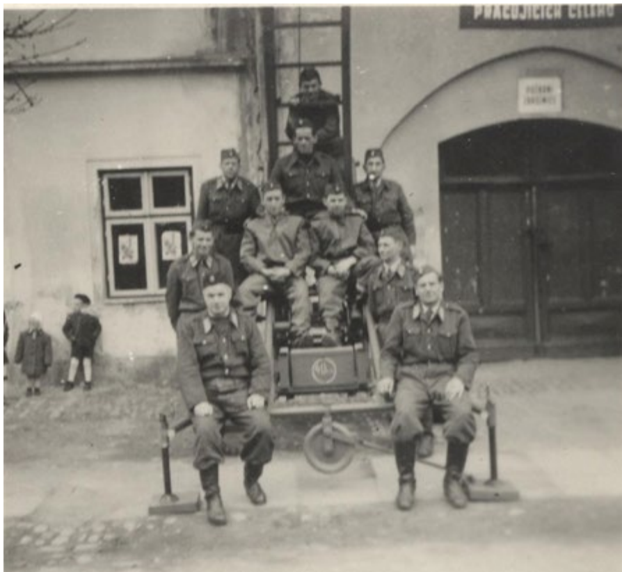
Foto: Tentokrát dobrovolní hasiči zasahovat nemuseli, snímek před hasičskou zbrojnicí v 50. letech 20. stol.

Dalším šetřením bylo zjištěno, že za nenadálou událost si vlastně může mladá žena sama. Odpoledne vysypala žhavý popel do dřevěné bedny. Ta zůstala v patře domu po odsunutých Němcích. Domnívala se, že když mohli do bedny sypat popel Němci, může ona také. Jenže mělo to háček, v bedně kdosi zapomněl pistolový náboj a žhavý popel se postaral o večerní rozruch.