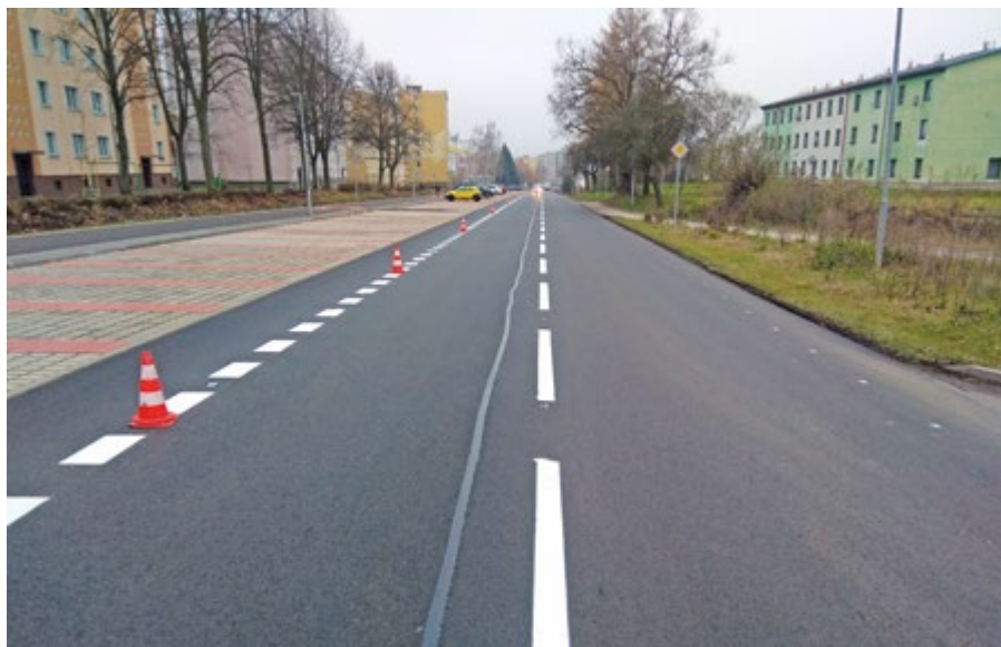
Na trase bývalé vlečky vzniklo 130 nových parkovacích míst.

„Celkové náklady za výše uvedené činnosti činily 13 569 810,12 Kč včetně daně z přidané hodnoty,“ dodal Jan Bureš. (kor)