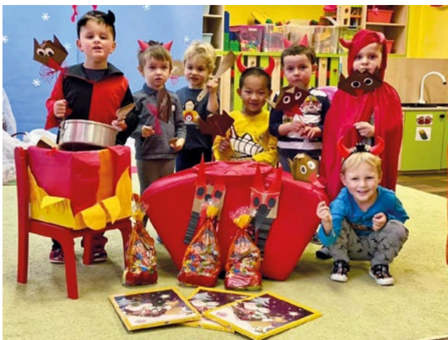
Předvánoční čas si děti v mateřské škole náramně užívají.