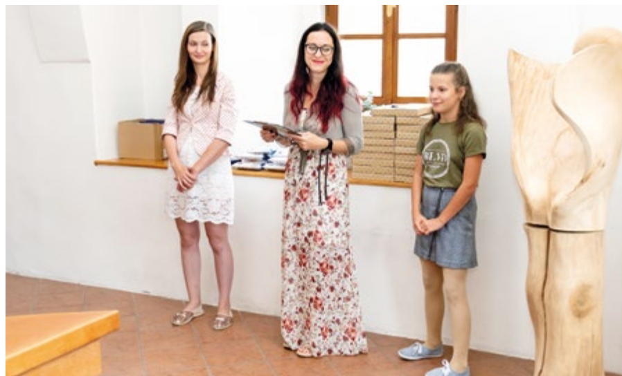
Vítání občánek 27.6.2020 Stará radnice Ostrov