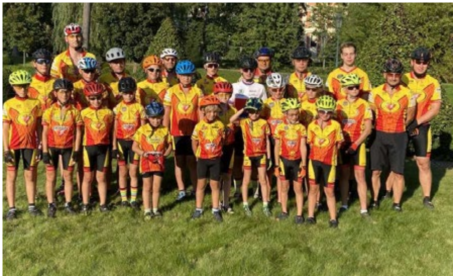
Závodníci Cykloteamu Ostrov byli i v letošní covidové sezóně vidět a zářili v plné kráse.