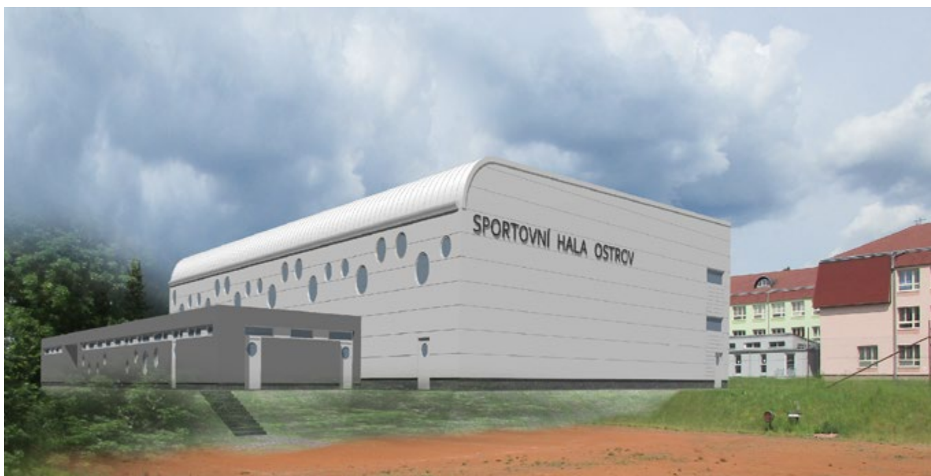
Jednou z největších investic města v příštích letech má být stavba nové sportovní haly u gymnázia.

V oblasti výstavby a revitalizace sportovní infrastruktury je město připraveno v maximální možné míře využívat dotační možnosti evropských a státních programů. Předpokládá se, že i Karlovarský kraj se stabilně zapojí do spolufinancování investic do sportovní infrastruktury. (jj)