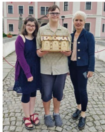
Žáci školy se účastnili soutěže Svatý Maur očima dětí.