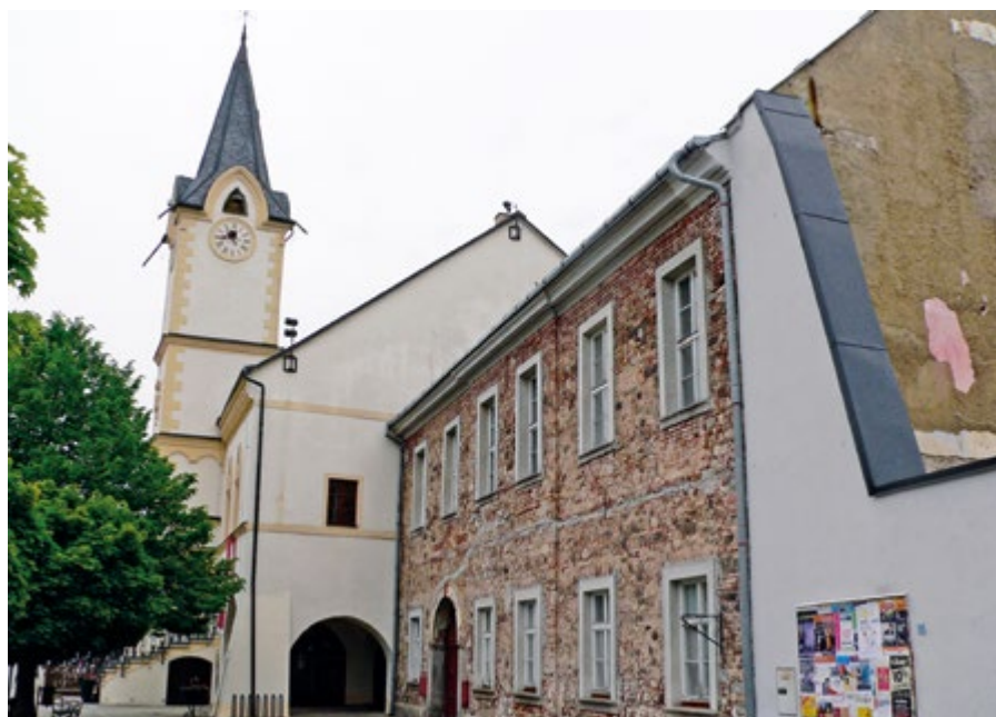
Zastupitelé schválili prodej domu č. p. 48 na Starém náměstí.

nižší cenu, než za jakou se pořídil. Věřím, že tímto projektem dojde k dalšímu oživení Starého města. Podmínky prodeje dávají investorovi dostatečnou volnost, na druhou stranu z pohledu města minimalizují riziko neúspěchu tohoto projektu. Pokud se to totiž nezdaří do 6 let, tak se dům vrátí městu a zůstane nám polovina kupní ceny,“ dodal starosta s tím, že to byly hlavní důvody, proč zastupitelé odsouhlasili tento prodej. (kor)