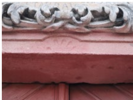
Lednová hádanka.

Lednová hádanka je opředena dávným tajemstvím. Do dnešních dnů se nám nedochovalo mnoho pověstí, které by byly spojeny s naším městem. Je však jedna, ve které figuruje ďábel. Otisk jeho krvavé dlaně je dodnes patrný nad vstupem do objektu, který dnes hledáme. Víte, na které stavbě údajně přiložil ďábel ruku k dílu?