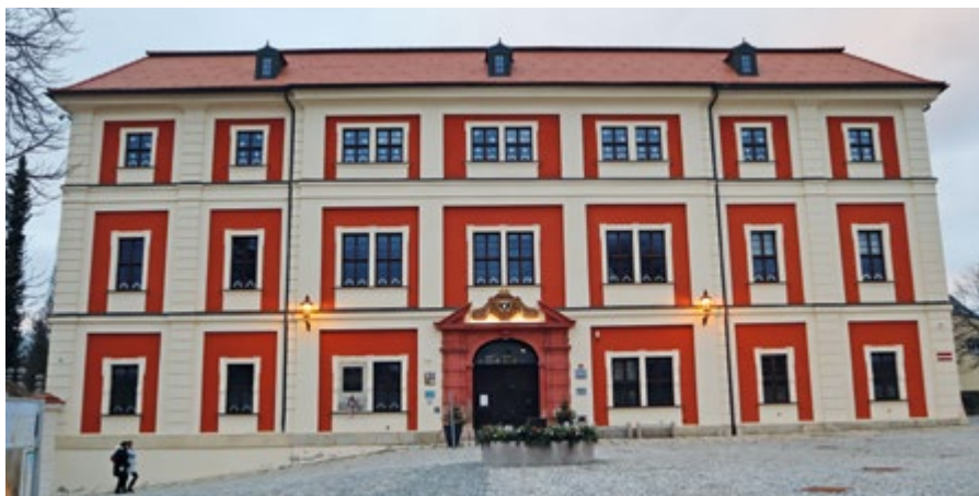
Řešení fotohádky z prosincového čísla.