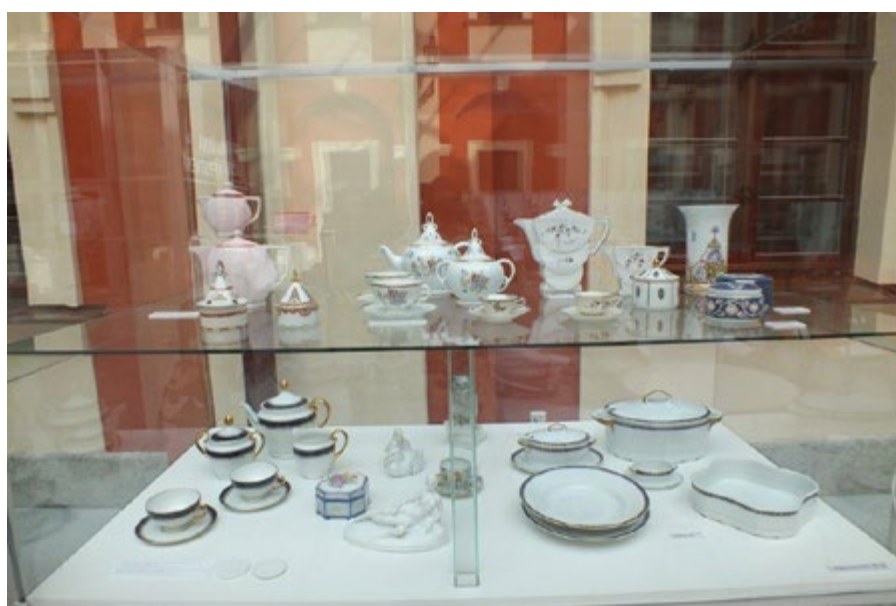
Výstavu ostrovskeho porcelánu můžete vidět ve dvoraně zámku.