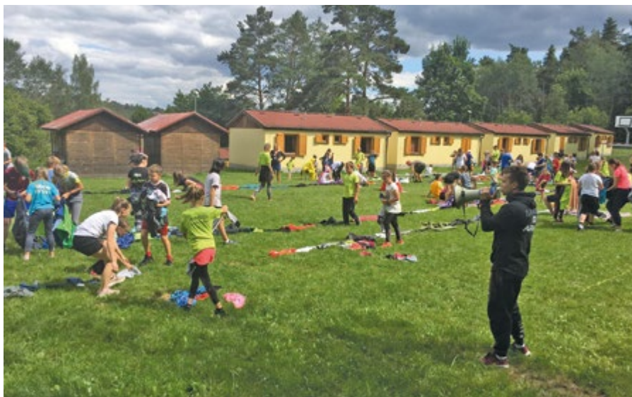
Letní tábory v Manětíně jsou velmi oblíbené a děti si je vždy užijí.

kritéria pro přijetí: přednostně pro děti z fotbalového kroužku MDDM termíny: 16.–20. 8.