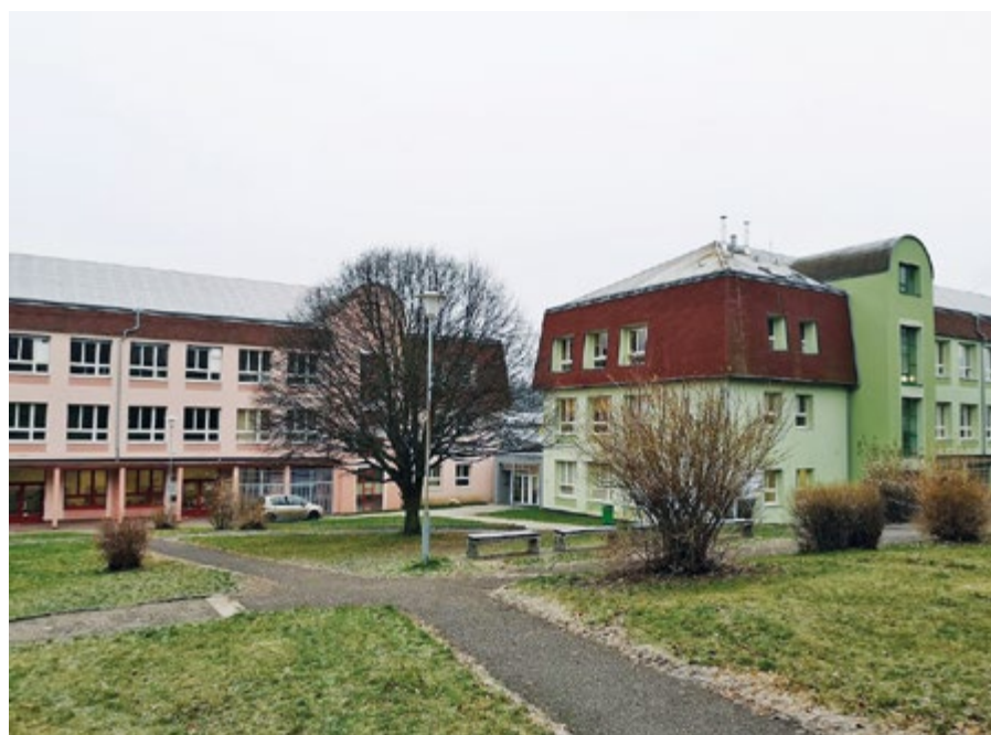
Do budovy ostrovského gymnázia jste zváni 16. ledna na den otevřených dveří.