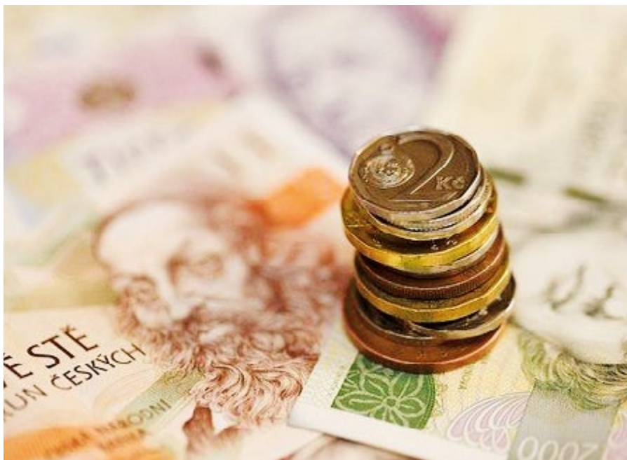
Ostrov bude v příštím roce hospodařit se schodkovým rozpočtem.

„Doposud jsme zaznamenávali v oblasti daňových příjmů, které jsou nejdůležitějším a objemově nejvyšším zdrojem příjmů města, zvyšující se podíl na celkových příjmech města. To ale neplatí pro rok 2021, kde se očekává, že současná situace způsobená šířením nákazy koronaviru a dopad přijatých opatření proti šíření nákazy budou mít negativní vliv na českou ekonomiku a odrazí se