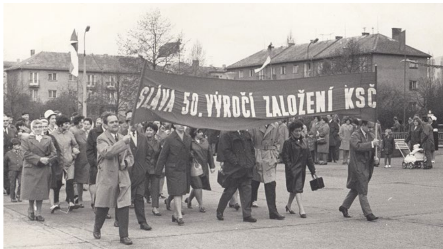
Oslava 50. výročí založení KSČ proběhla v Ostrově 16. května 1971.