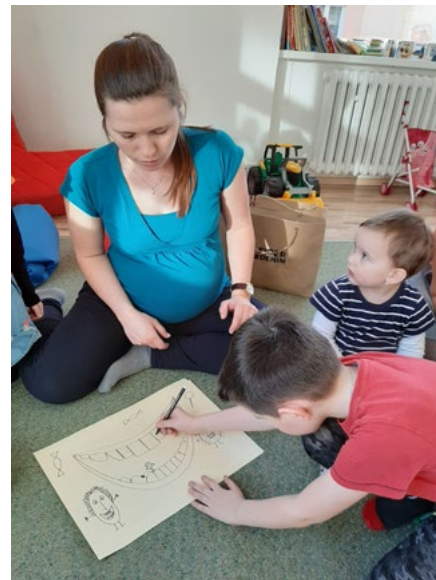
V centru si užijete spoustu zábavy.