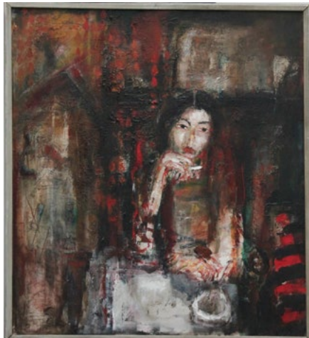
Josef Jíra, Divadlo světa Luisa , 1985, olej, plátno, 100 x 90 cm.

Výstava představí malířskou tvorbu významné osobnosti českého