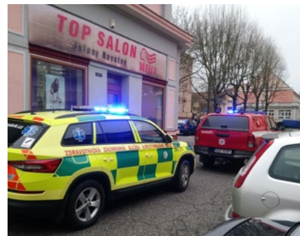
Hasiči pomáhají s transportem pacienta do sanity.