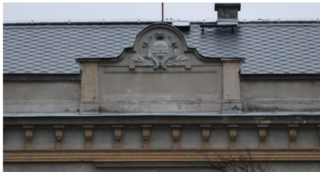
Dubnová hádanka.