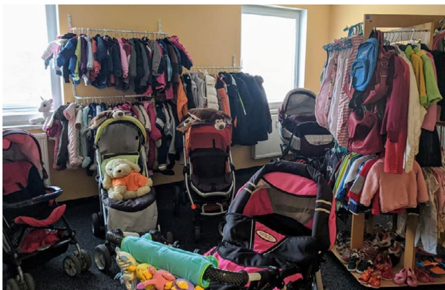
Centrum poskytuje také materiální zajištění rodičům samoživitelům.

Jitka Havránková, Centrum Nádech - pomoc a podpora rodičů samoživitelů, z. s.