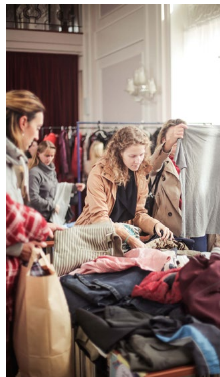
Přineste vyřazené oblečení. Třeba se hodí někomu jinému.