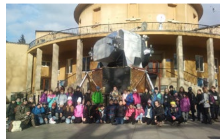
Výstava Cosmos Discovery provedla žáky historií pilotovaných kosmických letů.