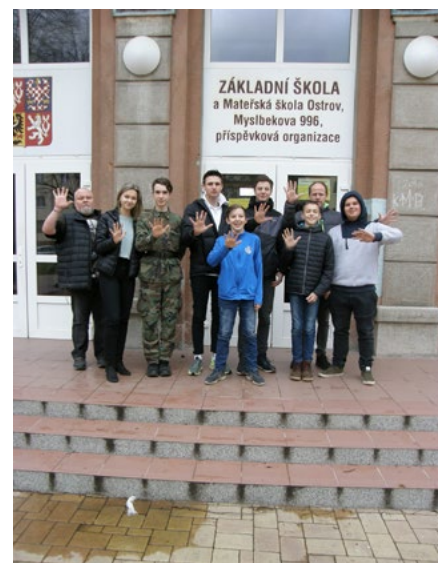
Žáci se zapojili do jedinečného projektu.