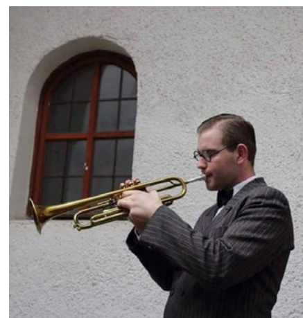
Jana Veverku zajímá spíš swing a tradiční jazz.