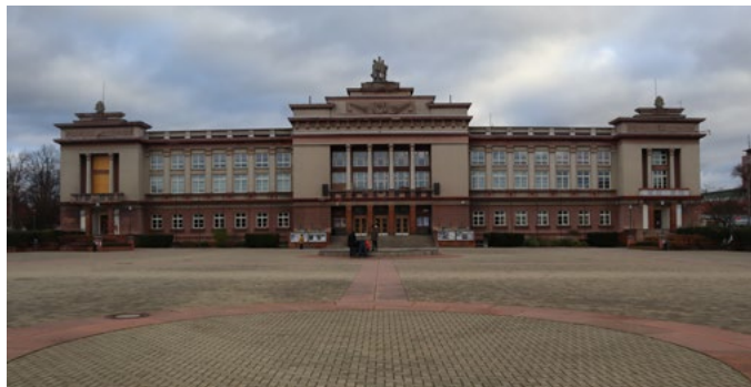
Řešení fotohádkanky z březnového čísla.