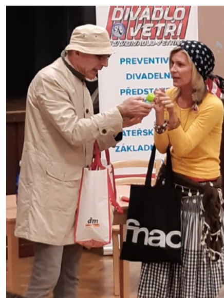
Představení poradilo seniorům, jak nenaletět.

Jitka Capková, odbor sociálních věcí a zdravotnictví MěÚ Ostrov