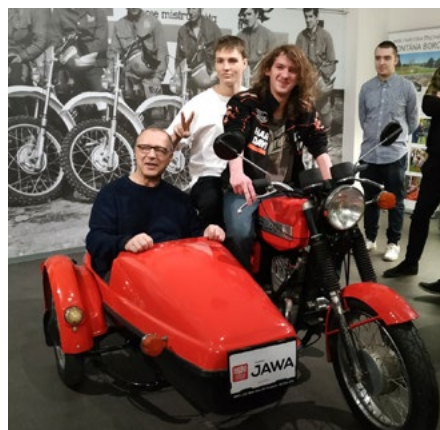
Třída AT3 na prohlídce motocyklů v Praze.