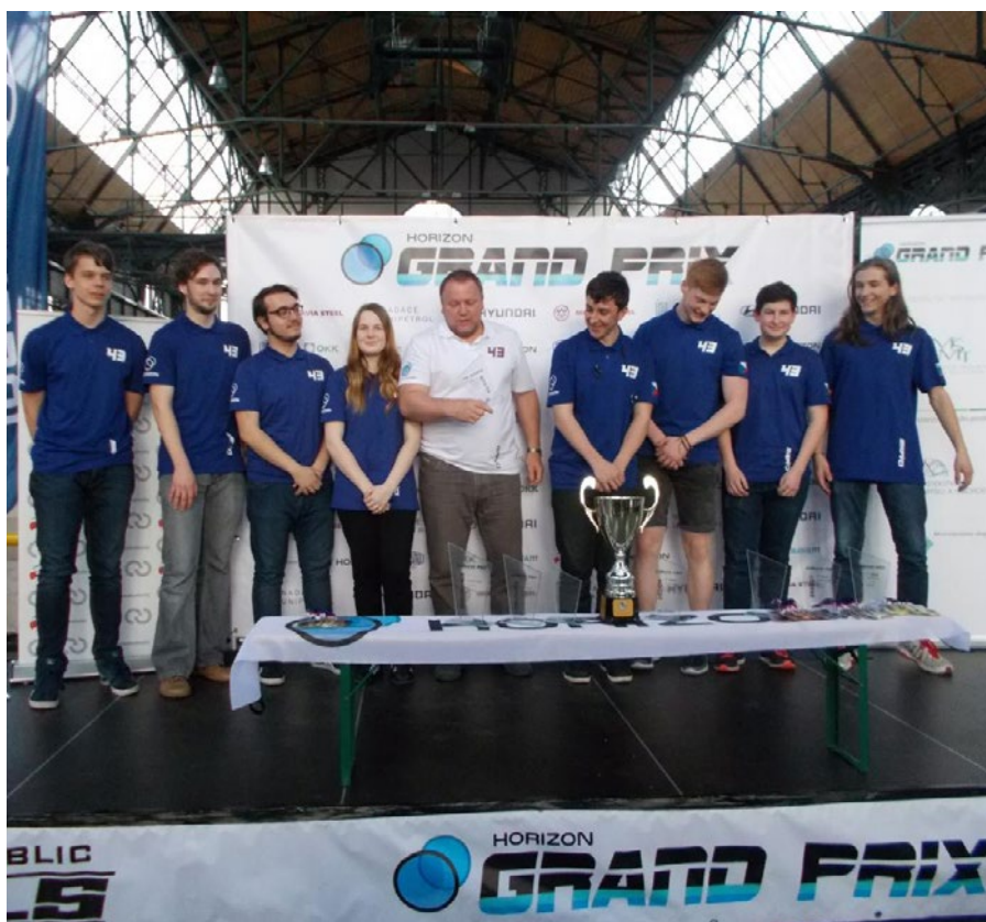
Tým závodníků s RC modely.

Jeden se ani nenadál a po dobrodružných, poučných i pracovních prázdninách opět usedáme do školních lavic a stoupáme si před tabule. Pro cca 200 studentů prvních ročníků začíná nová etapa života. Stávající osazenstvo má však na co navázat. Individuálních úspěchů bylo nespočet, např. studenti oboru Elektrotechnika si jistě užili peněžních odměn