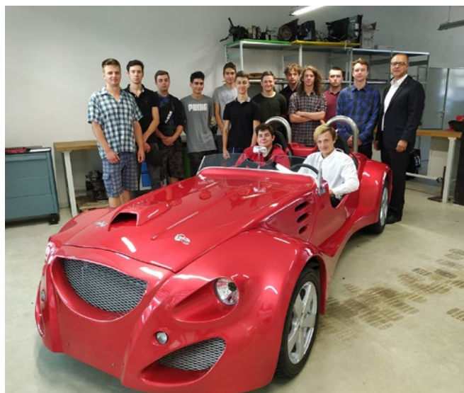
Studenti přetvořili Favorit v tohoto krasavce.