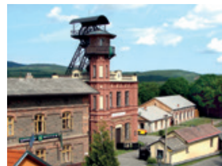
Hornický skanzen Březové Hory – Hornické muzeu