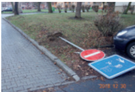
Se značkami si pohrál vítr, s košem vandalové

se na místě nenacházeli žádní svědci, poučila hlídka mladíka, jak zacházet se zábavnou pyrotechnikou a ten se po úklidu místa odebral domů.