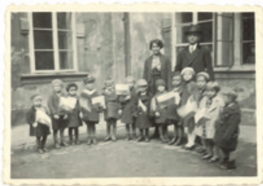
Fotografie byla pořízena v říjnu 1935 ve školce na zámku.