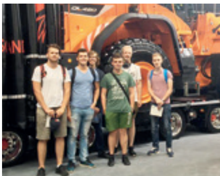
šestice úspěšných účastníků republikového kola SOČ na exkurzi v Německu

A jaká byla kritéria výběrové komise? Při posuzování kladla důraz především na pohotovost, jasnou a entuziastickou prezentaci jednotlivých soutěžících, společenský dopad práce a kvalitu vyjadřování v jazyce anglickém. Zvládnutí všech těchto aspektů je totiž nezbytným předpokladem pro úspěch v navazujících zahraničních soutěžích.