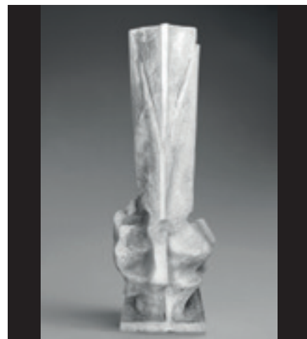
Foto Bořivoj Hořínek – sádrový model plastiky Jana Hendrycha „Památník Republiky 1968“