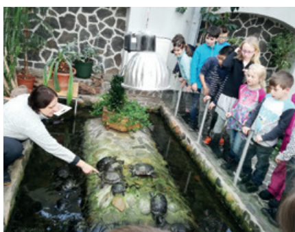
ZŠ Májová podporuje u dětí vztah k přírodě