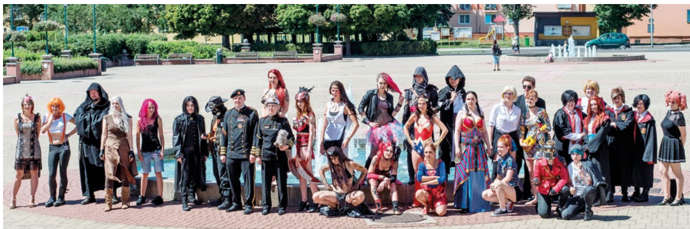
Cosplayeři v kostýmech svých oblíbených komixových a fantasy hrdinů