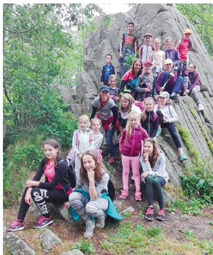
Soustředění Nové Hamry