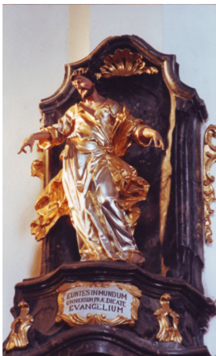
Kristus na kazatelně farního kostela