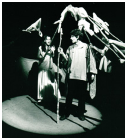
Ondráš nebo Juráš