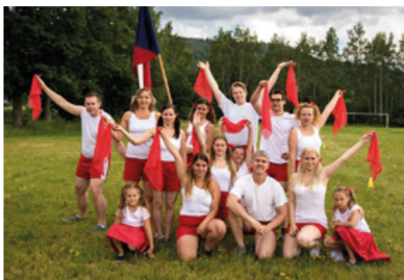
Spartakiáda? Srandakiáda!