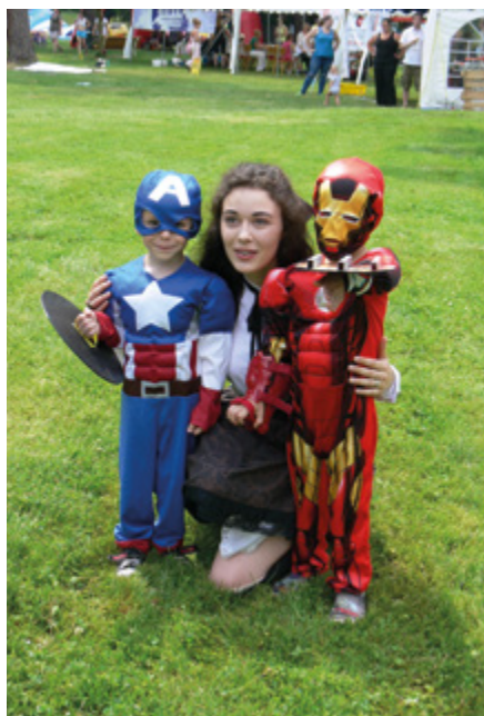
OstroFcon si užívají i ti nejmenší.