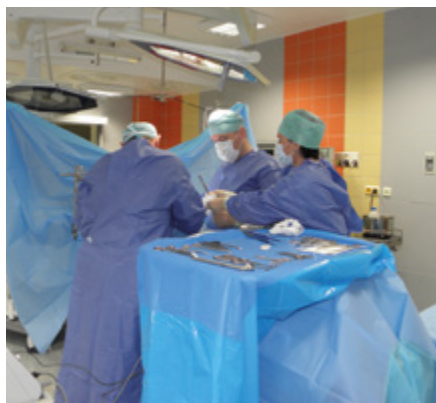
Centrum jednodenní a plánované chirurgie je v provozu už rok.

Lékaři z Centra jednodenní a plánované chirurgie Nemocnice Ostrov mají za sebou téměř 900 operací