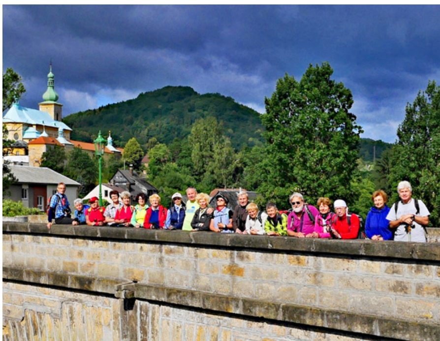
Velká Police na Českolipsku

Bližší informace (doba odjezdu, počet km, org. propozice) budou k dispozici vždy od středy pro příslušný sobotní termín ve vitríně KČT na Mírovém náměstí u autobusové zastávky na Karlovy Vary. Bližší údaje jsou na internetové adrese: www.kctkvary.cz