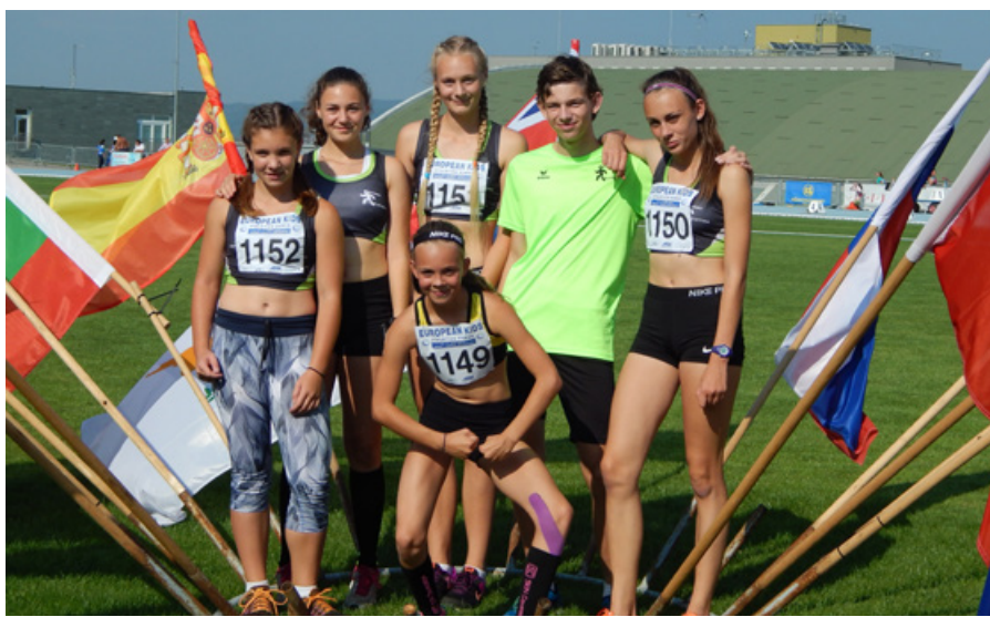
Vyprava ostrovského atletického oddílu na Evropských hrách

své hlavní disciplíně 1500 m vybojoval časem 4:43,99 krásné páté místo. Také běžel spíš doplňkově 300 m a svým časem 39,21 s skončil o 0,002 s na nepopulárním „bramborovém“ místě. Škoda, že nezacinkalo! Kristýna Sedlecká běžela 1500 m a svým časem 5:22,82 obsadila 10. místo. Škoda, že Týna byla zařazena do druhého běhu a běžela sólo závod. Veronika Burešová jen těsně časem 16,43 s nepostoupila do finále A na 100 m překážek. Ve finále B zvítězila, a tak celkově obsadila deváté místo. Karolíně Štěrbové se závod ve skoku dalekém nevyvedl a její tři těsné přešlapy ukončily sny o finále, které by si svými předvedenými výkony jistě vybojovala. Nutno podotknout, že se dálkařky potýkaly s velkým protivětrkem, který foukal i 10 m/s. Hry ukončily oblíbené štafetové běhy. My jsme sestavili štafetu 4 x 60 m starších dívek, ve složení: Pelcová, Sedlecká, Štěrbová, Burešová. Dívky obsadily 11. místo ze 45 štafet. Všem atletům patří velký dík za reprezentaci našeho oddílu a města! (I když komentátor nás neustále nazýval Ostroměří.)