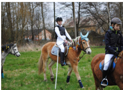
V Ekocentru Ostrov jsme na Dni Země povozili děti.

Oblíbené přenocování v areálu EC pro děti ve věku 7-10 let. Spousta zábavy a legrace, soutěže a noční hra. Přihlášky od 10. 10. on-line nebo v kanceláři EC. Cena 150 Kč