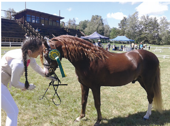
Mezinárodní šampionát v Hradci Králové

O prázdninách jsme stihli i dětmi oblíbené letní příměstské tábory. V září vítáme v kroužku nové Mladé chovatele a jedeme povozit děti na Michaelské pouti... Závodní sezona pomalu končí, a tak chystáme rozloučení v podobě II. Pony Huberta, který plánujeme na začátek listopadu. Dále nás ještě letos navštíví klubový Mikuláš a tradiční vánoční výprava ke krmelci. Děkujeme za podporu naší činnosti městu Ostrov a za přízeň našich partnerů a fanoušků! Více na: www.primahorseland.snadno.eu , https://www.facebook.com/staj.primahorseland