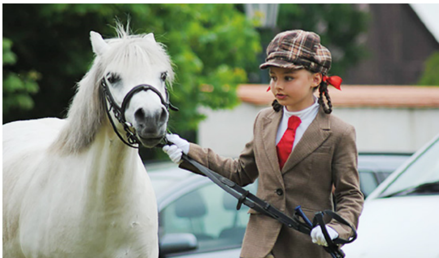
I na Sportáčku 2016 v K. Varech jsme představili náplň našeho klubu.