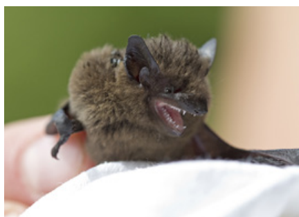
Netopýři hvízdají se každoročně snaží usadit v obytných prostorech.

„Většinou vjezdů odmítneme uskutečnit, lidé si musí poradit sami. Jedině to je totiž donutí, aby si napříště svůj majetek dostatečně a včas zabezpečili a tím ušetřili práci