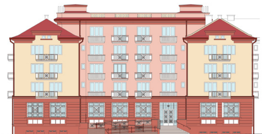
Pohled na budoucí bezbariérový vstup na poštu.

Skupina komunitního plánování Triáda neusíná na vavřínech a na podzim ji čeká další trasa mapování, tentokrát se zaměří na novou radnici a Staré město. Do procesu mapování se můžete zapojit i vy informacemi o přístupnosti svých objektů, nebo pokud sami narazíte na nějakou překážku. O přístupnosti veřejných budov ve městě či o spolupráci s Triádou se můžete informovat u koordinátorky komunitního plánování Jitky Čapkové na: icapkova@ostrov.cz, tel. 354 224 859