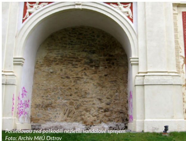
Pohledovou zeď poškodili nezletilí vandaloři sprejem.

Vandalové, kteří poškodili chráněnou památku v Ostrově, se přiznali. K poškození části Pohledové zdi v Zámeckém parku se na ostrovskou služebnu Policie ČR přiznaly dvě nezletilé osoby. Policie vzhledem k věku obou dětí, které se ke svému činu přišly samy přiznat, nebude zveřejňovat žádné další informace.