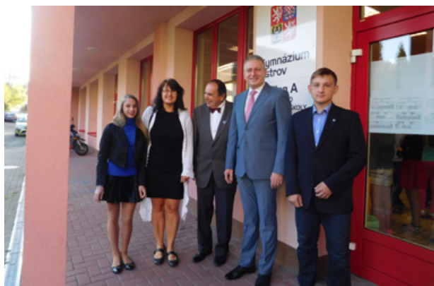
Vedení gymnázia a studenti přivítali hejtmana před školou.