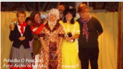
Pohádka O Palečkovi

Divadelní pohádka v podání ochotní- ků DK Ostrov. Vstupné 40 Kč