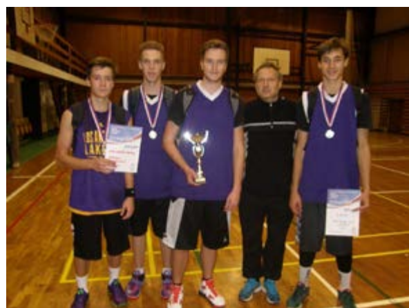
Úspěšní basketbalisté