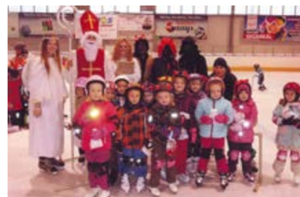
S našimi dětmi si zabruslil Mikuláš.

Vánoční čas bývá ten nejkrásnější i u nás ve školce. V prvním prosincovém týdnu děti navštívil Mikuláš. Přišel za nimi na zimní stadion a pěkně si zabruslil. Další dny jsme se radovali z nádherně nazdobených stromčků, které nám tentokrát darovali rodiče Kristýny Blažkové. Děkujeme. Ježíšek na nás také nezapomněl. Dostali jsme velký dárek: interaktivní tabuli, z které máme opravdu radost, také za ni moc děkujeme. Těšíme se na nové výukové metody, zaměřené hlavně na přípravu dětí do základní školy.