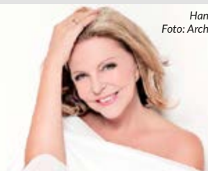
Hana Zagorová