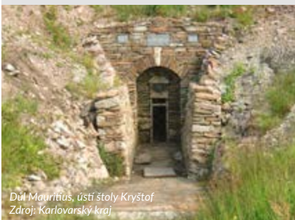
Důl Mauritius, ústí štoly Kryštof

Úspěšná repríza putovní výstavy projektu Propagace hornické krajiny Krušnohoří – Montanregion. Výstava je věnována více než 800leté tradici dobývání rud v Krušnohoří. Tato oblast představuje ojedinělý fenomén kulturní krajiny, utvářené po staletí hornickou činností. Přijďte se podívat, co dokázali naši předkové s železky, mlátky, ohněm a s použitím důmysl- ných technických zařízení. Vstupné: 30 Kč, 20 Kč, 10 Kč