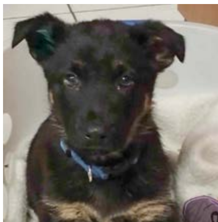
Nový policejní pes Sir Black Chabet

Při pravidelné kontrole katastru města si hlídka povšimla, že na mostní konstrukci v ul. Hroznětínská neznámý pachatel nastříkal hanlivý nápis přes kresby, které zde namalovaly křídou místní děti. Hlídka provedla šetření mj. i na facebooku, kde zjistila, že jeden z uživatelů se tímto činem veřejně chlubí. Veškeré informace a důkazy pak hlídka předala Policii ČR. Muž se ovšem 26. listopadu pod mostní konstrukci vrátil, aby svou „chybu“ napravil