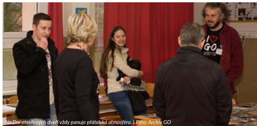
Na Dni otevřených dveří vždy panuje přátelská atmosféra.

škol, kteří podají přihlášku na naši školu, přípravné kurzy na tyto zkoušky. Jejich obsahem bude řešení testů společnosti CERMAT a jejich následný rozbor pod vedením pedagogů gymnázia. Kurzy jsou zdarma. Bližší podrobnosti o organizaci těchto kurzů i přijímacích zkoušek najdete na webových stránkách školy: www.gymostrov.cz Zároveň zveme všechny zájemce na prezentaci 3D laboratoře, která byla vybudována v rámci projektu Podpora přírodovědného a technického vzdělávání v Karlovarském kraji. Seznámíte se s moderními výukovými technologiemi, které žákům umožňují zkoumání přírodních zákonitostí zcela novým a pro ně atraktivním způsobem.