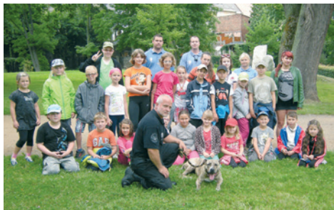
Příměstský tábor MP.

Dne 17. července 2014 ve 14.36 hod. přijala hlídka MP SMS zprávu, že se po ulici Májová pohybuje opilý chlapec. Po příjezdu na místo hlídka zjistila, že se jedná o teprve desetiletého chlapce, který byl ve vysokém stádiu opilosti. Ten byl hlídkou MP ihned převezzen do ostrovské nemocnice, kde byl hospitalizován. Na místo byla přivolána pracovnice OSVZ, která si celou událost převzala. Hlídka MP následně vyhledala pěstounku desetiletého chlapce a s celou situací ji seznámila. Díky práci APK byl poté i vypátrán mladík, který alkoholický nápoj koupil a chlapci jej podal. Celá událost je v šetření OSVZ a přestupkové komise.