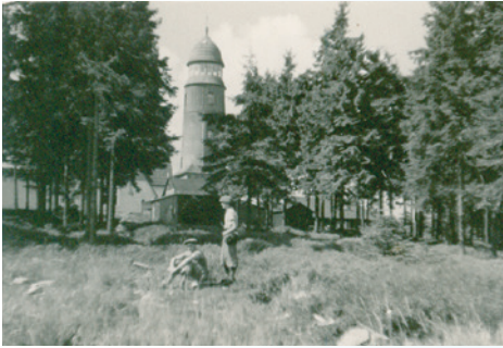
Blatenský vrh v 30. letech.