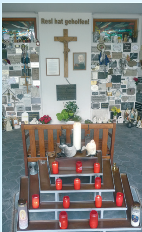
Pomník s děkovnými plaketami.