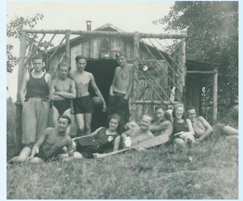
Karlovarští skauti 1932.

I dnes má ale Ostrov co nabídnout. Kdo chce nasát atmosféru starých časů, může trávit chvíle v posvátném okrsku. Také zámek dýchající novotou má jistě co nabídnout. Najdou se však i místa tajemná jako šibeniční vrch, či pověstmi opředená Popovská hora se svým křížem. Kdo ví snad někdo ten tajemný poklad jednou