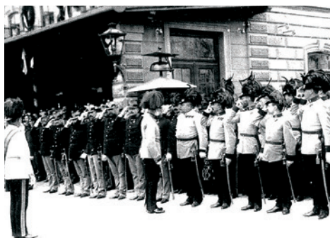
Zdroj: Archiv Vojtěcha Písačky.

Ještě k výstavě „100 let od první světové války“, která probíhá ve dnech 3. září – 3. října. Část výstavy je věnována československým legiím. Právě ona dobrovolná účast Čechů a Slováků v armádách Dohody a jejich oběti přispěly významně ke vzniku a uznání samostatné Československé republiky. Tato hnutí se spontánně organizovala ve Francii (1915), v Rusku (1917) a v Itálii (1918). Češi a Slováci se hlásili v menší míře také do armády srbské (1916). Šlo především o zajatce a přeběhlíky z rakouské armády. Organizačně a finančně podporovali osvobozenecy zápas i krajané z Ameriky. Roku 1916 uskutečnili také nábor dobrovolníků pro kanadskou armádu. Od roku 1917 se na 2 300 našich mužů podílelo v kanadské armádě na bojích ve Francii, mezi jinými v bitvách u Vouziers a Teronu.