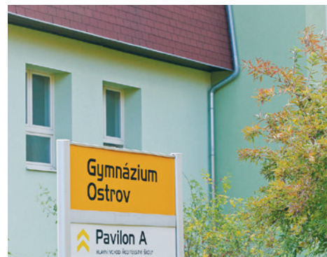
Pavilon B gymnázia.

V minulém roce oslavilo ostrovské gymnázium již 60. výročí svého působení. To však neznamená přípravy na důchod. Naopak, do následujícího školního roku vstupuje s mladistvým optimismem a několika změnami.