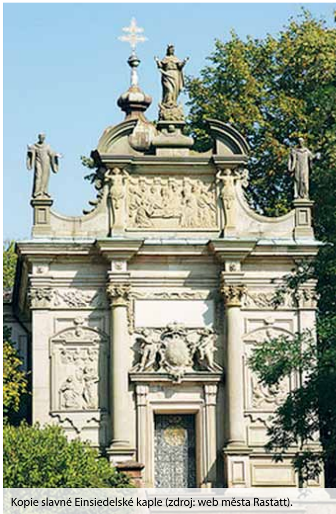
Kopie slavné Einsiedelské kaple (zdroj: web města Rastatt).

V letošním roce čeká naše partnerské město Rastatt v rámci oslav 300. výročí rastattského míru řada významných kulturních a společenských akcí. Oslavy propuknou ve čtvrtek 6. března 2014 – v den podpisu tohoto aktu, který znamenal po století válek v této oblasti konečně mír a možnost rozvoje Bádenského markrabství. Mladé město Rastatt, založené Ludwigem Wilhelmem, markrabětem bádenským, v roce 1700, mohlo být (i když až po jeho smrti) dle jeho plánů konečně dostavěno. Franziska Sibylla Augusta nechala krátce po této události položit základní kámen další kopie Einsiedelské kaple, která byla dokončena v roce 1715 a v současnosti prochází rekonstrukcí fasády. Zatímco ostrovská kaple byla poděkováním za uzdravení jejího nejstaršího syna Ludwiga Georga, rastattská vznikla z vděčnosti za uzavření míru. Nastává období rozvoje a rozkvětu a impuls ke stavební činnosti vychází právě ze Schlackenwerthu (Ostrova), kde už se v té době nacházela řada významných staveb (kaple sv. Floriana, Einsiedelská kaple, obnovená zámecká zahrada atd.), které Franziska Sibylla realizovala. Do Rastattu přivedla z ostrovského panství i řadu umělců, architektů, malířů, dekoratérů, hudebníků a řemeslníků.