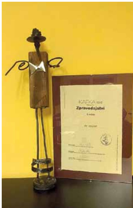
Ocenění Kafka 2013.

18:00 Zahájení programového bloku Zprávy + Informační servis Pořad: T. T. T. – Proměny – novinky ve světě úcesů a módy