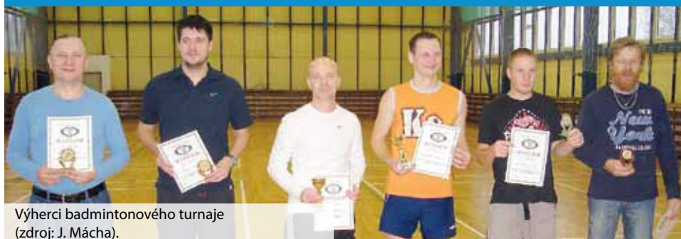
Výherci badmintonového turnaje.