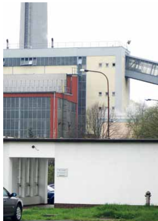
Ostrovská teplárna.