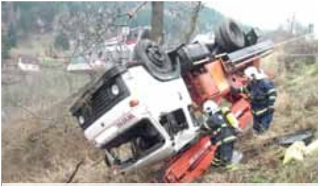
Zdroj: JSDH Ostrov.

HZS Klášterec nad Ohří. K další dopravní nehodě jsme vyjžděli s jednotkou HZS KV na silnici u Mořičova. V Odeři jsme zasahovali u dopravní nehody dvou osobních automobilů. K dopravní nehodě nákladního vozidla-pracovní plošiny na silnici č. 225/II z Jáchymova na Boží Dar jsme byli vysláni s jednotkou SDH Jáchymov a HZS Karlovy Vary, řidič a spolujezdec byli lehce zraněni. Do obce Hroznětín jsme byli vysláni k záchraně psa, který spadl do koryta potoka Bystřice a nemohl se dostat zpět na břeh, po jeho záchraně byl pes předán majitelce. Jednotky HZS Karlovy Vary, Klášterec nad Ohří a SDH Ostrov byly vyslány na požár rodinného domu ve Stráži nad Ohří. Na místě bylo zjištěno, že se jedná o prověřovací cvičení z důvodů zjištění dojezdových časů jednotek PO (v tuto dobu byl ve Stráži nad Ohří uzavřen most přes řeku Ohří).