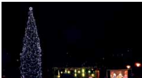
Vánoční stromek.