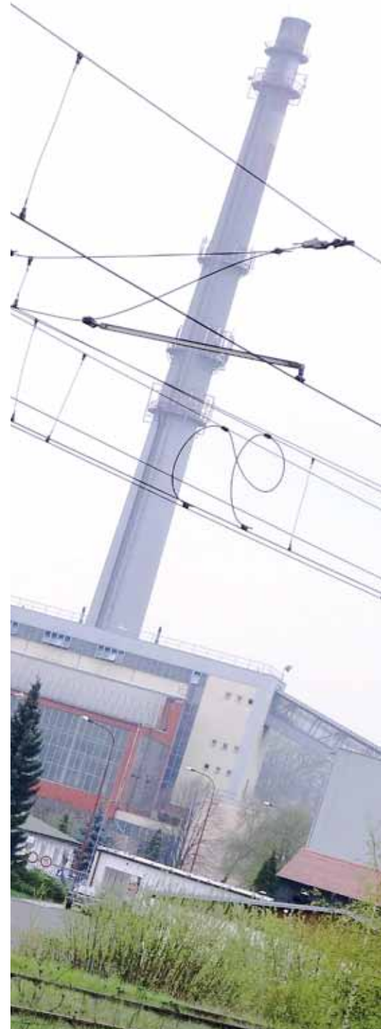
Teplárna v Ostrově (ilustrační foto: Ing. Marek Poledníček).