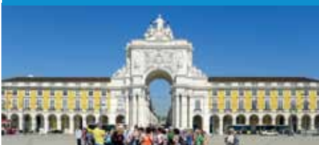
Na Palácovém náměstí v Lisabonu.