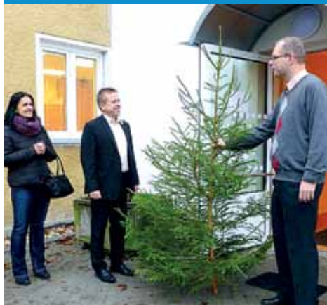
Předání vánočního stromku.

Jedná se o areál původních budov školky a jeslí z 60. let 20. století se dvěma nadzemními podlažními u hlavních pavilónů a jedním nadzemním podlažím u středového pavilónu a spojovacích krčků. V rámci projektu došlo k přestavbě hlavního pavilónu v jižní části areálu (budova A) a na něj navazujícího spojovacího krčku (budova B). Před zahájením prací byla právě část 1. NP a spojovací krček objektu využívána Oblastní charitou k provozu Domova pro seniory se dvěma pokoji s kapacitou sedm lůžek. V levé části byla provozována ordinace ortopedického lékaře. Celá přestavba probíhala za plného provozu těchto zařízení.