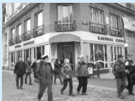
Z pochodu Kroková dieta