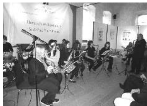
Swing Band v bavorském Schönsee

Hudební formace ZUŠ Ostrov Swing Band zakončila svým koncertem výstavu propagující město Ostrov v Centru Bavaria Bohemia v bavorském Schönsee.