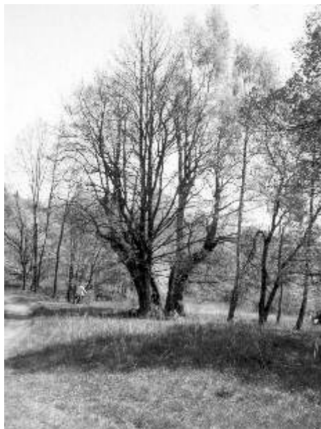
Popovská lípa (dolní)