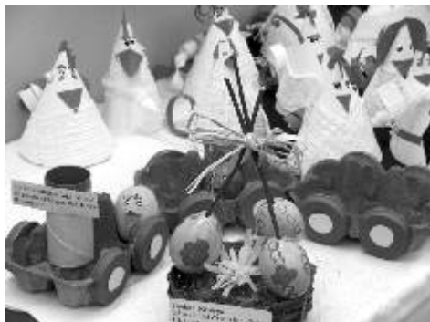
Šikovné ruce dětí dokážou vytvořit milé velikonocní dekorace.

Výsledky soutěže budou vyhlášeny a ceny předány