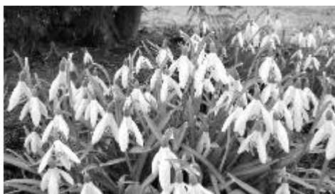
Jaro objektivem čtenářky OM