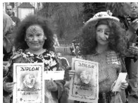
Malé vítězné čarodějnice