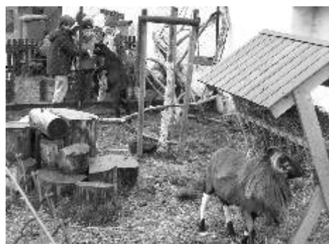
Den otevřených dveří Ekocentra láká děti i dospělé.

Informace ke sběru: pevně svázané balíky starého (nejlépe tříděného) papíru se zváží přímo na místě. Plastové lahve doporučujeme doma nejdříve sešlapat (můžete odevzdávat i s našroubovanými uzávěry), spočítat nebo zvážít, vložit do plastových pytlů a zavá-