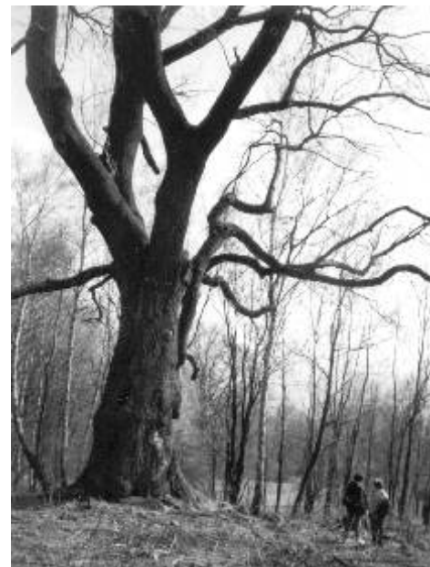
Popovský jasan - Památný strom ČR