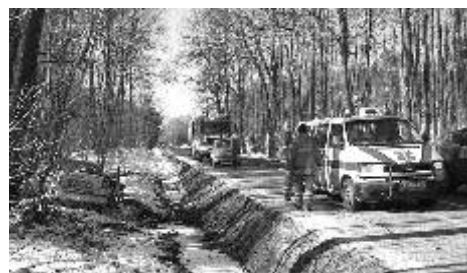
Dopravní nehoda - Damice

potřebovali obyvatelé rodinného domu ve Vykmanově, kde vlivem silných mrazů docházelo k vrstvení ledových ker a vylévání vody z koryta potoka; voda