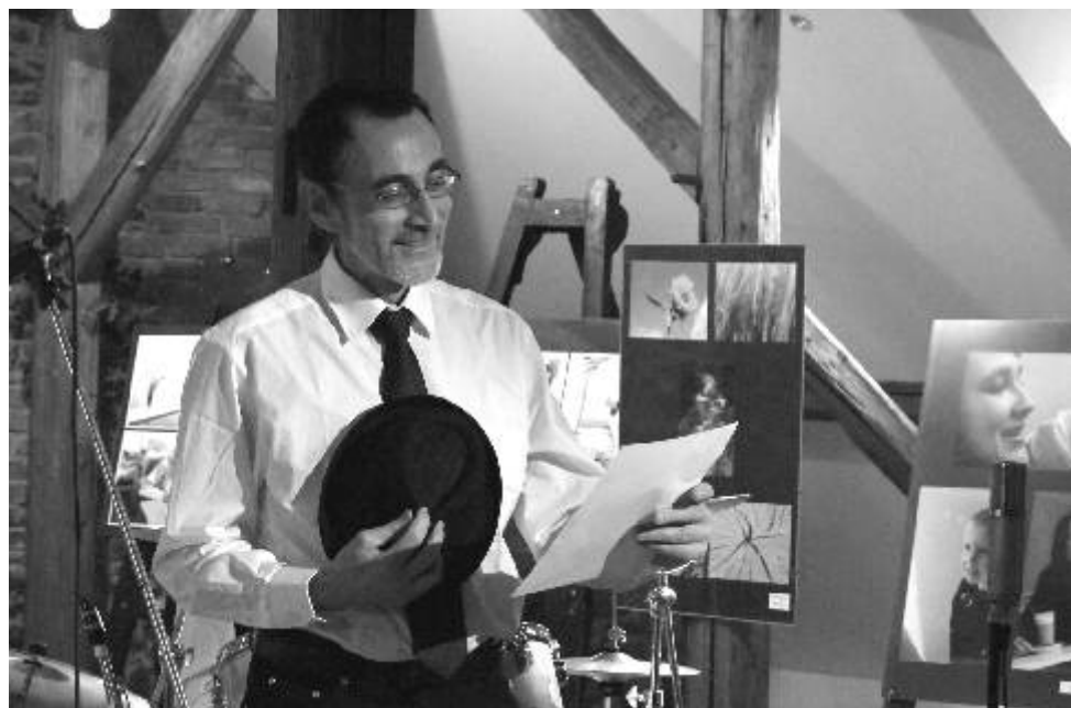
Záběr z kulturní akce na Staré radnici Ostrov