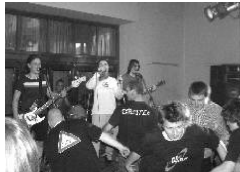
Fanoušci kapely se na Regionbeatu s chutí roztančili.

Abych řekl pravdu, my jako pořadatelé moc neplánujeme, jako muzikanti si rádi zahrajeme všude. Co ale pořádně už čtvrtý rok, je koncert v Karlových