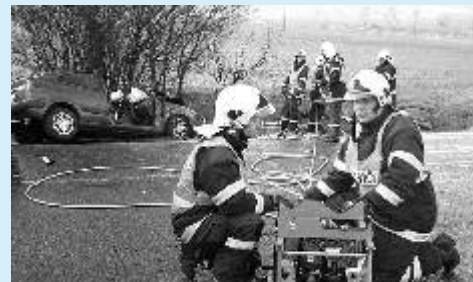
Dopravní nehoda u Květnové

Nejprve naše jednotka vyjela k požáru osobního automobilu v Jáchymově, kde již zasahovala místní hasičská jednotka, dále jsme likvidovali požár trávy u Boreckých rybníků, požár starého odpadu v Jáchymovské ulici a společně s dalšími jednotkami požár trávy u masokombinátu v Hroznětíně. O den později jsme opět vyjžděli do Jáchymova k požáru bývalé restaurace Beseda. Na místě bylo zjištěno, že se jedná o planý poplach (odraz ohně ve výloze). Byli jsme vysláni společně s karlovarskou záchrannou jednotkou k požáru objektu bývalé vojenské správy. Další náš výjezd byl k dopravní nehodě u obce Květnová, kde došlo ke srážce osobního a dodávkového auta. Při této nehodě byly zraněny tři osoby, které musely být vyproštěny