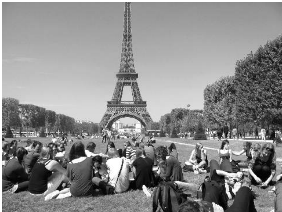
Odpočinek pod Eiffelovou věží byl pro všechny studenty mimořádným zážitkem.