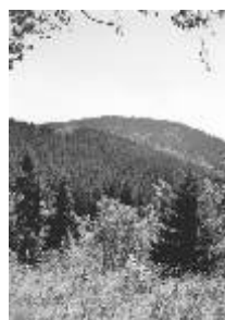
Z Plešivecké vyhlídky

Tato nedávno zřízená naučná stezka má okružní charakter v délce asi devět kilometrů mezi Abertamy, vrcholem Plešivce, Pstružím a Abertamy.