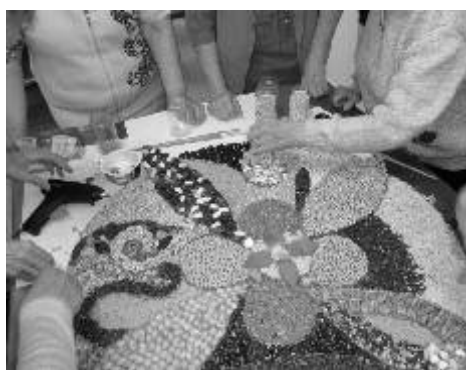
Vytváření mandaly v TyfloCentru