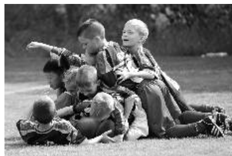
Radost ze hry je nelíčená.