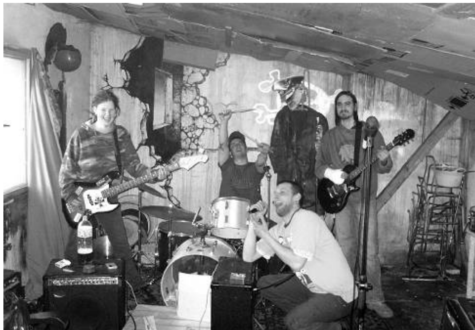
Tohle jsme my - Plesnivý fazole.