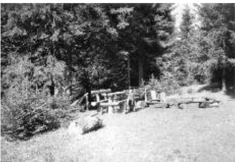
U Šlikovy školy

Redakce děkuje stálým i příležitostným příspěvatelům, díky jejichž příspěvkům můžeme pro čtenáře zajistit pestrost našeho měsíčníku.