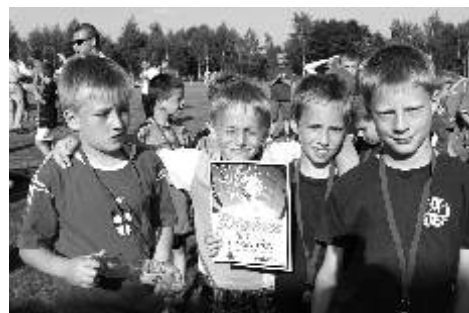
Ocenění vždy potěší.