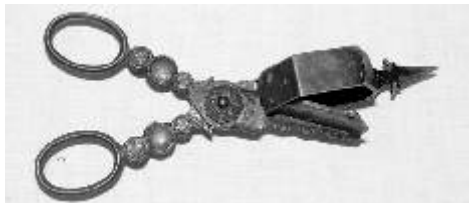
Předmět z výstavy Hádej, hádej, hadači