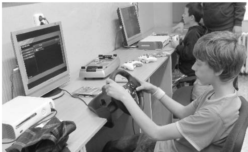
Herny nabízejí dětem zábavu i o prázdninách.