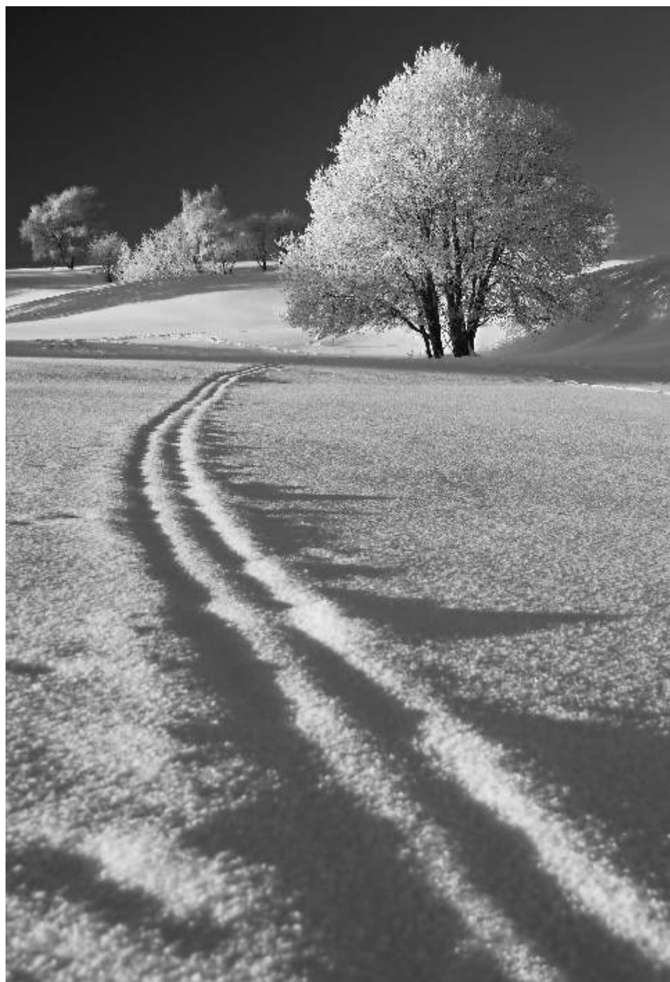
Fotografie měsíce Fotoklubu Ostrov. Název: Zima. Autorka: Lenka Křížová