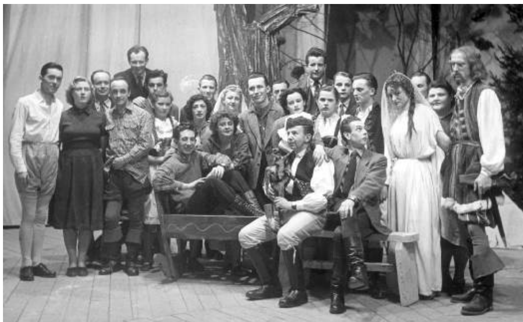
Ochotníci v Ostrově nadšeně hráli už více než před půl stoletím.