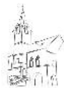
STARÁ RADNICE OSTROV

Společenský večer pro milovníky starších známých melodii. K tanci a poslechu hraje Taneční orchestr DK Ostrov.