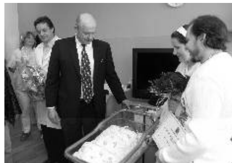
První miminko Karlovarského kraje přivítal i hejtmán Josef Novotný.

Nemocnice Ostrov úspěšně prošla akreditačním šetřením Spojené akreditační komise (SAK). Tím je úspěšně zakončen projekt, který se v rámci nemocnice připravoval a realizoval v průběhu celého loňského roku. Získání certifikátu o udělení akreditace by mělo být pro klienty i jejich blízké jasným signálem, že nemocnice poskytuje kvalitní a bezpečnou péči, neboť se snaží neustále zlepšovat standardy a úroveň poskytovaných služeb a snižovat rizika jak pro klienty, tak i pro zaměstnance. V rámci České republiky tímto procesem úspěšně prošlo pouze 30 nemocnic.