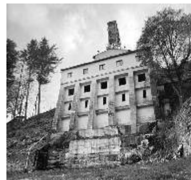
Důl Svornost v Jáchymově

Výstava Tváře uranu bude zahájena v pátek 9. dubna v 17.30 hod. v kostele Zvěstování Panny Marie v Ostrově.