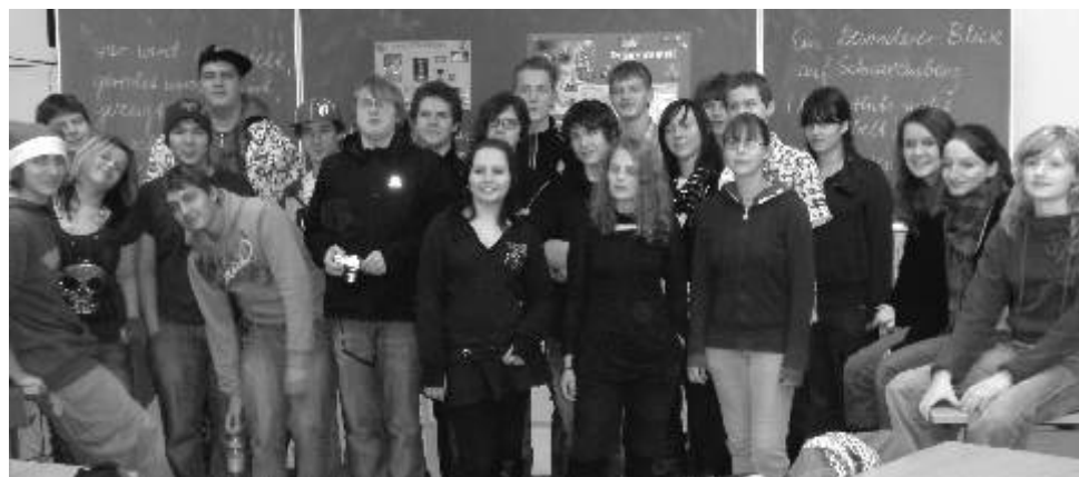
Účastníci projektu ve Schwarzenbergu