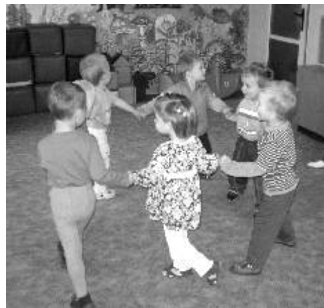
Miniškolička v MC