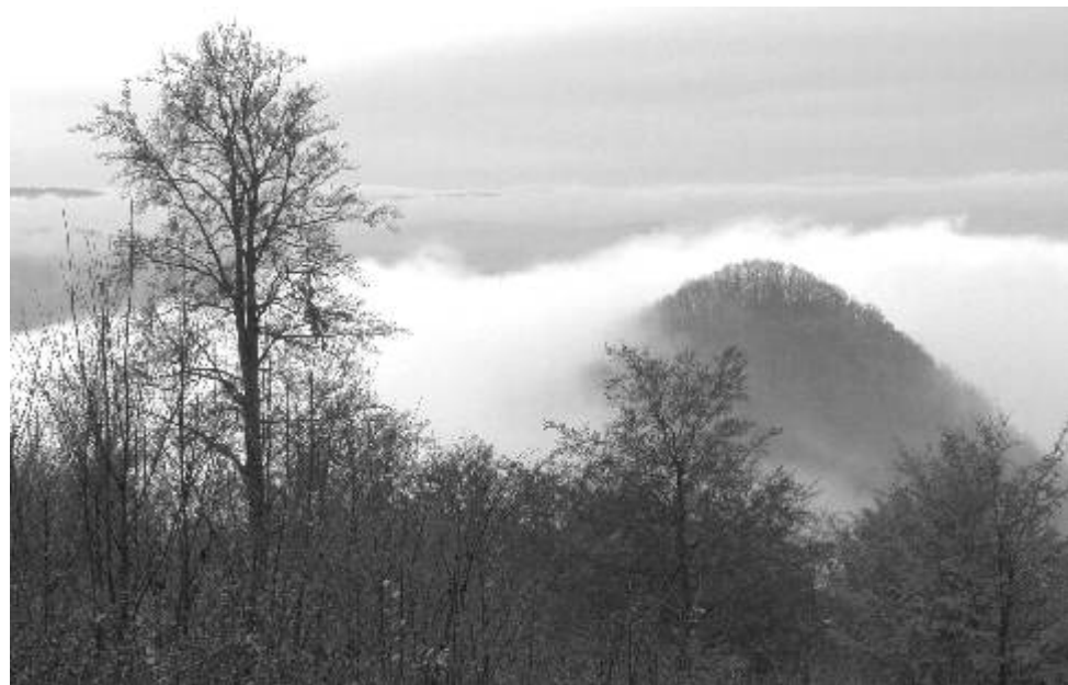
Fotografie měsíce Fotoklubu Ostrov. Název: Nebeská skála. Technická data: Sony R1, clona 14, čas 1/160, ohnisková vzdálenost (přepočteno na kinofilm) 96 mm, ISO 400.

O fauně a flóře horských rašelinišť přednáší Vladimír Melichar.