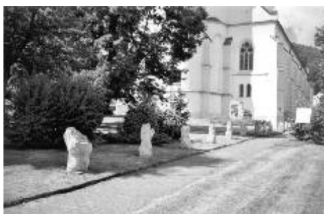
Část křížové cesty před kostelem sv. Jáchyma