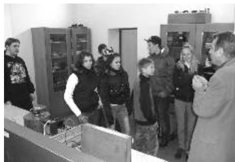
Zájemci navštívili i elektrotechnické dílny.

V zámecké budově se počátkem prosince uskutečnil již tradiční Den otevřených dveří, v němž škola otevřela své prostory zájemcům o studium z řad žáků 9. ročníků i široké veřejnosti. Díky organizovaným svozům, které SPŠ zajistila pro žáky z Perninku, Nejd-