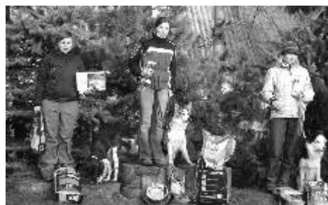
Vítězové Zimního závodu v Jirkově