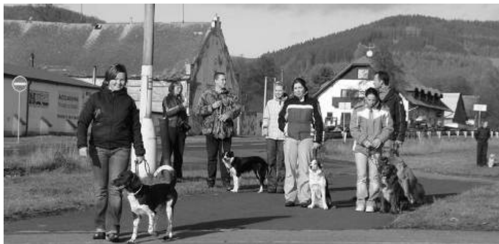
Přezkoušení chování psa v pouličním ruchu je nezbytné pro splnění zkoušky.