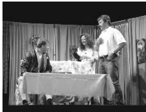
1 + 1 = 3