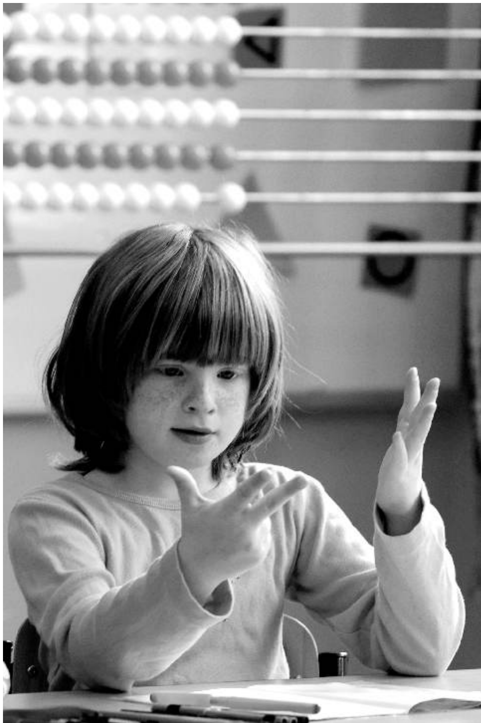
Fotografie měsíce Fotoklubu Ostrov, autorka Jitka Rjašková

Spolufinancováno Evropskou unií z Evropského fondu pro regionální rozvoj a Investice do vaší budoucnosti.