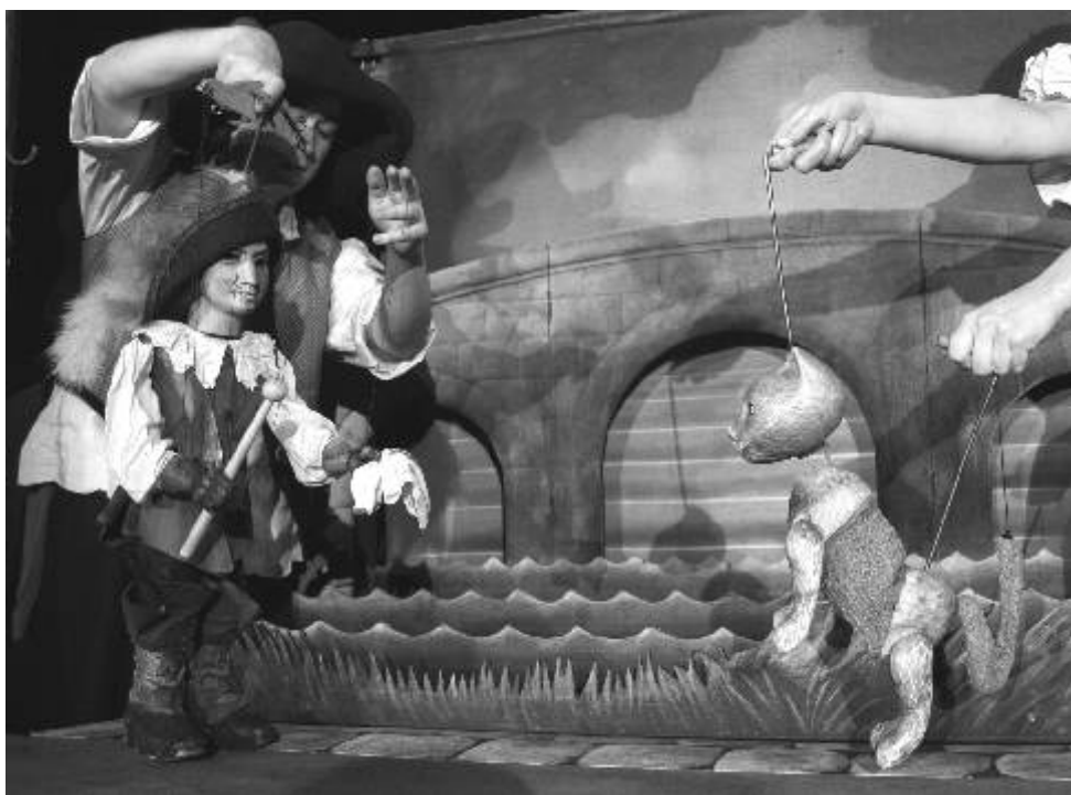
Obliba dětských představení na Staré radnici stále stoupá.

za rošťárny. V březnu nám ostrovští ohotníci připomenou v repríze pohádku Čertovský mariáš a v dubnu se děti mohou těšit na proslulou francouzskou pohádku Kocour v botách aneb Anča, bubnuj! z repertoáru Divadla Elf z Prahy. Představení je kombinací klasické činohry a tradičního jarmarečního loutkového divadla. Vypráví o tom, jak ten kocour zloducha popadne, a jak to nakonec zas dobře dopadne... Markéta Jenišťová, DK Ostrov