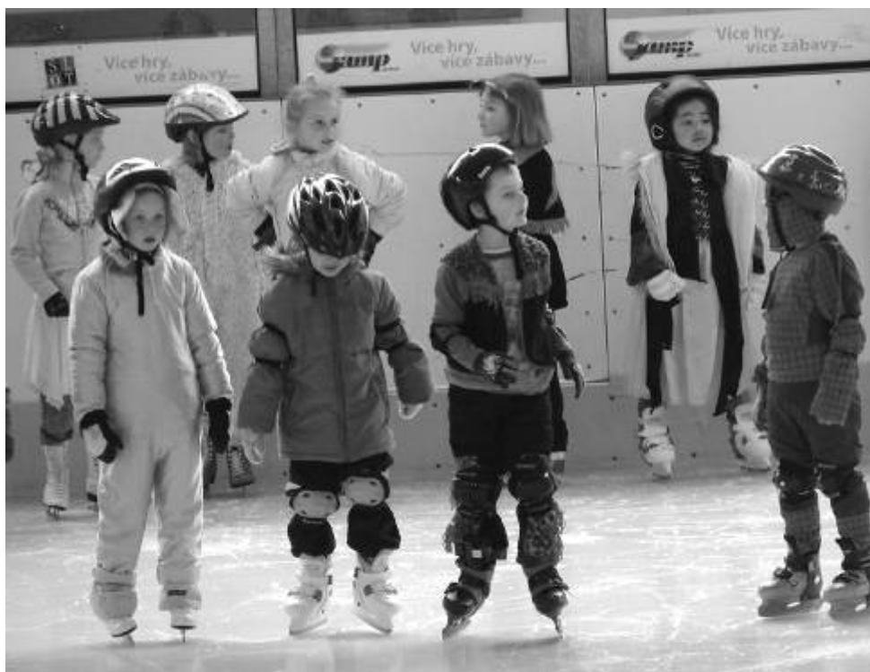
Finanční dar pomůže mateřským školám zapojeným do výuky bruslení.