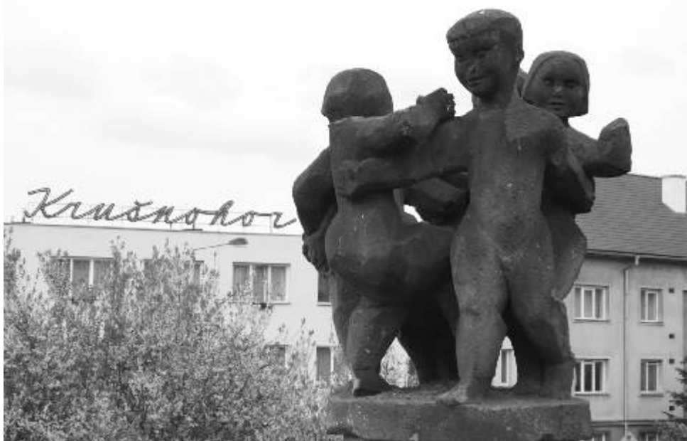
Sousoší Tančící děti z roku 1961