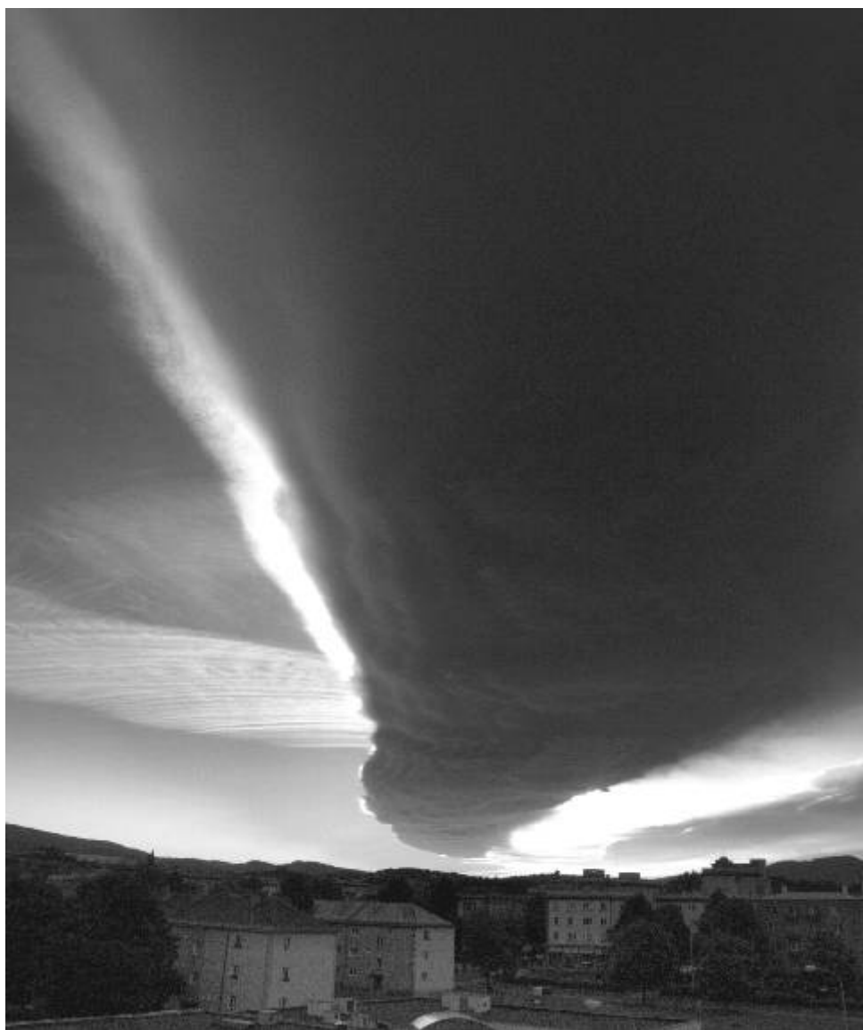
Mrak - fotografie měsíce Fotoklubu Ostrov