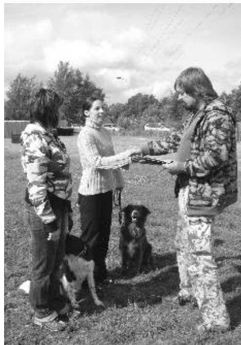
Lidský přístup rozhodčího snížil nervozitu všech zúčastněných.