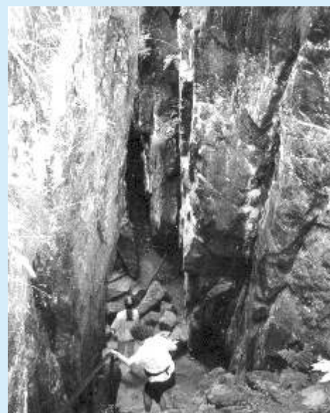
Propadlina dolu Wolfgang