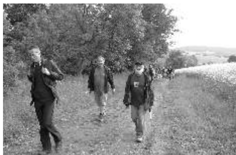
Do Prčice ze Sedlčan

Původním povoláním jsem geolog se specializací pro zakládání staveb. Takže jsem kromě vlastní geologie působil i ve stavebnictví, kde jsem pak i celou řadu let podnikal. V posledních několika málo letech jsem působil jako technický úředník u firmy silničního stavitelství. Od 1. července letošního roku si mohu za své jméno psát v.v. (ve výslužbě). Mé záliby vychází z toho, že jsem od přírody pohodlný. Jsem knihomol, který odebírá spoustu novin, časopisů, knih a musí přečíst vše, co mu přijde pod ruku. Mnoho let se starám o dva pudly, kteří mě donutí jít je třikrát denně vyvenčit. Trochu času mi zabere i příprava na zasedání Rady města, Zastupitelstva města a dvou komisí při Městské radě. Nemálo času pak spolyká příprava turi-