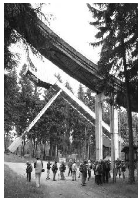
Pod věží velkého skokanského můstku