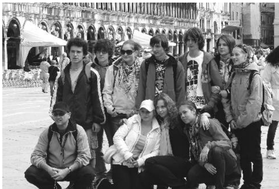
Studenti Gymnázia Ostrov v Benátkách