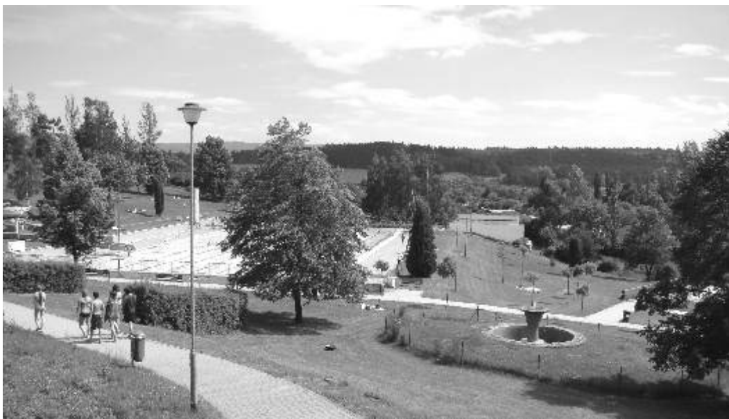
Ostrovské koupaliště je na léto připraveno.

Redakční uzávěrka příspěvků do příštího čísla je 10. července!