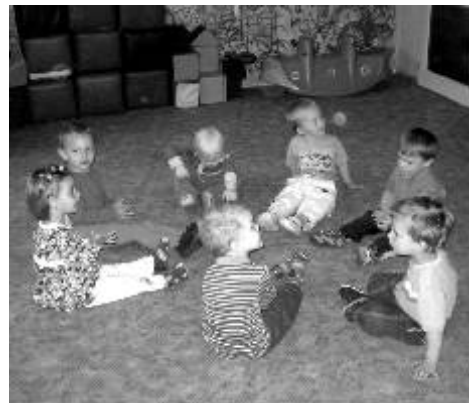
Miniskolička v MC Ostrůvek