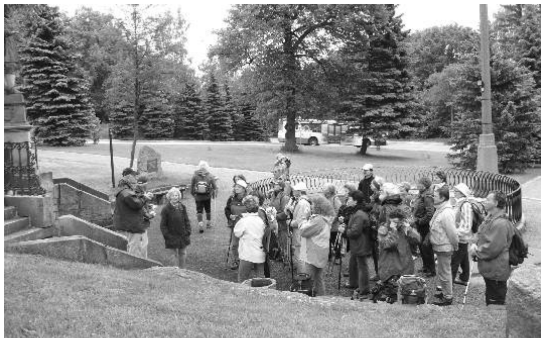
Zastávka v Johanngeorgenstadtu u sochy Johanna Georga I.