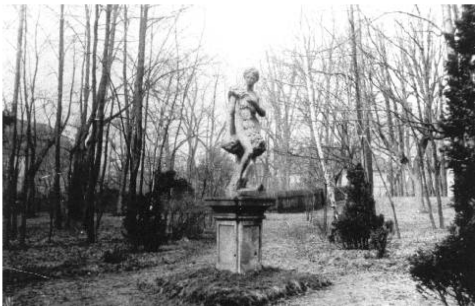
Socha Flora - snímek před rokem 1918