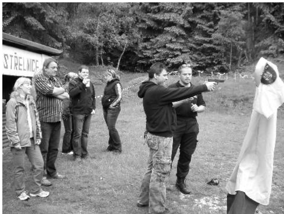
Střelecké závody na střelnici v Jáchymově pro úředníky MÚ Ostrov