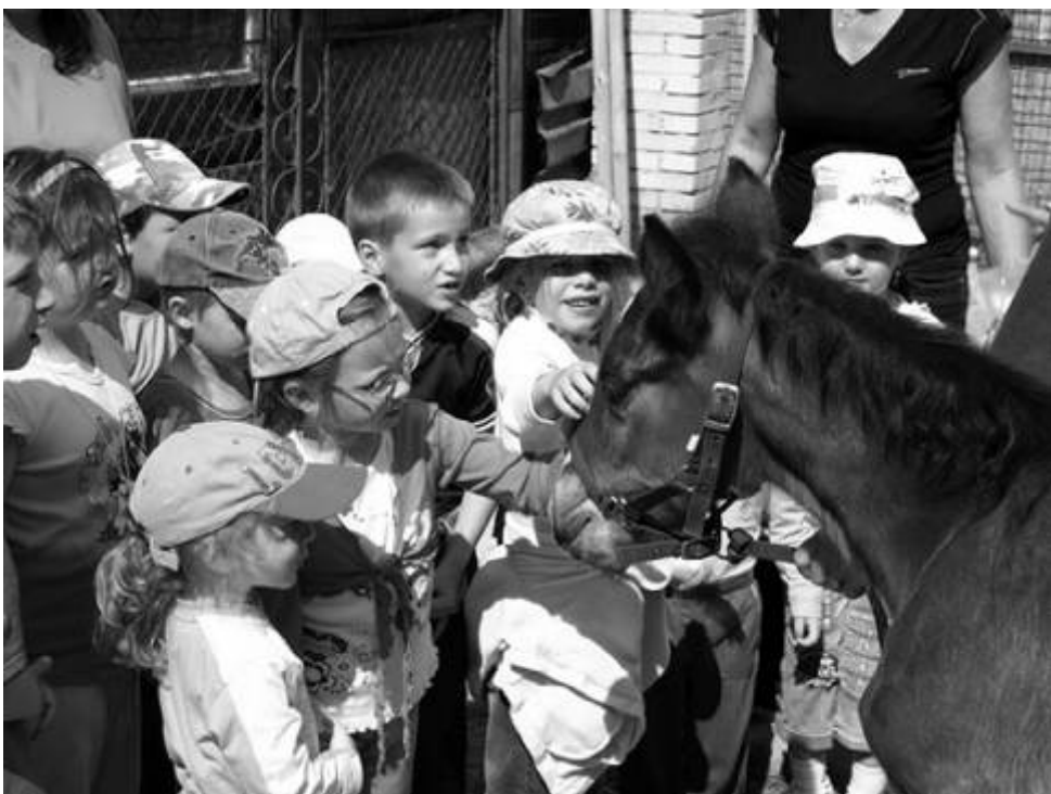
Děti v Macíku prožily nezapomenutelné chvíle.

Žádáme přispěvatele, aby své texty vždy podepisovali celým jménem. Redakce