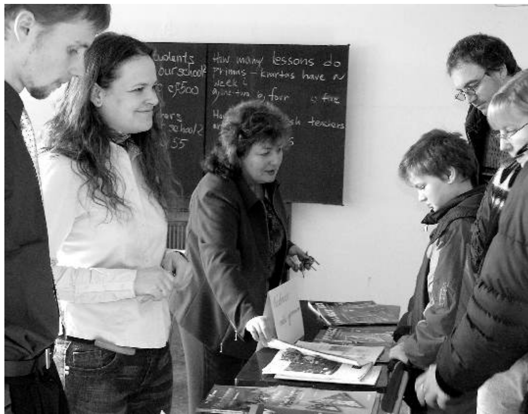
Na Dni otevřených dveří vycházeli návštěvníkům vstříc studenti i pedagogové.