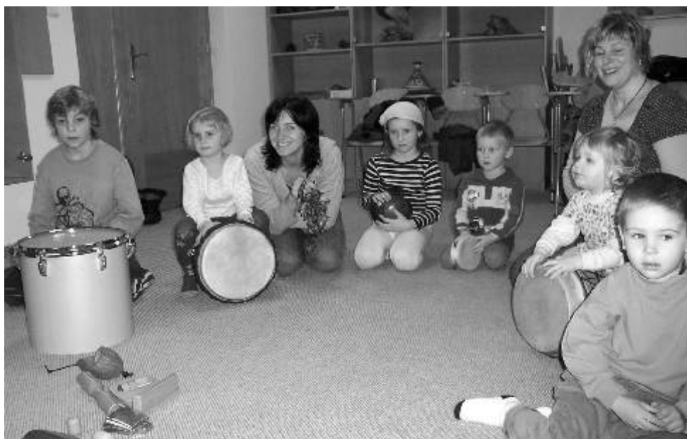
Děti se při muzikoterapii spontánně baví.