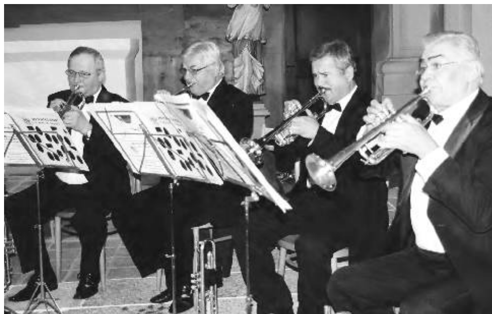
Soubor pražských trubačů na adventním koncertě v Ostrově