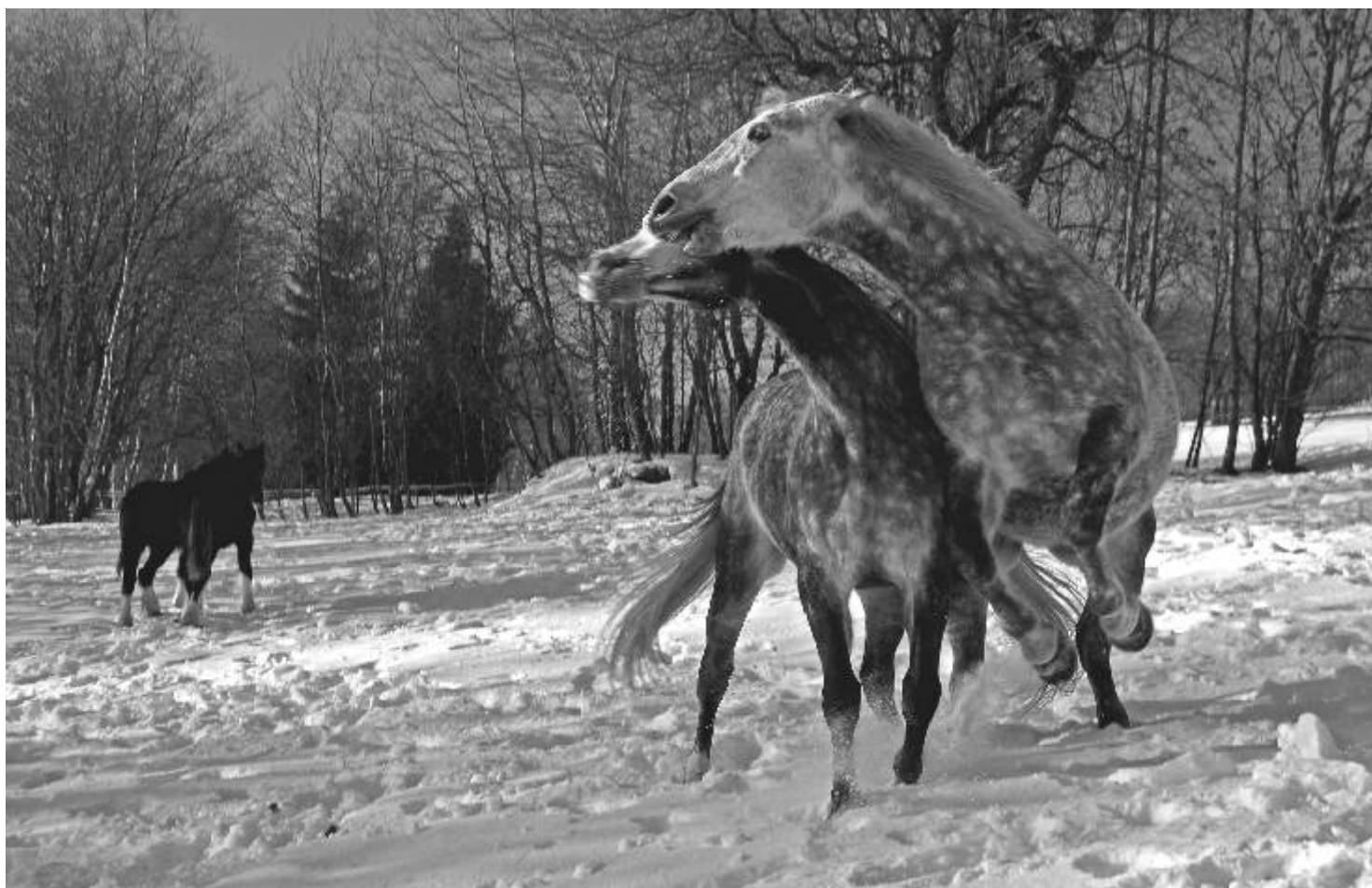
Zimní radovánky - fotografie měsíce Fotoklubu Ostrov.