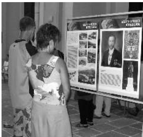
Výstava Mattoniho kyselka láká velký počet návštěvníků.

Tento projekt se uskuteční za finanční podpory Ministerstva kultury ČR.