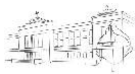
DŮM KULTURY OSTROV

Co ze své nejnovější tvorby představí malířka na Staré radnici v září, o tom se mohou přesvědčit všichni, kdo navštíví její výstavu nazvanou Doma. jan