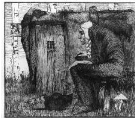
Heinrich Vogeler: Čarodějnice se sovou (1895), lept

Heinrich Vogeler se v první etapě své tvorby zaměřil především na grafiku, a to převážně v technice leptu. V letech 1894-1922 vznikla tak řada devětapadesáti poetických, často pohádkově motivovaných kompozic, do nichž autor vkládal svůj sen o harmonickém soužití člověka s přírodou v trvalém ovzduší lásky a přátelství. Spojoval v nich konkrétní prvky worpsswedské krajiny, hlavně v předjarním a jarním období, i podobu