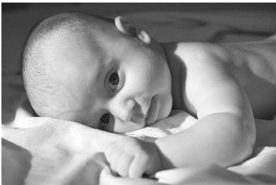
Fotoklub Ostrov. Název fotografie měsíce: Snesitelná lehkost bytí, ohnisková vzdálenost 30 mm, clona 3.5, čas 1/1000s, ISO 100, poměrové měření expozice, kompenzace expozice -2/3. Autor David Papánek