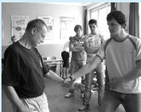
Oborové dny na Gymnáziu Ostrov nabídl mimo jiné kurz Aikido.