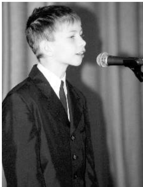
Na snímku z minulosti je Zbyněk Drda na soutěži Ostrovská veverka.

Jedním z dětí, které na Ostrovské veverce začínaly, je Zbyněk Drda. Později zvítězil ve třetím ročníku české televizní soutěže Superstar a natočil své první album Pohled do očí, které se stalo nejprodávanějším debutovým albem roku (Deska roku 2007). V této souvislosti obdržel i cenu Skokan roku na soutěži Český Slavík 2007 a v anketě TýTý Objev roku 2007. Je také vítězným zpěvákem ankety Jetix Kids Awards 2007. Dle sdělení mediální zástupkyně Johany Křížové připravuje nyní Zbyněk Drda své druhé album, které by mělo vyjít na podzim. jan