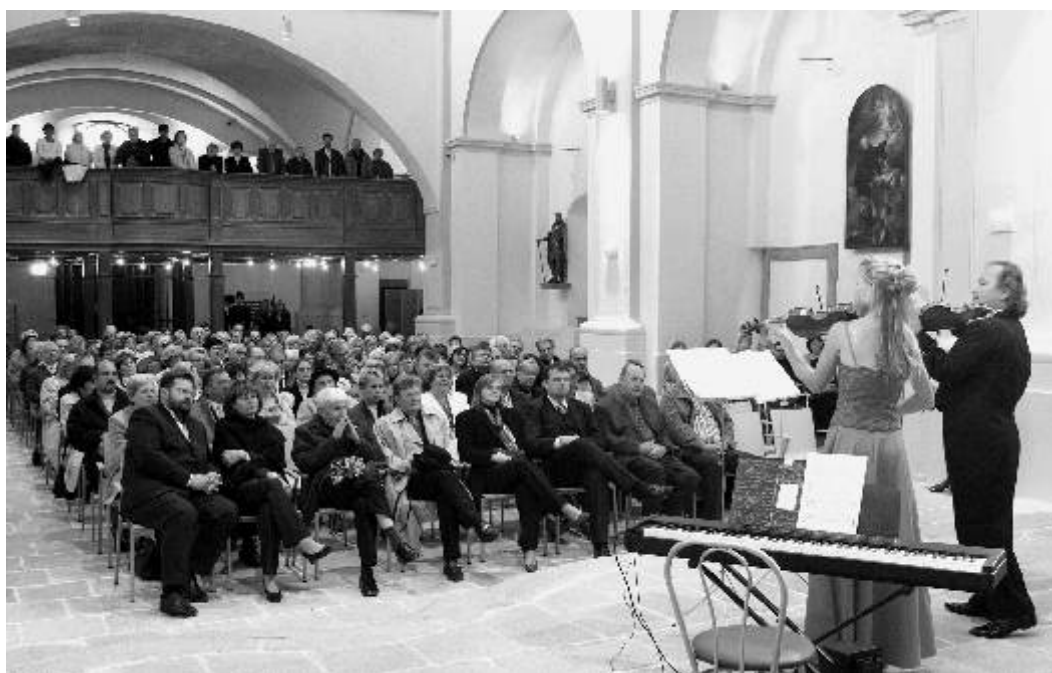
Klášterní areál získal díky rekonstrukci v rámci projektu Historický Ostrov reprezentativní prostory nejen k prohlídkám, ale také pro nejrůznější kulturní akce. Na snímku je záběr z vystoupení houslového virtuosa Václava Hudečka v klášterním kostele.

Redakční uzávěrka příspěvků do příštího čísla je 10. dubna!