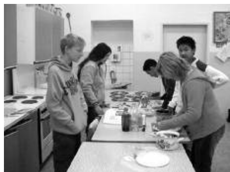
Děti z Klínovecké vaří při hodině Pracovních činností.