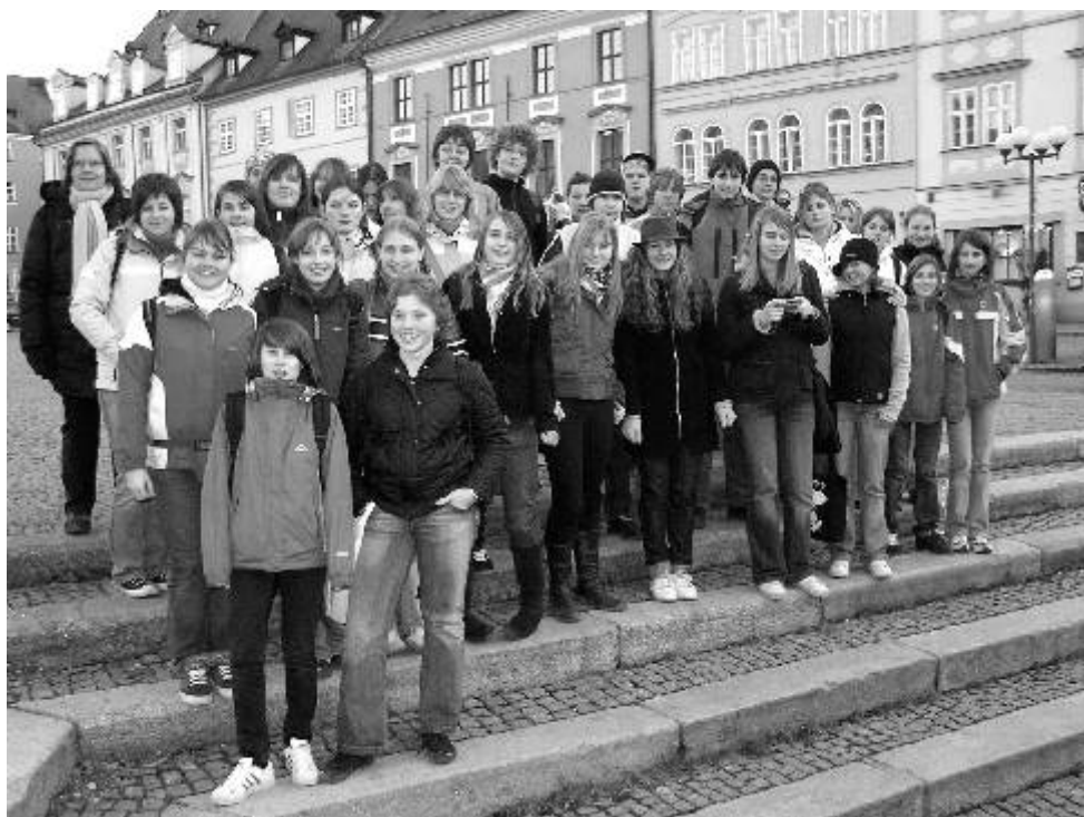
Účastníci ekosemináře v Německu