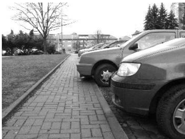
Ohleduplně a neohleduplně parkující vozidla