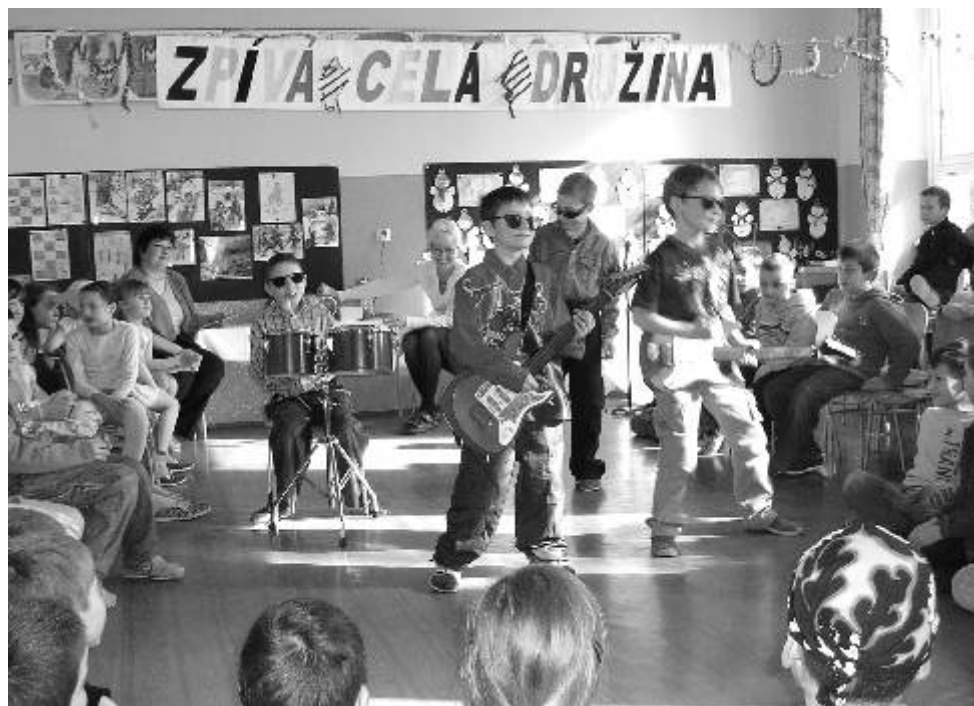
Ze soutěže Zpívá celá družina