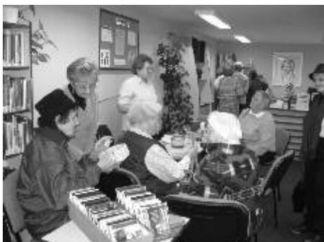
V hudebním oddělení knihovny se ženy zajímaly o zdobení velikonočních kraslic.