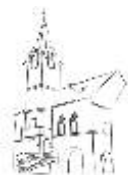
STARÁ RADNICE OSTROV

K tanci a poslechu hraje Taneční orchestr DK Ostrov. Vstup volný