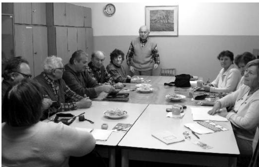
Na výborové schůzi v pondělí 7. ledna se mimo jiné projednávaly další akce sdružení.

Redakční uzávěrka příspěvků do příštího čísla je 8. února!