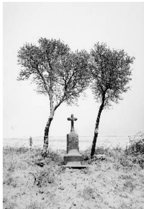
Fotografie měšice Fotoklubu Ostrov: Boží muka - Jitka Rjašková 1/250s, f8, ISO 100

Prvním krokem v tomto směru je zprovoznění oddělení lůžek chronické intenzivní péče, které je jediným pracovištěm podobného typu v Karlovarském kraji. Oddělení odpovídá svým technickým a přístrojovým vybavením nejmodernějším evropským trendům. Mezi další rozvojové projekty připravované k realizaci v roce 2008 patří například projekt vytvoření a instalace Nemocničního informačního systému, který by měl pomoci nejen zdravotnickým pracovníkům nemocnice, ale i klientům. Nadále je počítáno s dalším postupným zvyšováním komfortu „hotelových“ služeb, připravena je další etapa rekonstrukce ambulantní rehabilitace a vodoléčby, v jednání je záměr směřující ke zkvalitnění způsobu přípravy stravy a její distribuce. Záměrem společnosti je, stejně jako v minulých letech, také podpora regionálních kulturních, společenských a sportovních akcí zejména formou zajištění zdravotního dozoru na jednotlivých akcích, případně i podpora v dalších možných formách. PR