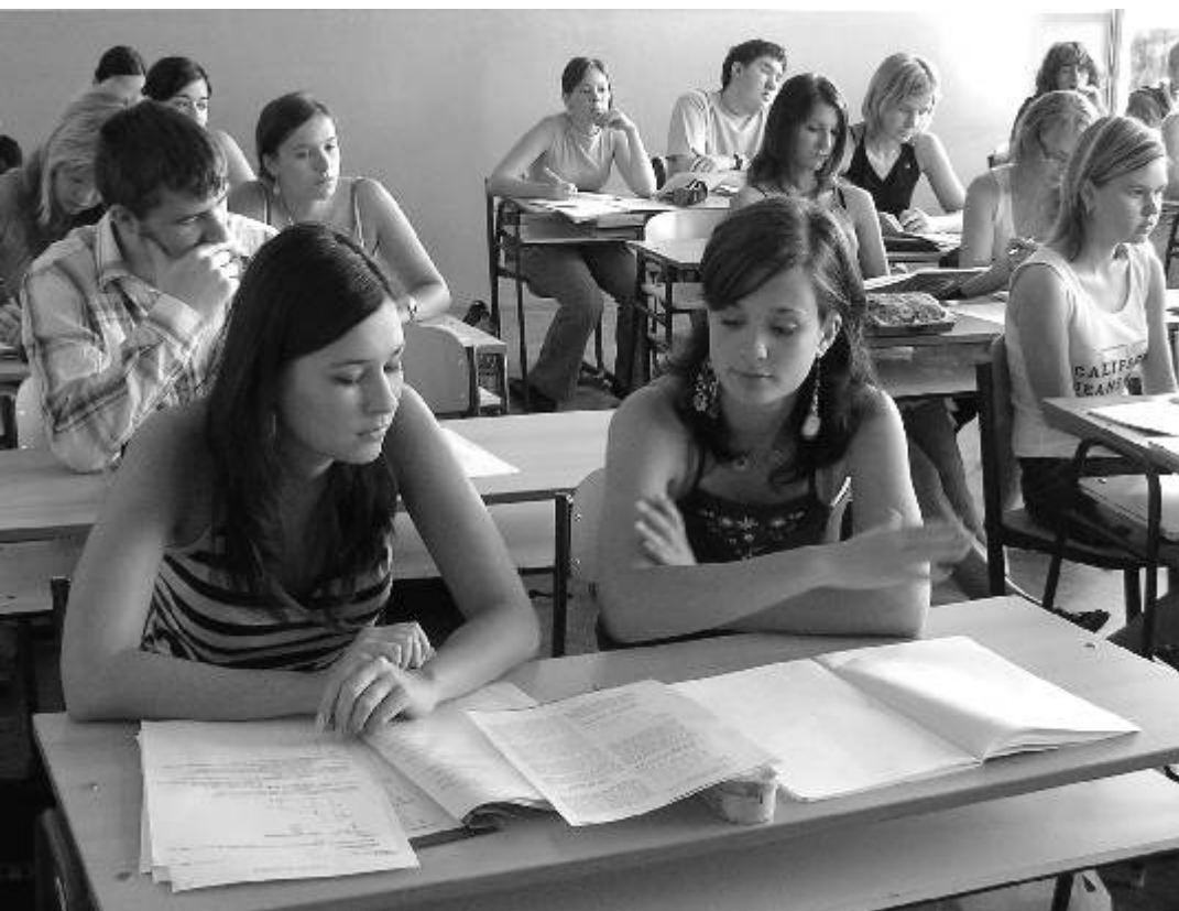
Studenti Gymnázia Ostrov v učebně Základů společenských věd.