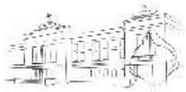
DŮM KULTURY OSTROV

20. února 19.30 hod., divadelní sál DK Ostrov