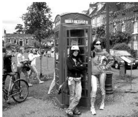
Žákyním ze ZŠ Májová Ostrov se v Anglii líbilo.