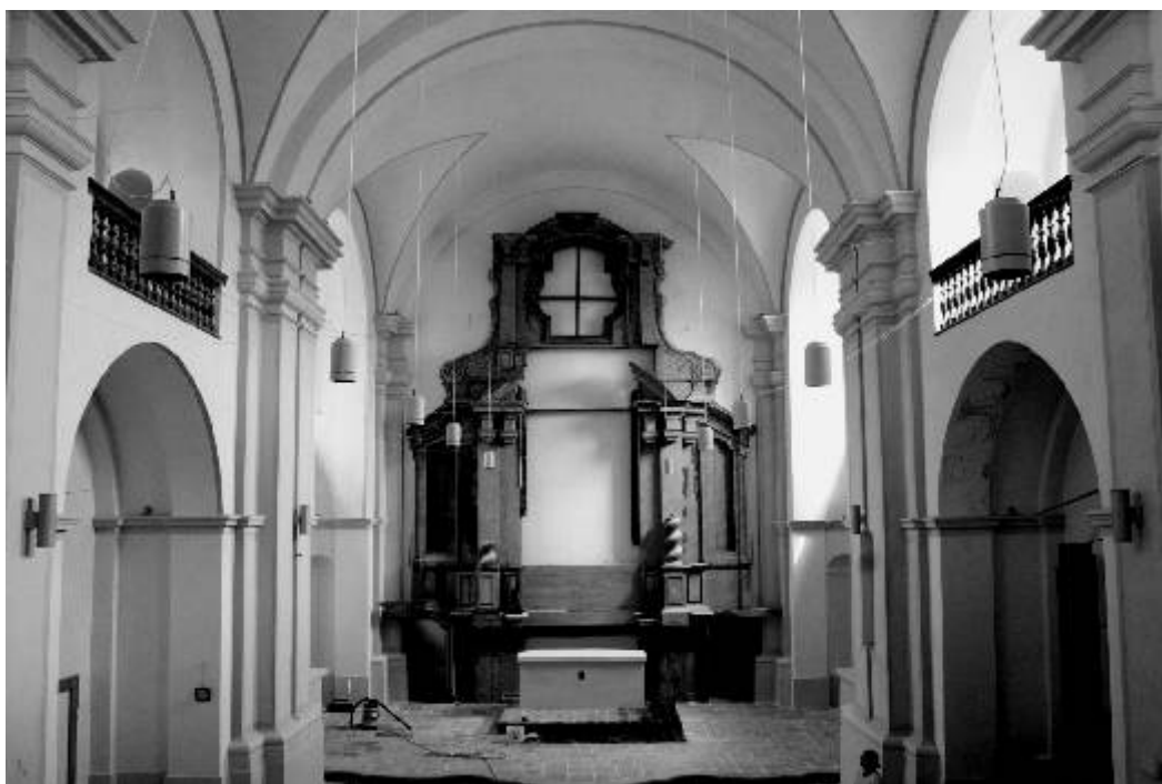
Interiér klášterního kostela před dokončením rekonstrukce

Redakční uzávěrka příspěvků do příštího čísla je 10. července