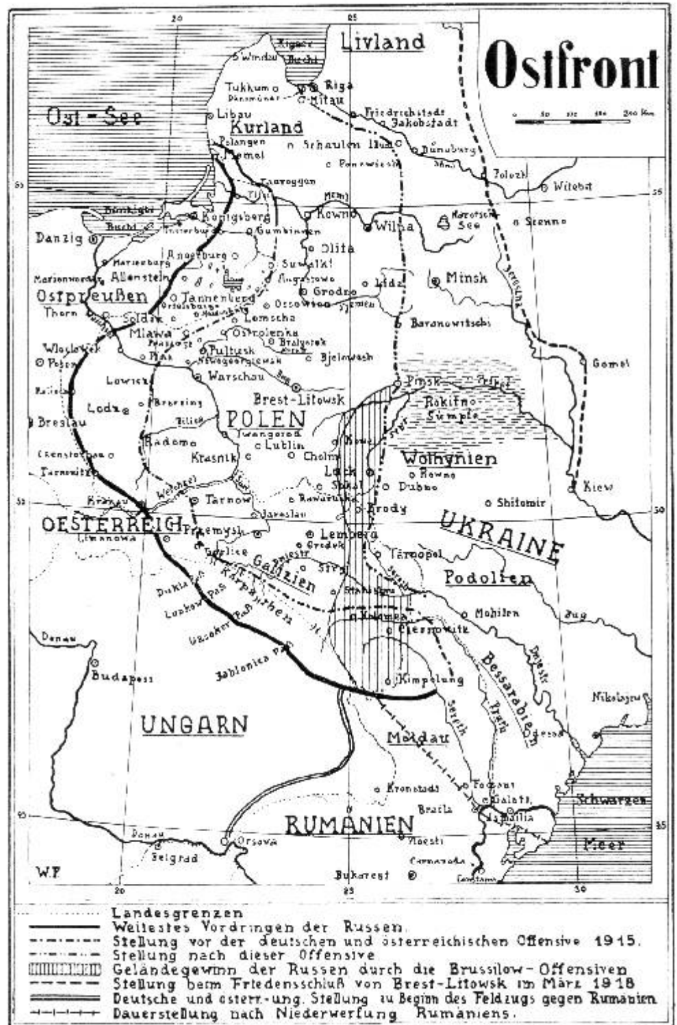
Ofenzíva ruského generála Brusilova

V památníku I. pluku Jana Husi v čs. legiích na Rusi je vlastnoruční zápis T. G. Masaryka ze srpna 1917: