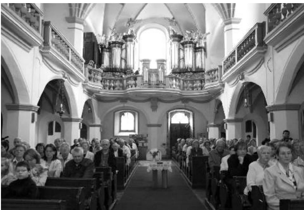
Zvuk varhan v prostorách kostela vytváří jedinečnou atmosféru.