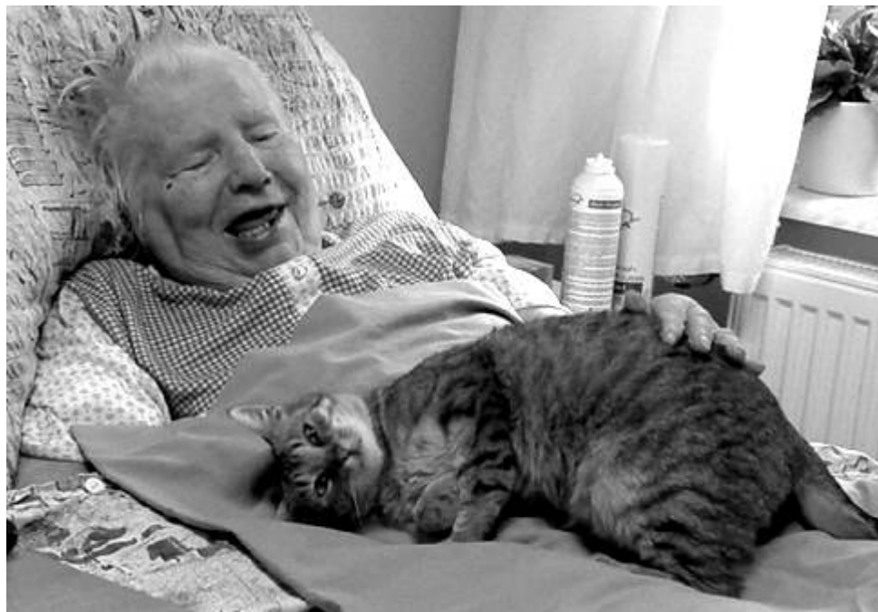
Starší a nemocným občanům pomáhá kontakt se zvířaty a jak se prokázalo, příznivé působení je vzájemné.

Autoři navrhli rozšíření stávajícího území lesoparku a rozčlenili je na hlavní kompoziční, provozní a programově přidružené celky. Pro rekreační využívání je navržena cyklostezka, koňská stezka, stezka opičí dráhy, naučná rybářská stezka, naučná regionální stezka, areál pro sportovní činnost, kde je navrženo umístění sportovní haly, softbalového hřiště, cyklotriálu atd. Na jednání komise loni v prosinci bylo konstatováno, že rozsah území lesoparku zůstane zachován v souladu s územním rozhodnutím vydaným v roce 1997 a nebude se rozšiřovat tak, jak navrhuje studie z roku 2003. Rozšíření území by přineslo komplikace především ve smyslu nutnosti změny územního plánu a řešení vlastnických vztahů. Bude tedy přistoupeno ke zpracování projektových dokumentací ke stavebnímu řízení, které budou řešit jednotlivé stavební objekty (úprava jednotlivých rybníků) s tím, že každý bude moci být realizován samostatně. (rep)