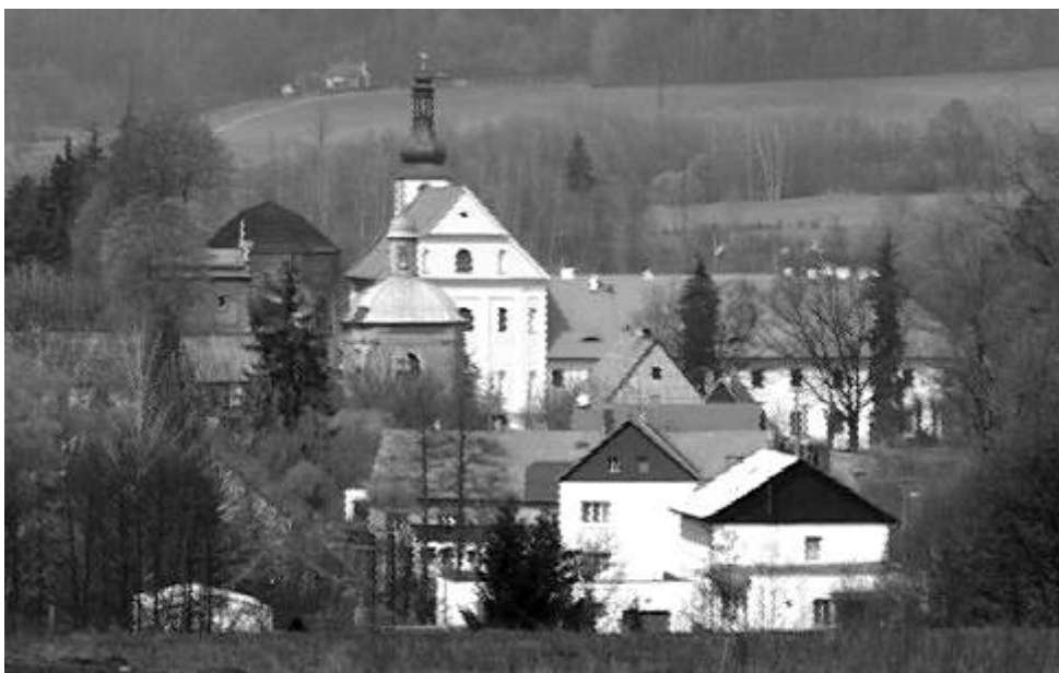
Pohled na historické jádro Ostrova. Snímek vznikl jako podklad pro logo k projektu Historický Ostrov.

Na prvním místě byl Tachov. Ostrov byl v žebříčku obcí vyhodnocen jako pátý nejlepší. Více na: http://aktualne.centrum.cz (red)