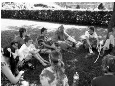
Popiska: Členové souboru Na poslední chvíli ze ZUŠ se radí před vystoupením v Zámeckém parku.