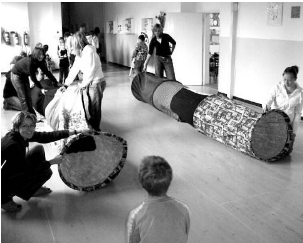
Děti v ZŠ Klínovecká při jedné ze soutěží letošního Dne dětí.