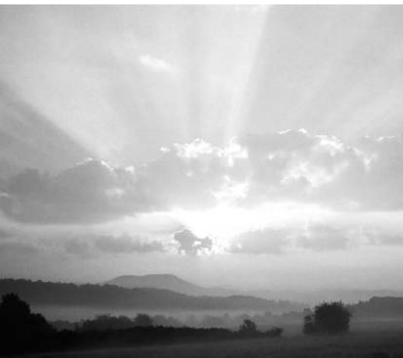
Zatím ještě nedotčená louka poblíž ostrovské nemocnice a Křížku.