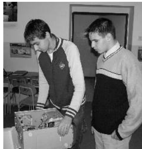
Kompletní seznámení s počítači je při výuce na SPŠ už dávno samozřejmostí.

Se vstupem do Evropské unie se České republice umožnila snadnější cesta k penězům určeným na projekty, zaměřené na další vzdělávání dospělých. Jeden takový zaujal pracovníky SPŠ Ostrov natolik, že bez předchozích zkušeností i bez toho, aby si dokázali představit, co je na této cestě čeká, vstoupili před dvěma lety rovnými nohama do kolotoče žádostí, projektů a termínů. Aby se takový projekt mohl