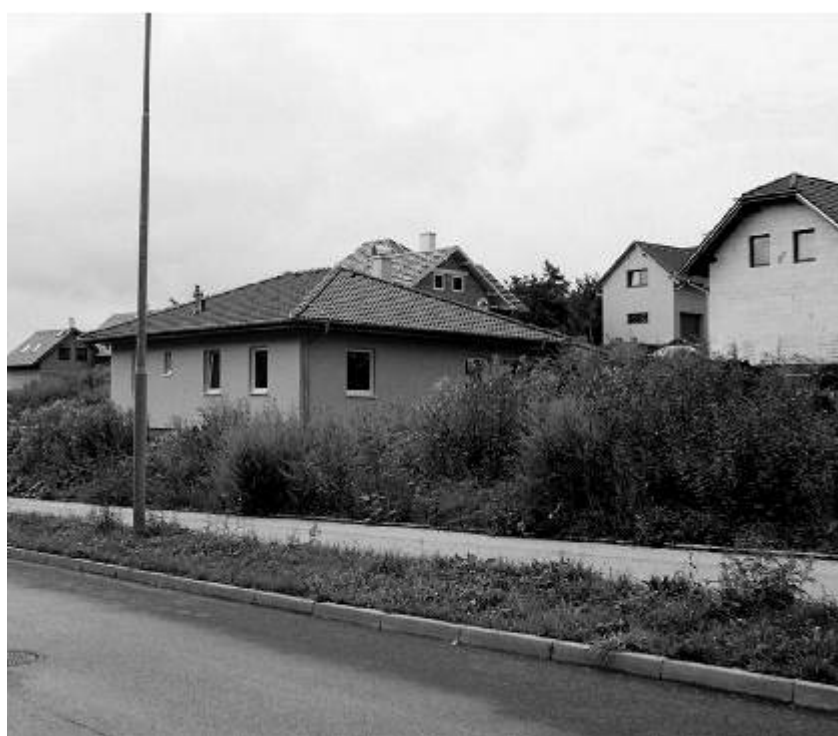
Rodinné domy mezi nemocnicí a koupalištěm.