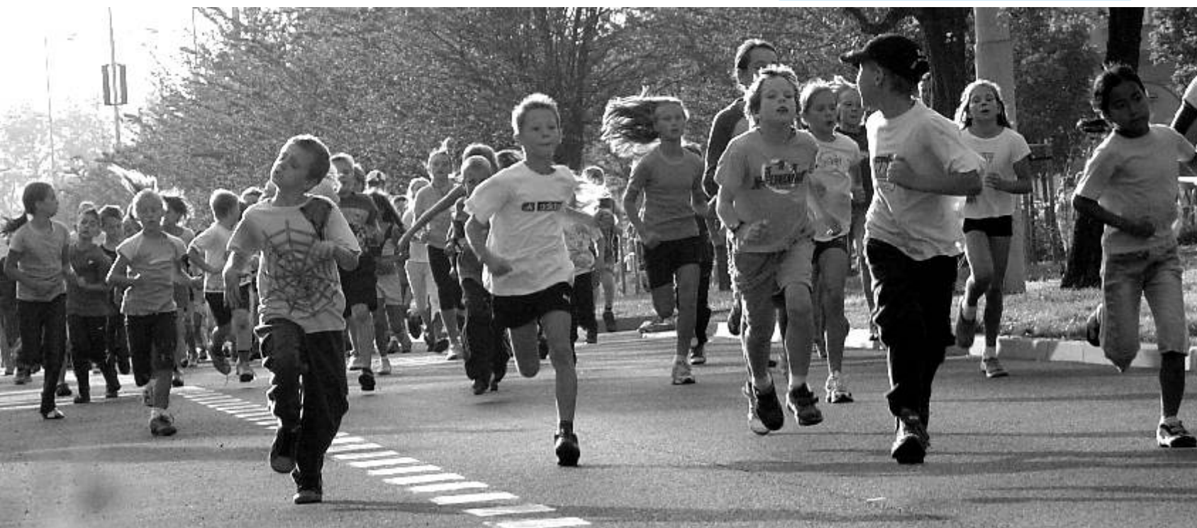
Na Ostrovské míli se i letos 12. září sešlo mnoho nadšených dětí.

Bližší informace o nás na: www.hasiciostrov.wz.cz .