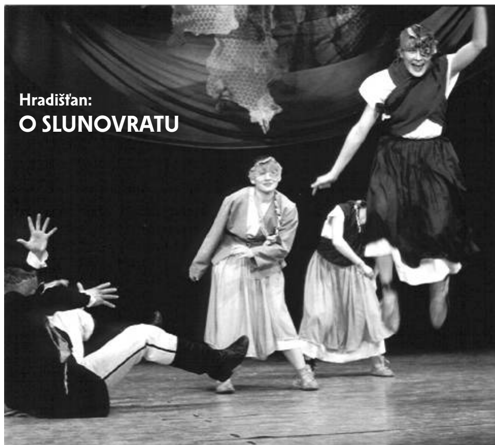
Hradišťan: O SLUNOV RATU

Setkání neprofesionálních výtvarníků z pohraničí, kteří budou společně tvořit. Téma roku 2006 jsou: Krajina, Architektura církevní a lidová a Hledání osobitého stylu účastníků. Program bude zaměřen na frotáž, koláž, kombinace, akční malování, teorie perspektivy a další. Rozmanitá bude i technika kresby, například stínování, lavírování, rozmývání, kombinace, grafické tužky atd. Námět na jednotlivé dny bude vždy připraven, vysvětlen a zpracován podle zkušeností, představ a emocí každého účastníka. Bude-li mít účastník připravené vlastní téma, bude respektován a citlivě veden. Následovat bude výstava v prostorách Staré radnice. Přihlášky na setkání si můžete vyzvednout v IC v DK Ostrov Tento projekt byl spolufinancován z prostředků EU v rámci iniciativy Společenství INTERREG IIIA. Dieses Projekt wurde von den EU Mittel im Rahmen der Initiative der Gemeinschaft Interreg IIIA co-finanziert.