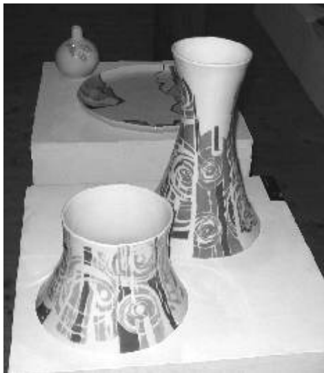
Všechny výrobky mladých keramiček se prodaly hned při vernisáži.