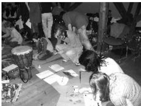
Návštěvníci Dne Tibetu si zkoušejí variace v modré barvě.

Zajímavým bodem programu na tradičním Dni Tibetu na ostrovské Staré radnici byl letos seminář o barvách a jejich působení na člověka. Po odborném uvedení do tématiky, ve kterém lektorka mimo jiné připomněla i Wolfganga Goetha a jeho nauku o barvách, si účastníci semináře mohli osobně vyzkoušet působení jednotlivých barev na sobě. Namalování libovolného motivu v určité barvě doprovázela i hudební improvizace na stejné téma. Kurz vedla karlovarská psycholožka Veronika Pavlů. (Jan)