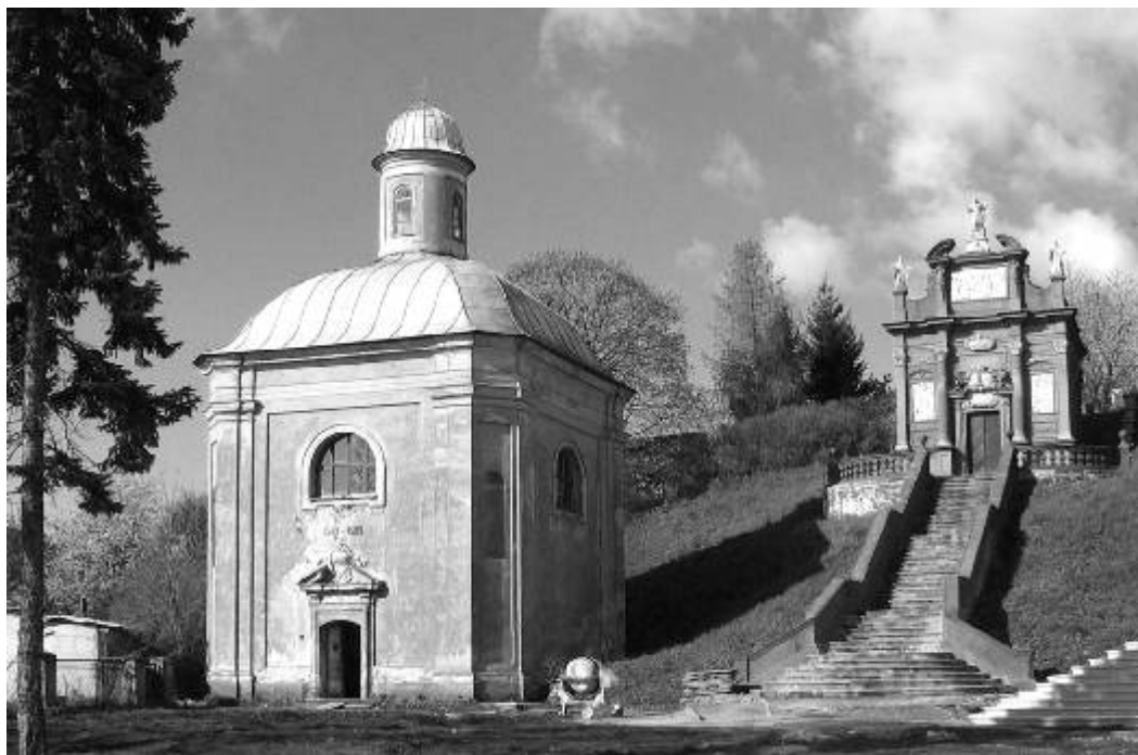
Foto: Kaple sv. Floriána v Ostrově