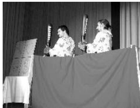
Představení Koláž sledovanosti získalo hlavní cenu přehlídky.