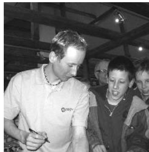
Lukáš Bauer při autogramiádě