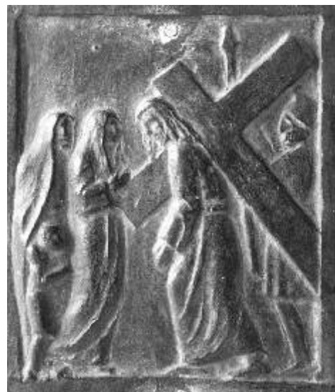
Jeden z reliéfů Křížové cesty