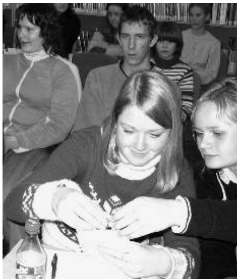
Novopečené novinářky si prohlížejí znak města Ostrova, který dostaly společně s propagačními materiály.

„Já sám bych si přál, aby novináři byli vždycky objektivní a přinášeli čerstvé a zajímavé informace,“ řekl mimo jiné dětem Jan Bureš. Soutěžící dostali také bloky a tužky, propagační materiály a odznak se znakem Města Ostrova. Hlavní cenou v soutěži pro jednotlivce je digitální fotoaparát nebo mobilní telefon, podle vlastního výběru vítěze, hlavní cenou pro vítězné družstvo je výlet do plzeňské ZOO, a to pro celou třídu. Soutěž trvá do 15. června. (Jan)