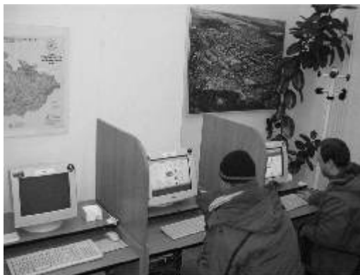
Veřejný internet je stále populární

Vizi rozsáhlého síťového propojení počítačů měl v roce 1962 americký vědec Licklider. Zamýšlel sestavit jakousi umělou inteligenci, která by nahradila lidský mozek, s možností propojení jednotlivých účastníků. Nezávisle na něm přišel pak Paul Baran s řešením počítačového propojení bez centrálního uzlu. Od „Centrálního mozku lidstva,“ známého z fantastického seriálu Návštěvníci, se tedy internetová síť liší především tím, že nemá žádné centrum, umožňuje tedy dorozumívání i tehdy, je-li část sítě vyřazena z provozu. V roce 1969 využila první vzniklou počítačovou síť, nazvanou Arpanet, vojenská obrana USA. Pro armádní účely je tento systém bezpečný, protože například v době války jej nelze vyřadit jednoduše zničením centrálního počítače, který zde neexistuje.