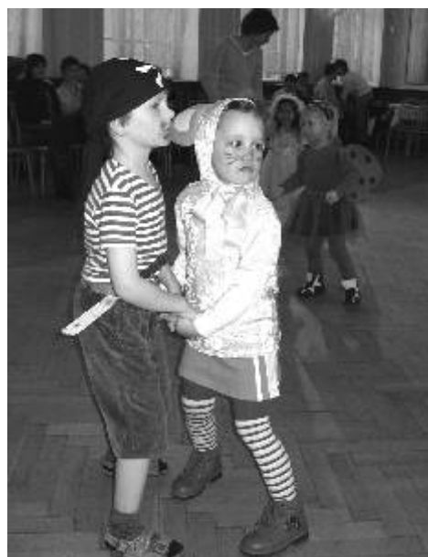
Na valentýnské maskární párty v Domu kultury se vydováděly i ty nejmenší děti.

Akce mimo Ostrov 18. a 19. března, Nové Strašecí Soubor Hop-Hop vystoupí jako host oblastního kola studentského divadla středočeského kraje s představením Večerní máj v režii Ireny Konývkové. 28. března, Stollberg (Německo) Soubor Hop-Hop odehraje představení Večerní máj v angličtině pro gymnázia ve Stollbergu