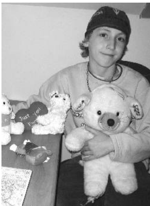
Na svátek sv. Valentina se těší hlavně nejmladší generace, nejčastějšími dětskými dárky bývají takzvaní plyšáci