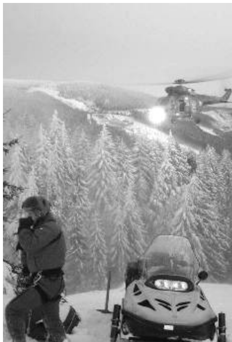
Záběr ze záchranné akce Horské služby ve spolupráci s leteckou záchrannou službou: vyprošťování člověka zasypaného sněhovou převějí v roklí

Leteckou záchrannou službu jsme zavolali, když jsme hledali dva pohřešované mladíky z Prahy, lyžaře a snowboardistu, kteří ve večerních hodinách zabloudili pod Klínovcem. V první fázi jsme k záchraně používali sněžné skútry, které postupně jeden za druhým zapadaly do hlubokého sněhu mezi spadlými stromy, poté jsme využili služeb letecké záchranky k propátrání terénu pomocí světlometů, bohužel marně. Podruhé jsme ji zavolali, když členové Horské služby na lyžích našli oba pohřešované ve volné krajině poblíž Krásného Lesa, šest kilometrů pod Klínovcem. Z tohoto terénu nebyl technicky možný převoz pomocí skútrů, muselo by se jít pěšky, což bylo na tuto vzdálenost téměř nemyslitelné, zvláště po osmi hodinách intenzivního pátrání, kdy byli všichni záchranáři vyčerpaní. Oba pohřešovaní byli ve velmi špatném psychickém a fyzickém stavu, byli silně podchlazeni, v šoku, měli omrzliny. Proto byli s pomocí letecké záchranné služby vyzvednuti jeden po druhém jeřábem na palubu vrtulníku a transportováni do nemocnice v Ostrově. O dalším postupu pak vždy rozhoduje posádka vrtulníku, hlavně její velitel. Z čistě technických důvodů, kdy se nedalo přistát u nemocnice kvůli zvrženému sněhu a nulové viditelnosti při přistávání, zvolil velitel posádky nouzové přistání