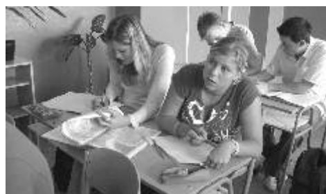
Na ostrovském gymnáziu