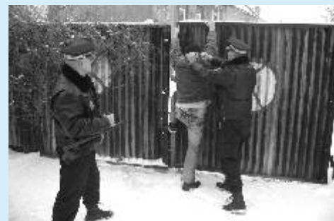
Zadržení pachatele Městskou policií Ostrov