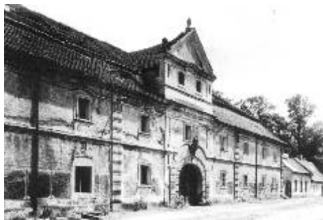
Dnes již zbouraný ostrovský pivovar

Město mělo i několik vlastních podniků: vodárnu a elektrárnu ve mlýně č.p. 111, právě v roce 1931 bylo také otevřeno městské koupaliště s budovou restaurace a šaten. V Letohrádku zas mělo premiéru Městské muzeum. Otevřen byl lom na těžbu čediče (u koupaliště). Největší továrnou ve městě byla slavná porcelánka majitelů Pfeiffera a Löwensteinové. Velkostatek řídila Správa státních lesů a statků. Populární pivovar Weber's Bierbrauerei Schlackenwerth spravoval majitel Weber, mlýn s pilou vlastnil pan Lihl a pilu majitel Langhammer. Továrna na využitkování dehtu, filiálka akciové společnosti Teerag v tehdejší Liticově (Liditzau), který je dnes součástí Ostrova, patřila tehdy územně pod Mořičov. Dále zde byla barvírna, knihtiskárna, cihelna a dvě výroby cementového zboží.