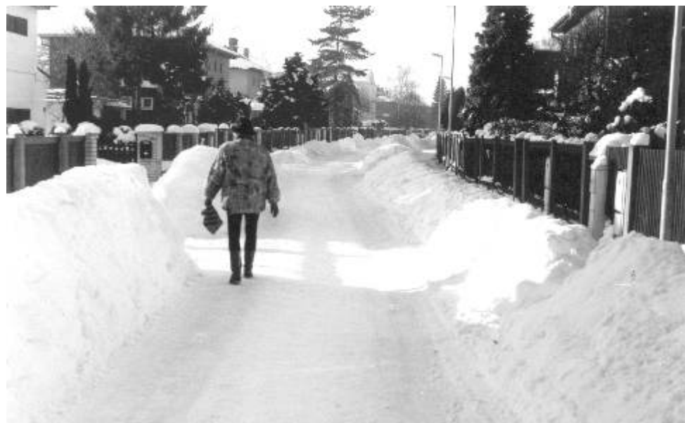
V Ostrově na začátku ledna 2002