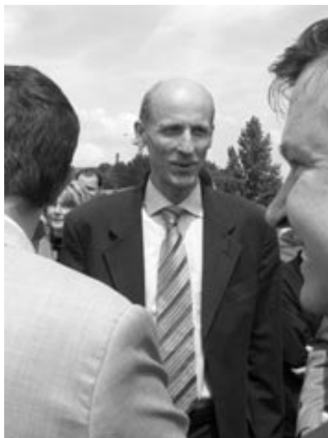
Milan Šimonovský pochválil město Ostrov.

Krátce po otevření nového úseku silnice I/13 byl ministr dopravy Šimonovský středem zájmu televizních reportérů i novinářů. V krátké přestávce mezi jednotlivými rozhovory se nám podařilo získat několik vět výhradně pro Ostrovský měsíčník.