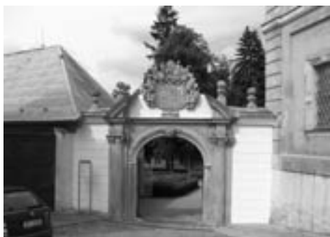
Bílá brána je už zase bílá

Tento kamenický klenot - datovaný roky 1690 až 1692 – brána, kterou vstupujeme do Zámeckého parku, se opět zaskvěla v plné kráse. Tři desetiletí, která ji dělila od posledního restaurátorského zásahu, ji neblaze poznamenala mnoha šrámy, nánosy nečistot i vegetací.