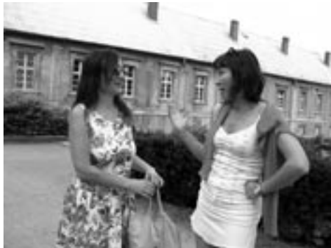
Česká i kanadská turistka se shodují na stoupající úrovni ostrovského historického centra