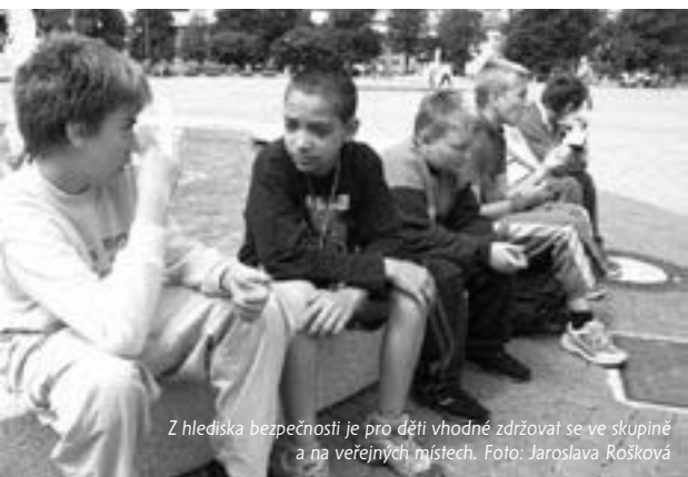
Z hlediska bezpečnosti je pro děti vhodné zdržovat se ve skupině a na veřejných místech.

S prázdninami přicházejí i obavy rodičů, co s dětmi, které mají najednou spoustu volného času. Prázdninové bezcílné potulování totiž může zvláště mladší děti i ohrožovat, jak potvrzuje Zdena Papežová z policejní Preventivně informační skupiny v Karlových Varech.