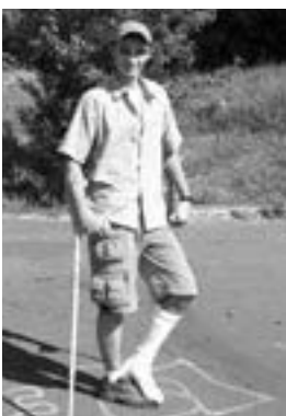
Více volného času přináší i riziko častějších úrazů.