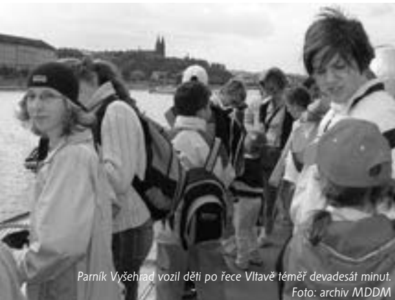
Parník Vyšehrad vozil děti po řece Vltavě téměř devadesát minut.

Ve středu 1. června připravil dům dětí a občanské sdružení Benjamin za partnerské pomoci RWE ČR pro třicet pět neúspěšnějších sběračů dubnového Dne Země, účastníky Májové stezky na Hvězdu a nejpovedenější masky Sletu čarodějnic celodenní výlet do Prahy. Zahájili téměř devadesátiminutovou