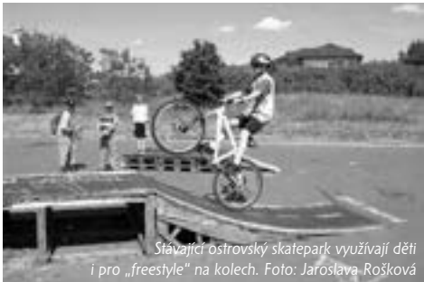
Stávající ostrovský skatepark využívají děti i pro „freestyle“ na kolech.