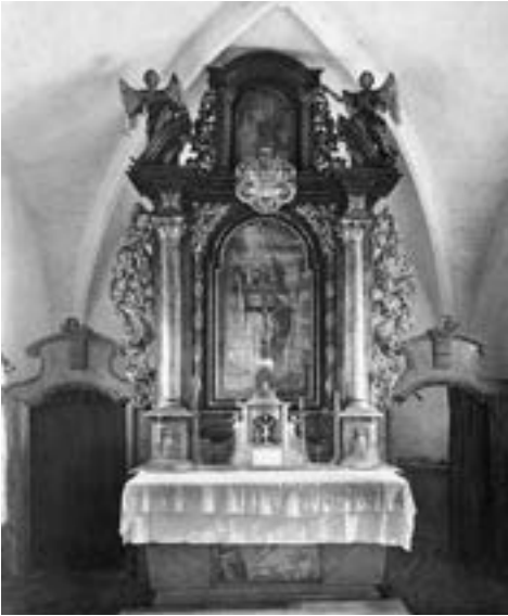
Foto z roku 1953 představuje oltář sv. Jakuba z roku 1712. V současnosti je zachován jen fragment konstrukce, obrazy a sochy andělů byly odcizeny.

Nejstarší stavební památka v Ostrově, hřbitovní, původně farní kostel první osady, nazvané Zlawcowerde (Slávkův ostrov), je zasvěcen sv. Jakubovi Většímu. Je svědkem samých začátků našeho města, jeho vysvěcení je kladeno do roku 1226. Kostel stál původně na vyvýšeném místě a z některých prvků, které se zachovaly po řadě přestaveb a úprav - poslední v roce 1912 - lze usuzovat, že šlo o opevněný kostel se sídlem velmože. Oblast patřila na počátku 13. století tehdy významnému rodu Hradišiců, po roce 1250 podle rodového hradu pánům z Riesenburgu. Patronát nad kostelem patřil cisterciáckému klášteru v Oseku, založenému rovněž Hradišici.