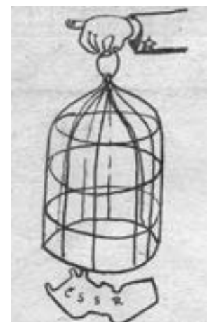
Kresba ze Zvláštního vydání ostrovského Zpravodaje z roku 1968

Vážení čtenáři, rádi bychom se dozvěděli váš názor na novou formu Ostrovského měsíčníku. Své dojmy a připomínky pošlete na sefredaktor@dk-ostrov.cz , nebo je můžete přinést osobně do Infocentra Domu kultury. Uvítáme také vaše témata, o kterých byste chtěli v měsíčníku číst. Redakce