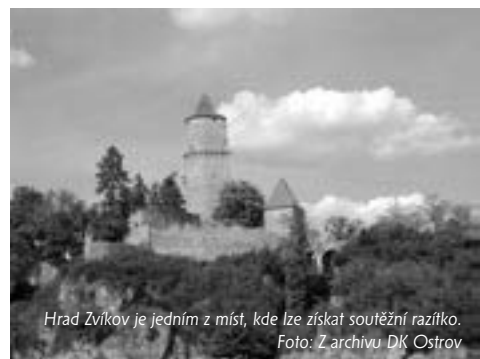
Hrad Zvíkov je jedním z míst, kde lze získat soutěžní razítko.

Vylosovaný výherce dostane digitální fotoaparát, jako další ceny pro ostatní soutěžící jsou připraveny upomínkové předměty a festivalová trika. (jan)