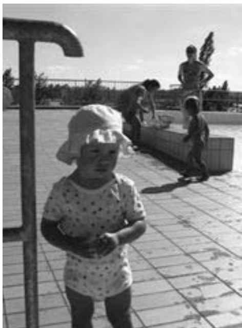
Podmínky bezpečného koupání na ostrovském koupališti vyhovují především nejmenším dětem.

Vyhledávaným místem především mladých ostrovánů jsou v létě také Borecké rybníky. „Na části území Boreckých rybníků je vyhlášena chráněná přírodní oblast a do budoucna tam chystáme zřízení přírodního lesoparku. Žijí zde chráněná živočišná, například čolek velký, vzácné druhy vodního ptactva, jako je potápka roháč, hnízdí tu někteří dravci. V okolí rybníků rostou také chráněné rostliny. Každopádně je oblast Boreckých rybníků vyloučena jak z možnosti koupání, tak i rekreace či jakýchkoli vodních sportů. Je určena pouze k procházkám či projíždkám na kolech po vytyčených cestách,“ uvádí vedoucí odboru životního prostředí v Ostrově Tomáš Čepelák.