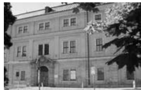
Běžný pracovní ruch v Zámku vystřídal prázdninové ticho.