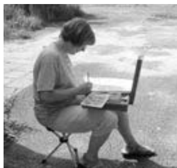
Práce v pleněru patří k nejoblíbenějším činnostem účastníků malířské školy.