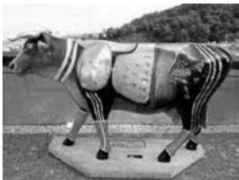
František Vlach se zúčastnil projektu malování krav v Praze se svým „Toreadorem“.