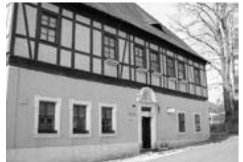
Návštěva muzea v Horní Blatné je jedním z vikendových tipů na výlet.