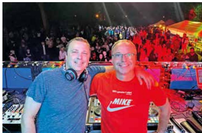
První Danceparade se v Ostrově povedla a fanoušci se mohou těšit na další