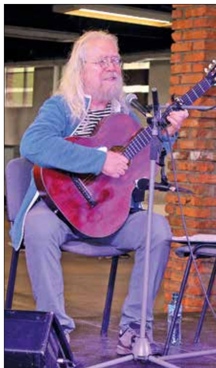
Hostem historicky prvního Koncertu za ostnatými dráty byl legendární hudebník Jaroslav Hutka