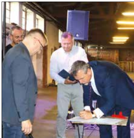
Podpis memoranda je vyústěním dlouhodobé spolupráce Ostrova s Konfederací politických vězňů ČR

Společným zaměřením další spolupráce obou stran je společná péče o Rudou věž smrti s cílem vybudování mezinárodního vzdělávacího centra a památníku nejen otrockých prací na Jáchymovsku, ale také místa připomínajícího další zločiny komunistického režimu, zmařené lidské životy a utrpení bývalých politických vězňů a jejich rodin. (jj)