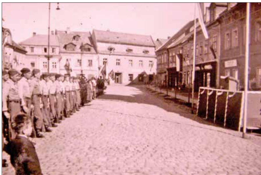
Vojáci ostrovské posádky na náměstí při oslavách 5. května 1946.