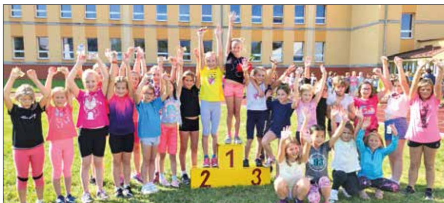
Začátek školního roku prožily děti ze ZŠ Májová ve sportovním duchu