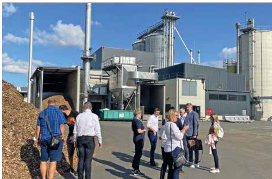
Vedení Ostrova navštívilo partnerské město Wunsiedel

Odbor kanceláře starosty a vnitřní správy Městský úřad Ostrov