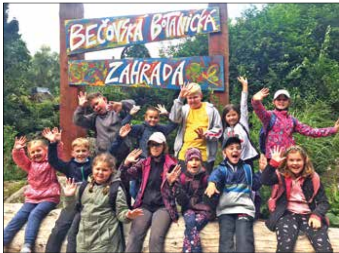
Jeden prázdninový den strávily děti i v Bečovské botanické zahradě