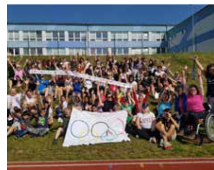
Žáci ZŠ Krušnohorská prožili olympijský den