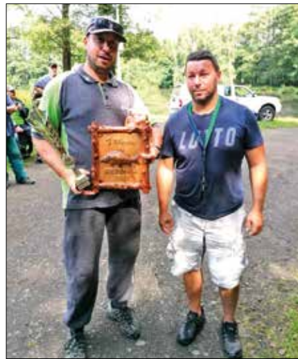
Vítěz závodů O krále Betoňáku nychtal 1 296 centimetrů ryb