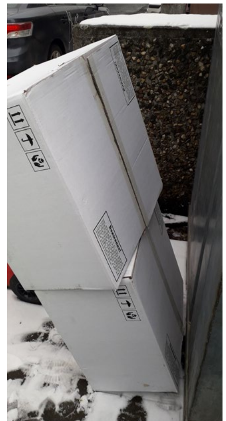
Udržujte čistotu okolo nádob na odpad.