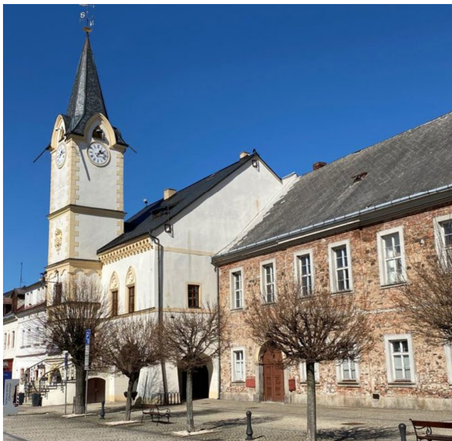
Náklady na rekonstrukci domu čp. 48 by byly podle místostarosty příliš vysoké.