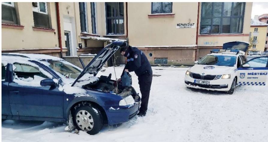
Téměř každý den volají zoufalí řidiči na služebnu městské policie a prosí o pomoc s nastartováním vozidla.