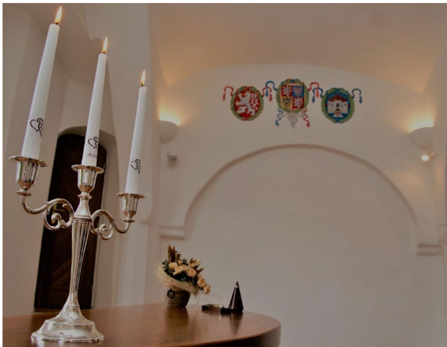
Obřadní síň.

Tato budova, která píše historii starého města, byla v prosinci prodána, a tím pádem město ztratilo jakoukoliv možnost zpřístupnění obřadní síně Staré radnice tělesně handicapovaným občanům (teoretickou možnost vybudovat