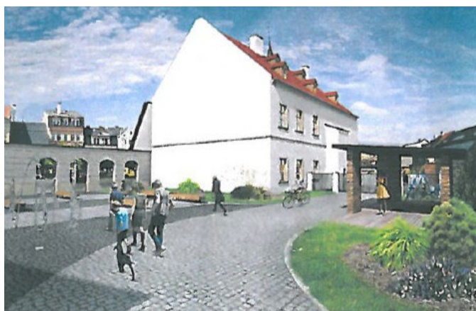
Studie města s odpočinkovým místem - 2016