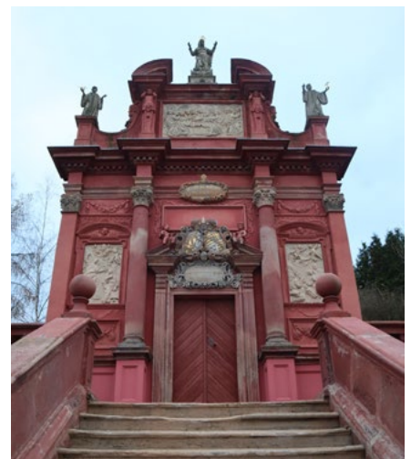
Řešení hádanky z lednového čísla.