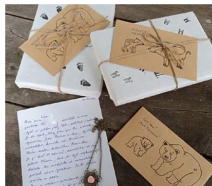
Dárky, které dělají seniorům radost.

pokračovala. A to jak formou ručně vyrobených dárečků, tak formou tvůrčích dílen pořádaných v domovech seniorů. Ráda bych pro svůj projekt získala více partnerů jak kreativních, kteří by mi pomohli dárečky vyrábět, tak finančních, kteří by mi pomohli pokrýt náklady na materiál a poštovné. Nabízí se také varianta spolupráce s firmami, které by mohly darovat sponzorský dar v podobě výtvarného materiálu.