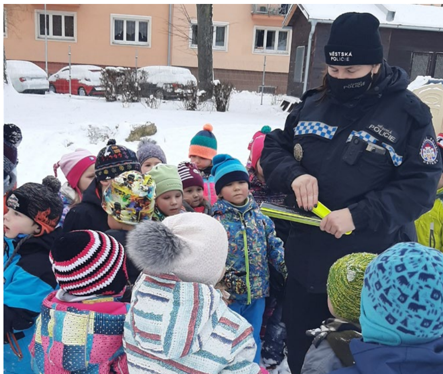
Strážníci rozdávali lidem v Ostrově reflexní prvky.

„Při této akci se občanům rozdávaly reflexní prvky, které v některých případech dokáží předejít nehodám a zraněním,“ uzavřel velitel městské policie. (kor)