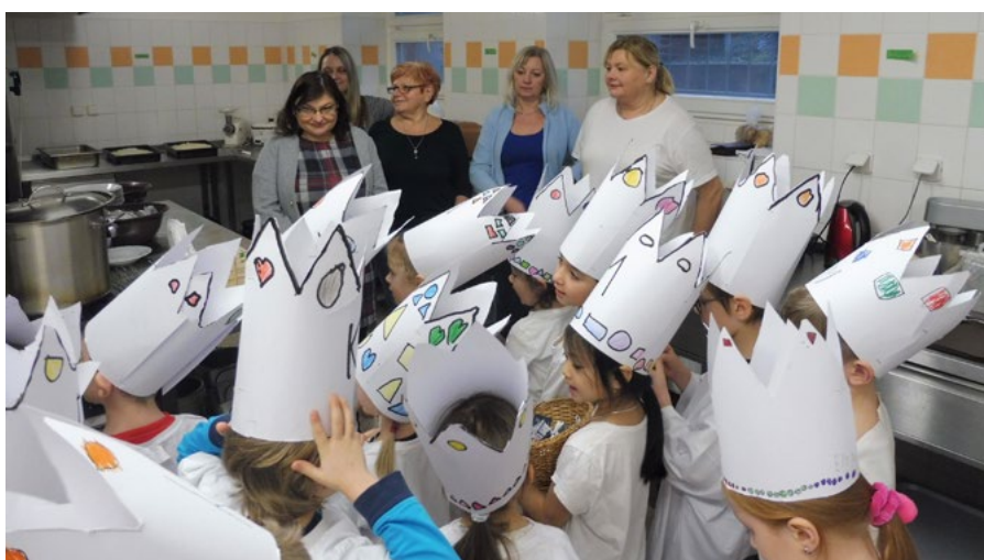
Děti se seznámily s příběhem tří králů a jejich cestou do Betléma k Ježíškovi.