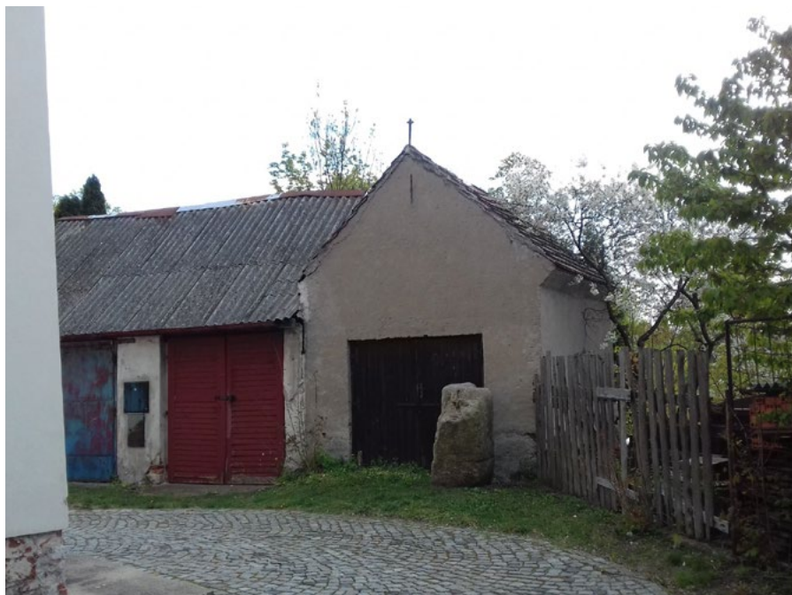
Objekt bývalé márnice slouží jako zámečnická dílna.