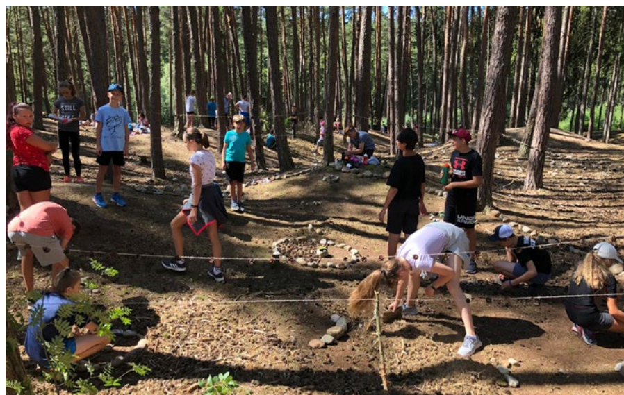
Letní tábor Manětín patří k velmi oblíbeným místům.

Slavnostní vyhlášení vítězů v každé kategorii proběhne v domě dětí v rámci velikonoční výtvarné dílny ve čtvrtek 1. dubna v 10. 00.