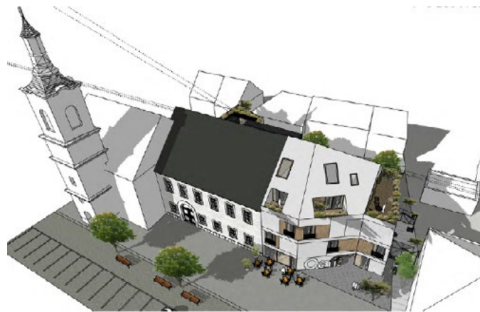
Studie zájemce s přístavbou byt. domu - 2020.