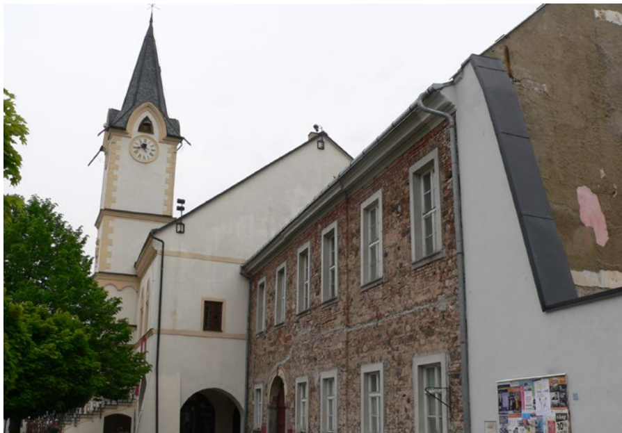
Původní nákup domu čp. 48 by nynější místostarostka nepodpořila.