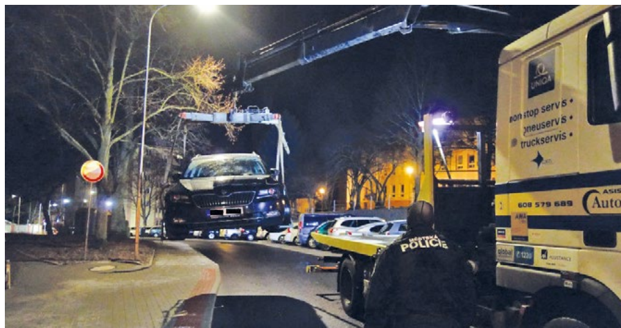
Strážníci městské policie nechají překážející vozidlo odtáhnout i uprostřed noci.