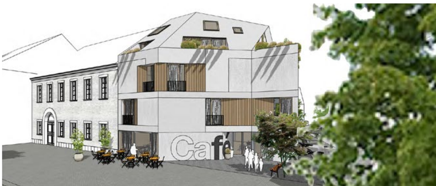
Vizualizace části Starého náměstí.