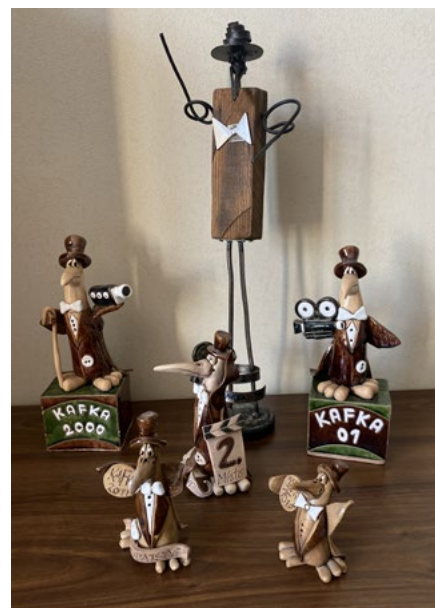
Sbírka cen ostrovské kabelovky.