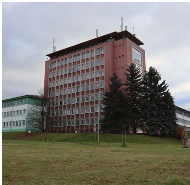
Řešení fotohádky z květnového čísla