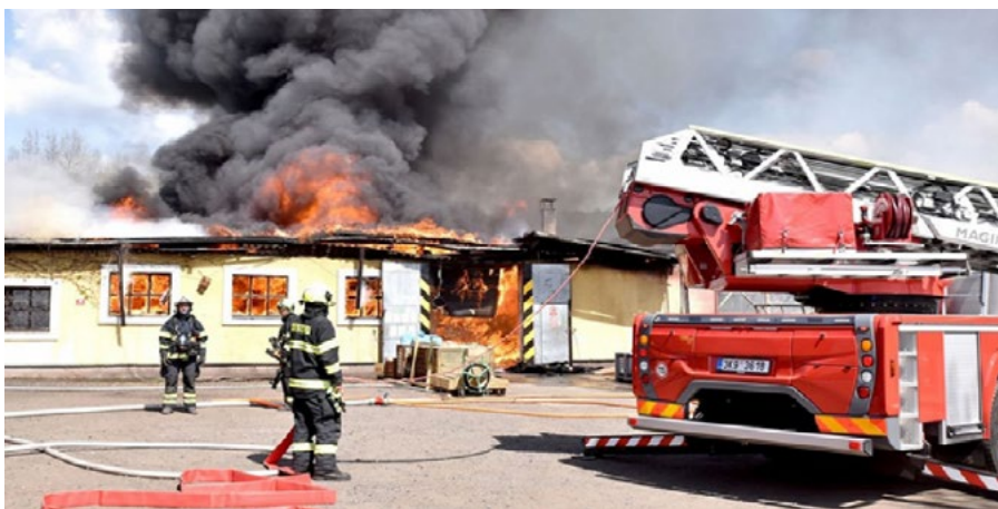
Teplé počasí zapříčinilo výjezd k 15 požárům.