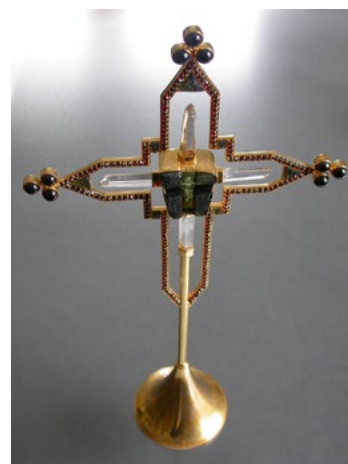
Pacifikál pro papeže Jana Pavla II.