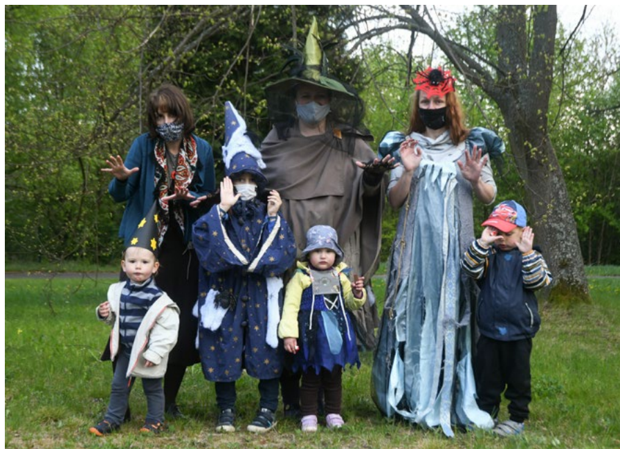
I přes povinná bezpečnostní opatření spojená s koronavirem si Čarodějnou stezku všichni užívali.