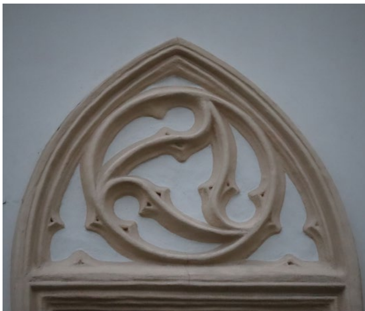
Červnová hádanka.