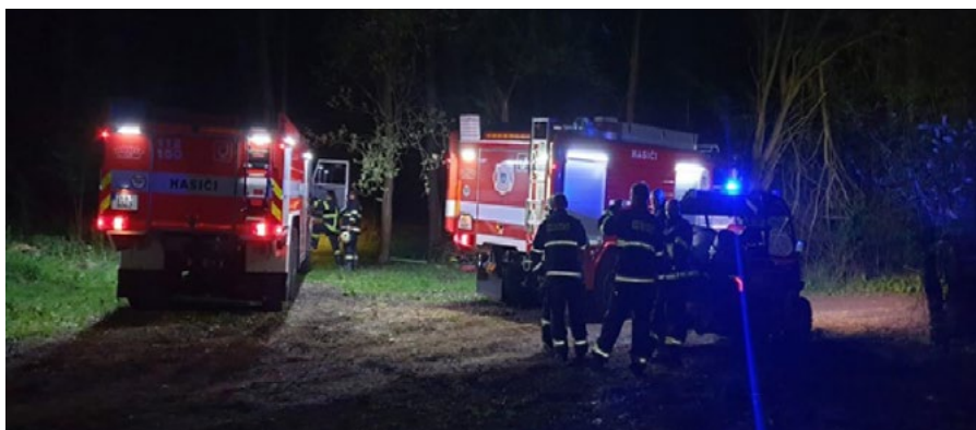
Ostrovští hasiči během jednoho z výjezdů.