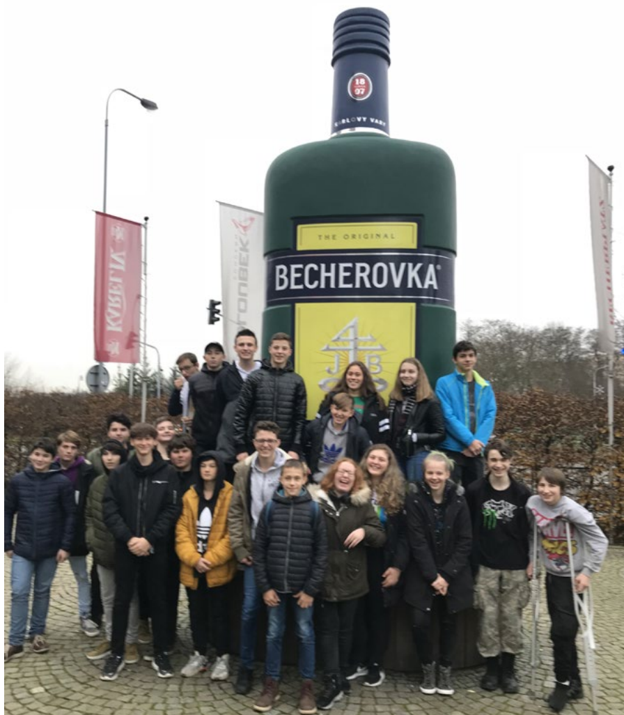
Devátáci v době exkurzí.