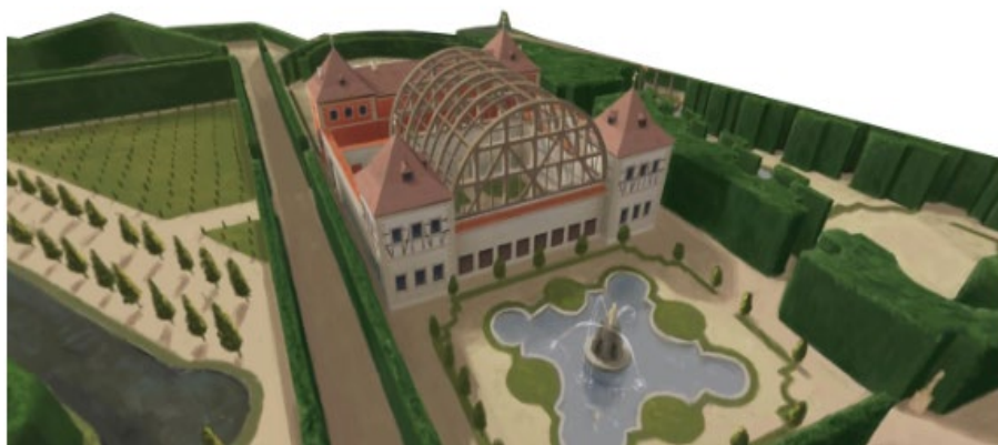
Zjistěte, jaké příběhy vypráví zámecká zahrada.