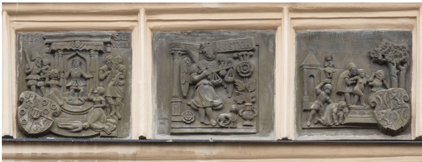
Těchto reliéfů na radnici si chodci málokdy všimnou.