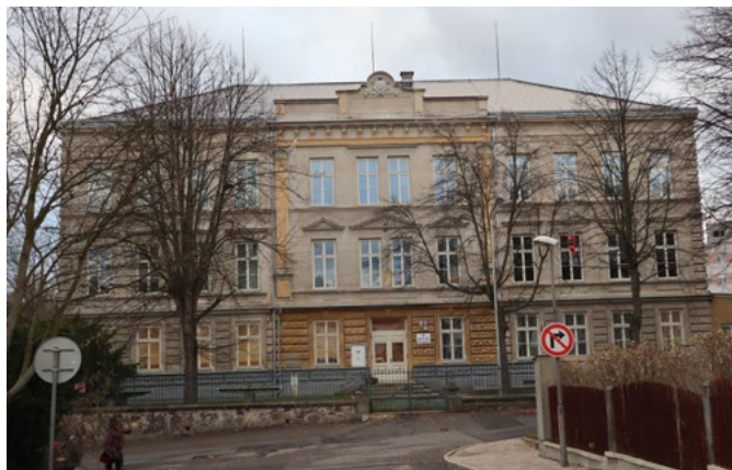
Řešení fotohádkanky z dubnového čísla