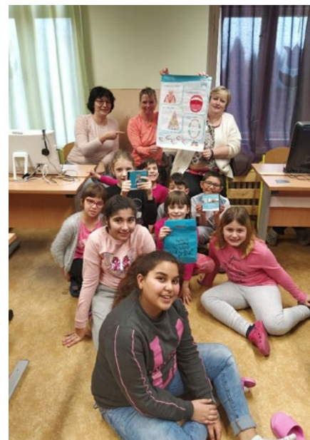
Projekt „Veselé zoubky“ seznámil děti se správnou dentální hygienou.