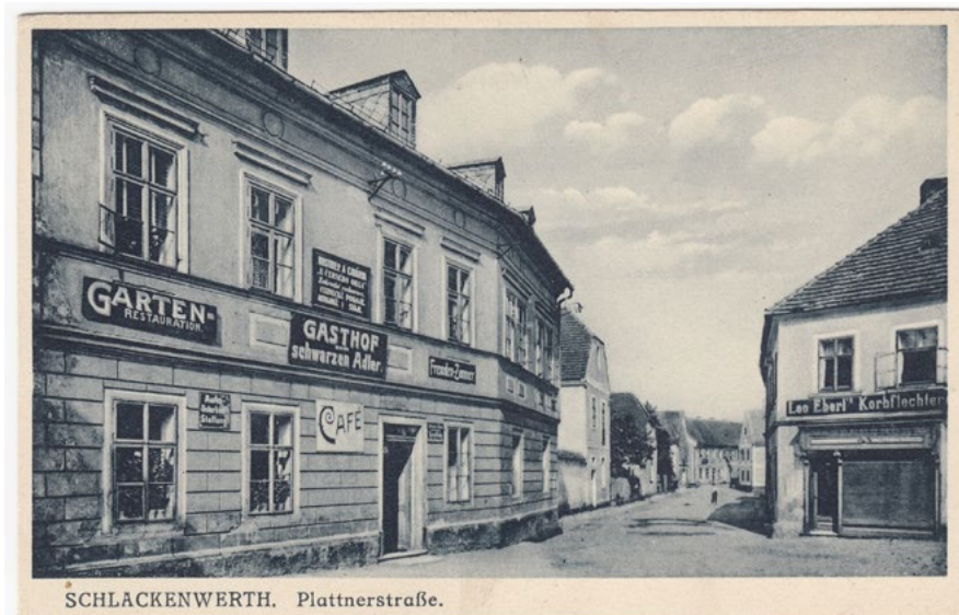
Pohled do dřívější Plattnerstraße, dnešní Hroznětínské ulice vlevo s restaurací U Černého orla