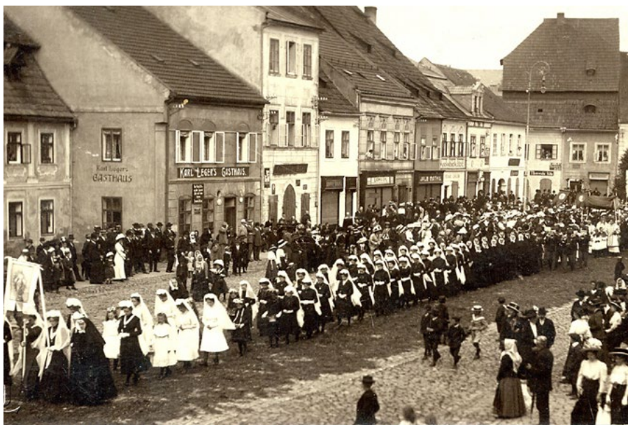
Dobový pohled na procesí.