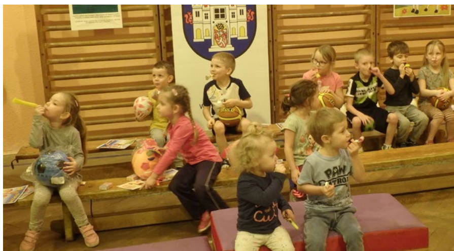
Vítězné fanfáry na frkačky.

Zdenka Braunová, hospodářka oddílu Sport pro všechny TJ Ostrov