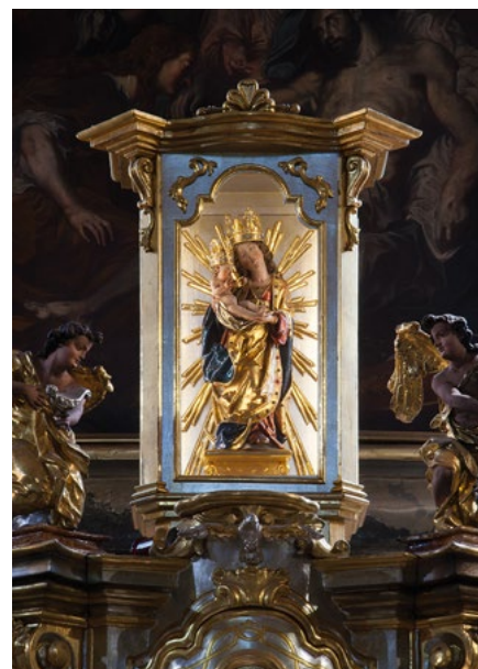
Panna Maria Věrná v ostrovském kostele sv. Michaela.