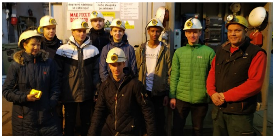
Programátoři na prohlídce jáchymovského dolu Svornost.