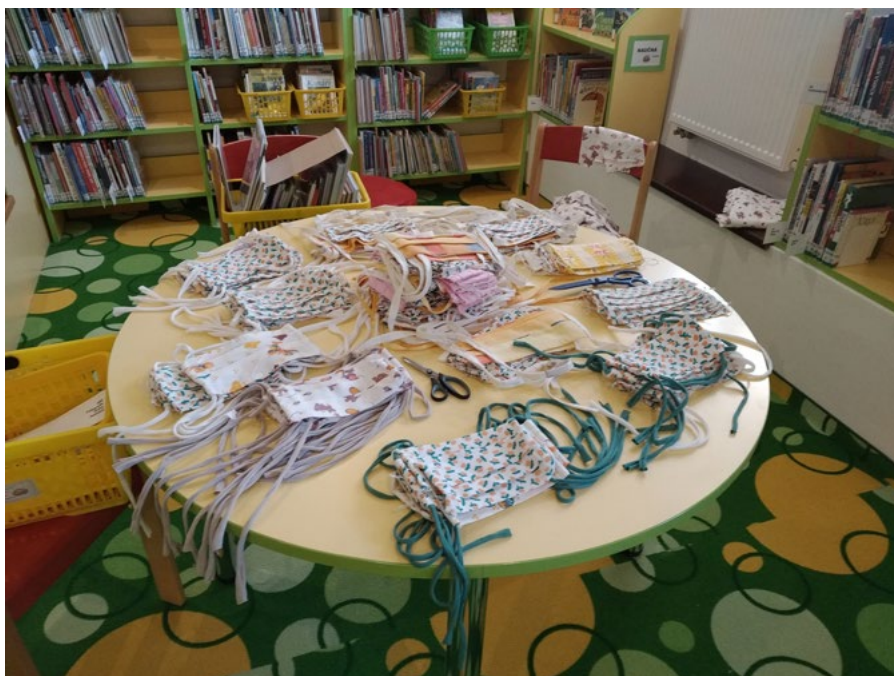
Knihovnice se vrhly na šití roušek.