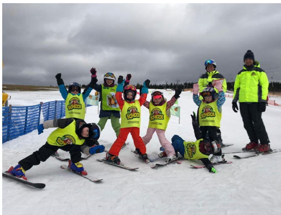
Děti vyrazily s centrem do školičky lyžování.

Barbora Zavadilová, Dětské centrum Žabička