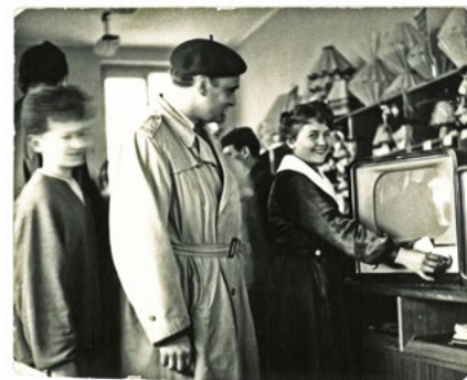
Na snímku z roku 1960 prodej televizorů v OD Brigádník.