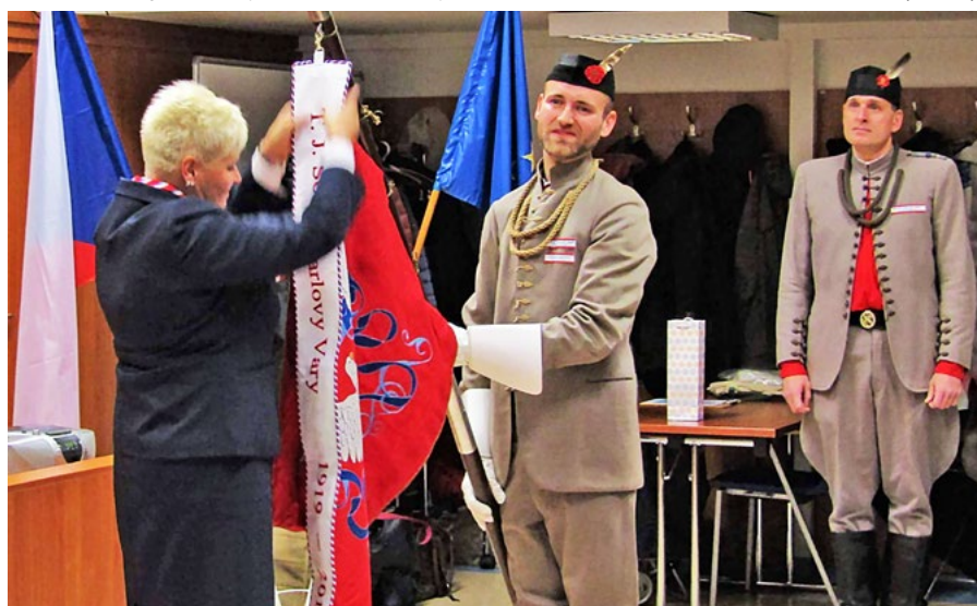
Starostka ČOS připíná pamětní stuhu na prapor karlovarské sokolské jednoty.