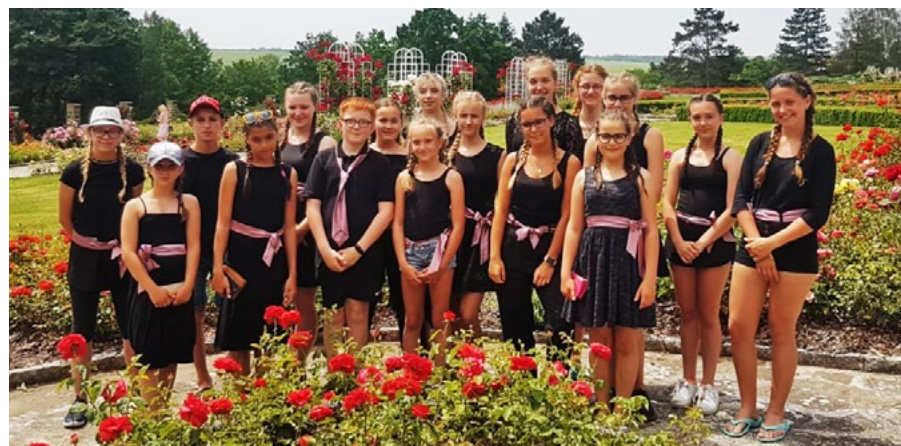
Sbor na přehlídce v Lidicích

V prosinci jsme neměli nějaké velké množství koncertů. Vystupovali jsme