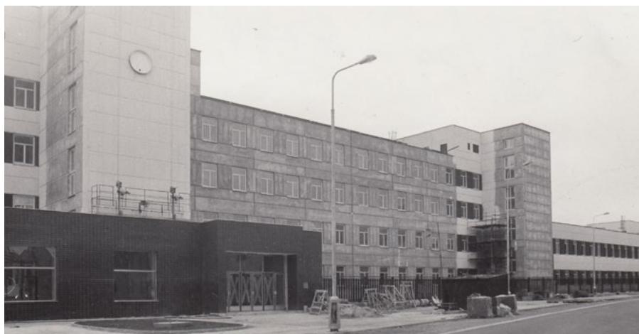
Tesla Ostrov, září 1989 před dokončením