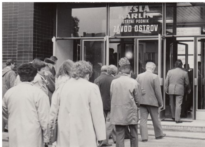
Tesla Ostrov, slavnostní otevření 13. října 1989