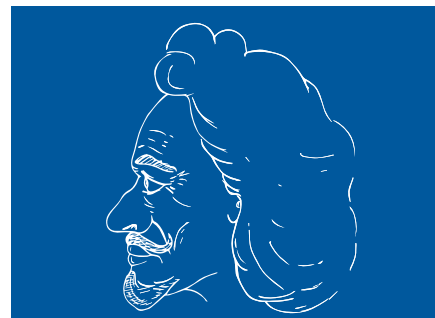
Jáchym Ondřej Šlik

Město Ostrov nabízí řadu dalších volnočasových aktivit pro celou rodinu. V klášterní zahradě můžete navštívit moderní Ekocentrum s mini ZOO s více než 50 druhy zvířat. Součástí areálu je také relaxační zahrada s jezírkem a posezením, dětským hřištěm nebo nevhodní stezkou pro bosé nohy. V areálu ostrovské nemocnice se nachází oblíbené sportcentrum s mnoha atrakcemi včetně lezecké stěny, dětského lanového centra, velké vzduchové trampolíny, hřištěm na petanque, bludištěm, či in-line dráhou. Ostrovské koupaliště nabízí všem milovníkům koupání a letních radovánek kromě velkého 50m plaveckého bazénu s tobogánem, také dva malé dětské bazény a beach volejbalové hřiště. V areálu MDDM naleznete prostory pro široké spektrum sportovních aktivit – fotbalové hřiště a minihřiště s umělým trávnikem, hřiště netradičních sportů s dvěma kuželkovými drahami, lanovou pyramidou a minihorolezeckou stěnou, hřiště na minigolf, multifunkční hernu