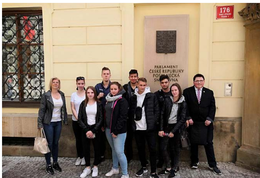
Studenti oboru veřejnoprávní činnost před Parlamentem ČR