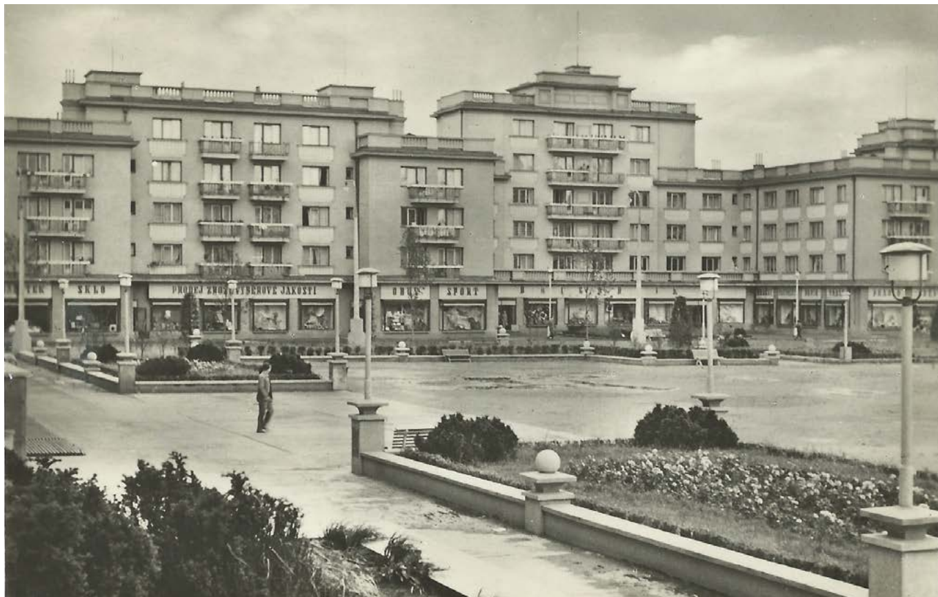
Foto: Obchodní dům Brigádník na dobové pohlednici, sbírka Josef Macke.

V rámci městem vyhlášeného ROKU SVOBODY A DEMOKRACIE proběhla již řada besed a další nás jistě čekají. Než se nám vzpomínkový rok přehoupne do osudových listopadových dnů, není na škodu trochu zavzpomínat, jak se nám za socialismu žilo. Otevřeme tedy kroniku roku 1989 a podíváme se třeba na to, jak fungovalo zásobování města.