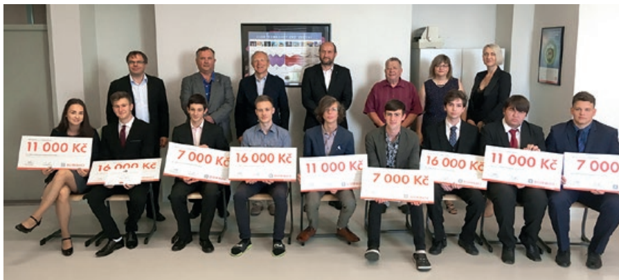
Prvních devět stipendistů Motivačního programu Prokopa Diviše

Po pěti letech se učitelé i žáci SPŠ Ostrov a sedmi spolupracujících základních škol loučí s Robotickým projektem realizovaným v rámci Podpory přírodovědného a technického vzdělávání v Karlovarském kraji. Žáci základních škol chodili ve svém