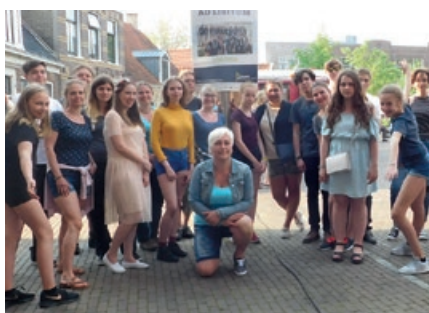
členové orchestru Ad libitum před plakátem ke svému koncertu