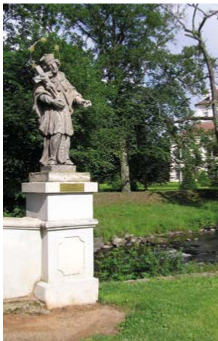
Socha sv. Jana Nepomuckého v Zámeckém parku