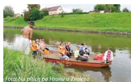
Foto: Na plitích po Hronu u Zvolena

předseda výkon. výboru TJ Slovan Karlovy Vary