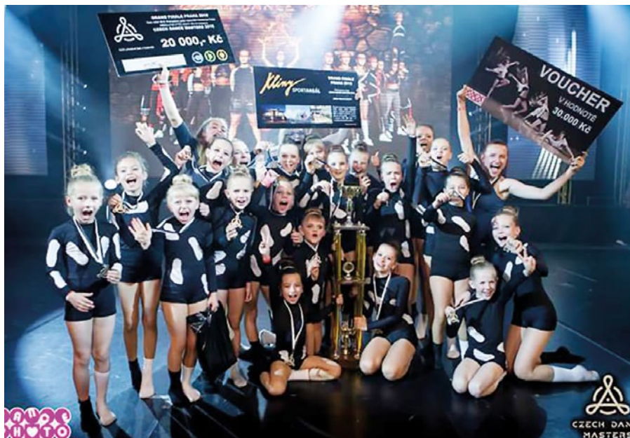
NOHY – Czech Dance masters