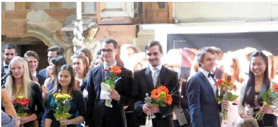
Nejlepší studenti si převzali ocenění.