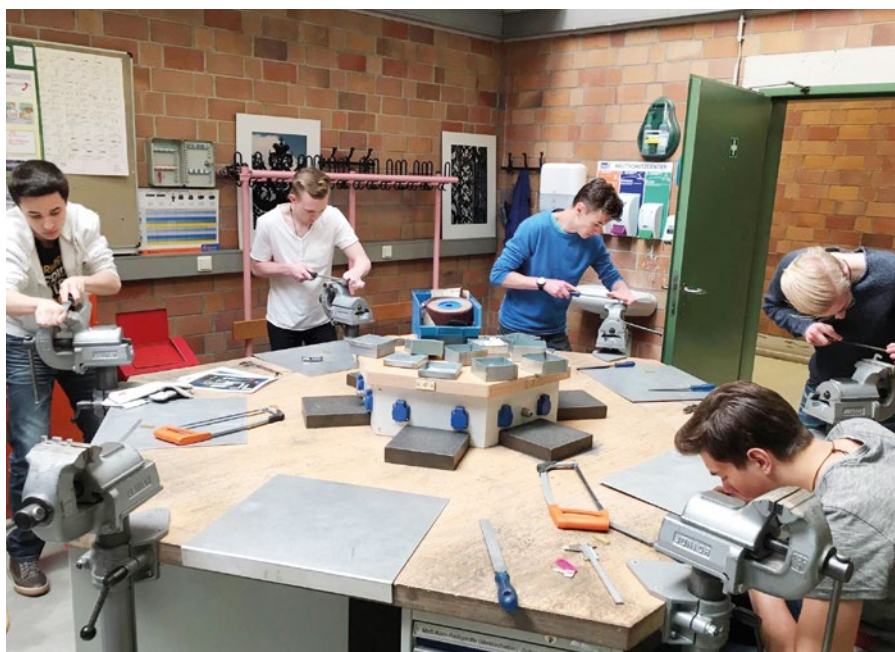
Čeští studenti si v německých dílnách vyrobili suvenýry.

burgu, kde jsme navštívili automobilku BMW, nechyběla ani trocha sportu (horo-lezecká stěna, bazén), společně jsme grilovali a trávili večery; někteří v rodinách, jiní spolu s ostatními českými i německými kamarády. Program byl opravdu bohatý a zajímavý. Na týden strávený u našich německých sousedů budeme ještě dlouho vzpomínat a doufáme, že nám uzavřená přátelství vydrží. Vždyť řada z nás už má domluvené návštěvy o prázdninách, v Německu i v Čechách.