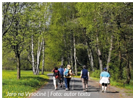
Jaro na Vysočině

Bližší informace (doba odjezdu, počet km, org. propozice) budou k dispozici vždy od středy pro příslušný sobotní termín ve vitrině KČT na Mírovém náměstí u autobusové zastávky na K. Vary. Více na: www.turiste.webpark.cz