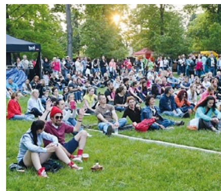
V parku se sešlo pět set posluchačů.