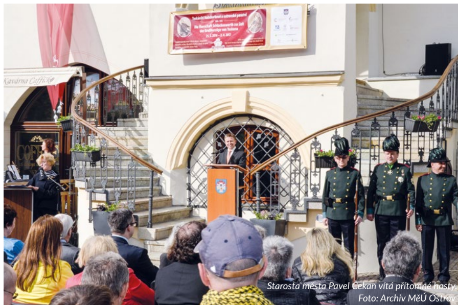
Starosta města Pavel Čekan vítá přítomné hosty