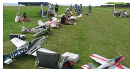
Letecká soutěž klubu v Rakovníku 2013

Modelářský klub Ostrov vás zve na Krušohorský pohár (soutěž kategorie F4H - RC velkých maket), který se koná 23. července na letišti Karlovy Vary - Hory (GPS: 50°13'2.550"N, 12°46'31.611"E). Na soutěži budete mít možnost zhlédnout opravdu unikátní modely letadel s maximální vzletovou hmotností 15 kg.