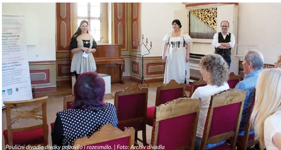
Pouliční divadlo diváky pobavilo i rozesmálo.

Pátý ročník OKL odstartoval 28. května. Nejprve se na podiu v Zámeckém parku představila KV kapela Zajíc Company, poté nastoupila oblíbená kapela Jelen. Zahrála mj. své největší hity jako Světlo ve tmě, Vlčí srdce, Nebe nad Prahou ad. Hostem byla zpěvačka Kateřina Marie Tichá, která s kapelou zazpívala kromě jiných i jednu z nejhranějších písní současnosti: Co bylo dál. V závěru dvouhodinového vystoupení zazněly hity kapely Magdalena a Jelen. Divácky příjemnou atmosféru umocnil vynikající výkon všech vystupujících a zanechal nesmazatelnou stopu u bezmála 500 návštěvníků. Ostrovské kulturní léto pokračuje 23. července vystoupením legendární zpěvačky Marty Kubišové. Jako předkapela se představí skupina Bluetet. Poslední díl se uskuteční 2. září, kdy zahraje skupina Last Station a slovenská kapela No Name.