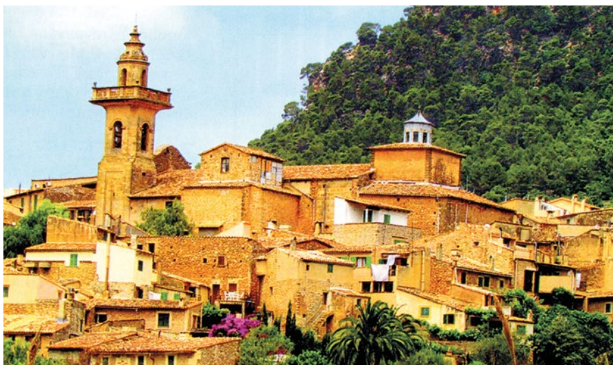
Kartouza ve Valdemosse, Mallorca

Výstava na Staré radnici je otevřena vždy od úterý do neděle v době od 11.00 do 17.00 hodin. Vstupné je 50 Kč, 50% sleva pro děti do 10 let, důchodce a ZTP.