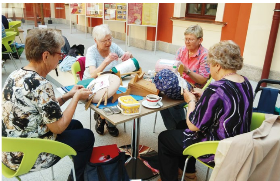
Krajkářky se setkávají pravidelně.

Na Karlovarsku pracuje několik šikovných žen, které toto staré řemeslo obnovují podle starých dokumentů. Setkáváme se každý měsíc v MDDM na Čankovské v K. Varech. O prázdninách je MDDM zavřené, tak se již poosmě setkáme v DK v Ostrově.