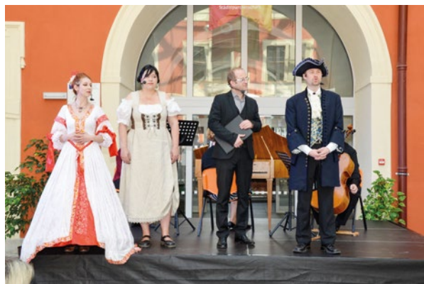
Pouliční divadlo V. Braunreitera zahrlo scénky z historie obou měst.