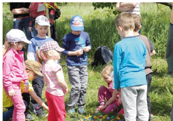
Děti plnily formou zábavy nejrůznější úkoly.

Vojkovicích. Na nedaleké louce už byla pro děti připravena pohádková stanoviště s různými soutěžními úkoly. Budulínkovi děti pomáhaly třídít hrášek, prolézaly tunelem jako lištičky, rodiče je nosili na zádech. Na dalším stanovišti pomáhaly Červené karkulce dávat do košíčku věci, které nesla babičce k svátku, vybíraly červená víčka. Dále už na ně čekali Dlouhý, Široký a Bystrozraký a děti chodily na chůdách, sbíraly kolíčkem papírové koule, hrály bitvu s bambulemi. Po splnění všech úkolů hledaly schovaný sladký poklad, který samozřejmě rychle našly a spravedlivě se podělily. Dopoledne skončilo opékáním buřtíků na ohni a osvěžením všech účastníků v místním kempu, kde si děti mohly dát i zmrzlinu. Po kratším odpočinku už jsme zas spěchali na vlak zpátky domů. Poděkování patří všem rodičům i dětem za úžasnou spolupráci a kolektivní pracovnicků školky za spolupráci a pomoc.