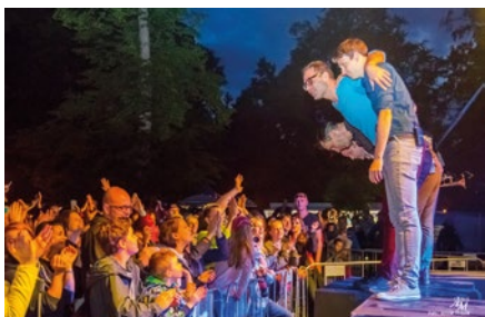
Program Majálesu uzavíral MIG 21. | Foto: Arnošt Mrázek

Na druhém ostrovském majálesu 3. června vystoupily v Zámeckém parku kapely Quiet, Stripes of Glory, Artvox, Sabrage, Megaphone a hlavní hvězda večera, Mig 21. Všechny kapely hrály s nasazením a vervou a vůbec nevdalo, že během akce několikrát pršelo. Proměnlivé počasí způsobilo menší zájem návštěvníků, přesto však přišlo 486 osob a vládla pohodová atmosféra. Děkujeme všem, kdo na akci přišli, všem účinkujícím i těm, kdo akci finančně podpořili (město Ostrov, Karlovarský kraj a Okay Elektro) a samozřejmě všem médiím i jednotlivcům, kteří pomáhali s propagací a stánkařům za dobré jídlo a pití! Děkujeme a přišťi rok na shledanou. (Fotoreportáž: www.facebook.com/dkostrov/ )