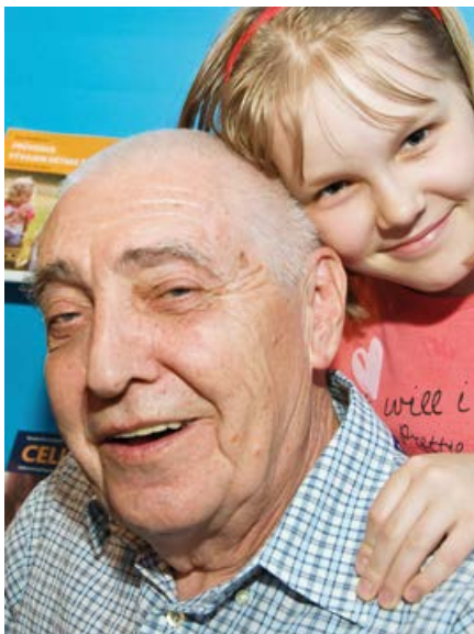
S vnučkou Aničkou na autogramiádě

Především si myslím, že je dobré vyjasnit si, co se pod tím pojmem skutečně skrývá, protože každý tam vidí něco jiného. Psychosomatika jako nově uznaná specializace není žádná duhařina. Chceme, aby se stejně odpovědně, jako se berou vlivy biologické, braly v úvahu také vlivy psychosociální, které se uplatňují ve zdraví i nemoci. Asi čtvrtina pacientů přichází do ordinace praktického lékaře s takzvanou funkční poruchou, kdy jde o problémy na úrovni řídicích systémů; nenajdeme žádný závažný organický podklad, ale pacient skutečně trpí.