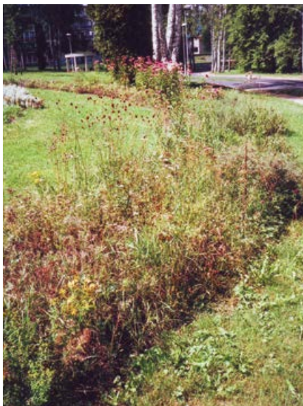
Záhon plevelů (až na rudbekie v pozadí)

Co s tímto neutěšeným stavem? Nejlepší možná současná úprava, vhodná