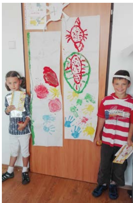
Děti zážitková tvůrčí výuka angličtiny baví.

chtějí aktivně propojit angličtinu a tvoření. Bližší informace na: www.anglictina-ostrov.cz , FB: Angličtina Ostrov. Všem studentům přejeme pohodový začátek školního roku.