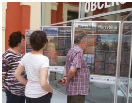
Příběhy o Marcebile lákají k přečtení.

Panelová výstava „Marcebila se vrací do Krušných hor“ mapuje legendu o Marcebile a je ke zhlédnutí ve Dvoraně ostrovského zámku od 28. července; ten, kdo se do příběhu o patronce Krušných hor jednou začte, málokdy dokáže odtrhnout oči, dokud příběh nedočte do konce.