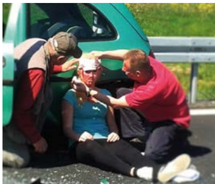
Ostrovští herci se zúčastnili kampaně Ty to zvládneš.

V tomto měsíci plánujeme rozloučení s komedií Postel pro Anděla. Představení jste v Ostrově mohli vidět již třikrát; celkem se na ně sešlo 298 fanoušků našeho divadla. Čtvrté, závěrečné představení odehrajeme v Domě kultury 20. září s menší změnou obsazení, takže se dá předpokládat, že hra bude zas trošku jiná. Divadelní scéna, jejíž jsem součástí, v tomto roce opravdu nezáhalela. Důkazem jsou dvě odehrané premiéry. Na představení Zátíší s loutnou, které režíroval Petr Pokorný, nás přišlo podpořit rekordních 262 fanoušků, na znovuobnovenou premiéru S tvou dcerou ne v režii Jana Mareše pak 194 fanoušků. Věřte, že máme velkou radost z takového úspěchu a že nás nesmírně těší přízeň, kterou na domácí scéně máme. Nezapomínáme ani na malé diváky, proto jste nás mohli vidět na Městských slavnostech, Dnu dětí s MDDM či na Dětském dnu v Nebanicích s pohádkovou prvotinou Leny Pintnerové. Reprízu uvidíte na Michaelské pouti. Podpořili jsme I. ročník Masopustu v Ostrově, který nás nesmírně bavil. Jako amatérští herci se