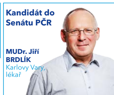
Kandidát do Senátu PČR