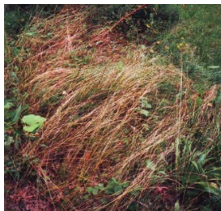
„Záhonek“ v parku u nemocnice

i pro budoucnost: Odplevelit původní květinové záhony, zřít je a přeměnit na travnatou plochu. Zbytek původních květin případně soustředit na jeden záhon, např. u jednoho z mokřadů. Ponechat jen záhonky s léčivkami, ale postarat se o jejich údržbu během vegetace, doplňování chybějících, kontrolu, zda souhlasí jmenovky s druhem léčivky atd. Na to by ovšem byl třeba odborník zahradník, nebo aspoň jeho dohled.