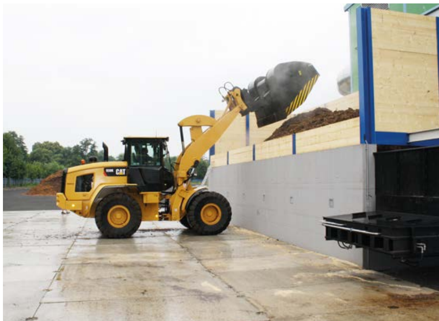
Nakladač štěpku