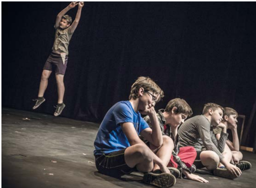
Záběr z představení Zápisník Norberta Borovičky