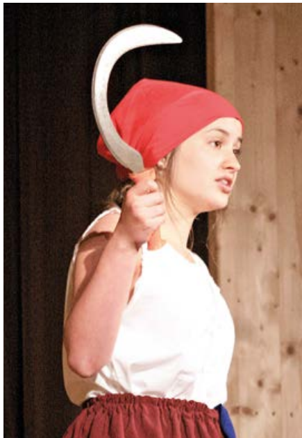
Z představení Jelizaveta Bam