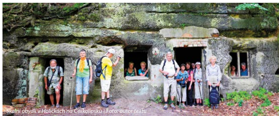
Skalní obydlí v Holíčkách na Českolipsku

Bližší informace (doba odjezdu, počet km, org. propozice) budou k dispozici vždy od středy pro příslušný sobotní termín ve vitríně KČT na Mírovém náměstí u autobusové zastávky na Karlovy Vary. Bližší údaje jsou na internetové adrese: www.kctkvary.cz (pozor, změna adresy)