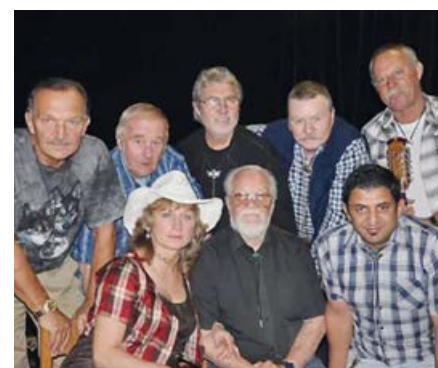
Country skupina K. T. O.