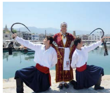
Soubor Dikmen ze Severního Kypru

Letos již počtvrté navázal Karlovarský folklorní festival spolupráci s Domem kultury Ostrov a vytvořil pestrý taneční program. Mírové náměstí ožije 8. září v 15.00 hod. v rytmu hudby tří souborů, tentokrát z Itálie, Polska a Kypru.