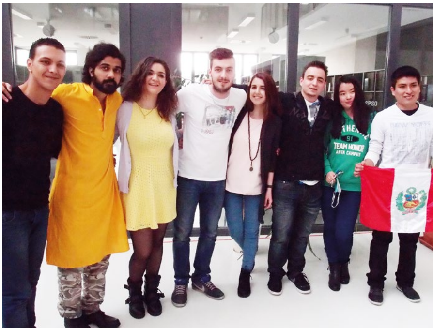
Všichni účastníci Projektu Edison