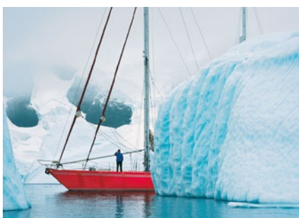
Malebná Antarktida se svými ledovci

Klášteřínský kostel nabízí návštěvníkům od 19. dubna výstavu fotografií Jiřího Kolbaba, populárního českého cestovatele a fotografa. Fotografie velkoplošného formátu autor prezentuje při rozsáhlých výstavách nejen doma, ale i v zahraničí. Zajímavou a neotřelou formou zachycuje detaily přírodních struktur a exotické tváře domorodců. Jiří Kolbaba je impozantní charizmatičtý vypravěč; nejen proto jsou populární jeho besedy s poutavými dia-show i jeho mnohaletý pořad na Rádiu Impuls. V celosvětové kampani „Keep Walking“ byl Jiří Kolbaba zařazen do elitní skupiny cestovatelů a dobrodruhů, je viceprezidentem Českého klubu cestovatelů. Projel všech šest kontinentů planety, navštívil víc než 130 zemí. Ačkoli již zcestoval téměř celý svět, jeho krédem zůstává: „Mým snem je navštívit, poznat a pochopit další země, vzdálené kultury a přátelské domorodce“. Výstavu oficiálně zahájí osobně Jiří Kolbaba v úterý 19. dubna v 17.00 hod.