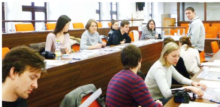
Studenti architektury se zajímají o naše město.

Klášteřínský areál, park, ale i sídliště, Mírové náměstí a architektonicky cenné objekty restaurace Družba, MŠ Halasova, MŠ Krušohorská a objekt nové SPŠ Ostrov. Společným tématem prací studentů je nevyužitá a zanedbaná území mezi Jáchymovskou ulicí a bývalou železniční vlečkou – území mezi novým a starým městem, historií a současností. Studenti pro ně budou hledat možnosti využití tak, aby zohlednili stávající provozní potřeby, ale zhodnotili i potenciál ploch. Po dokončení budou své práce prezentovat v ostrovském zámku, kde je zhlédne i široká veřejnost. Věříme, že se dočkáme nových a zajímavých nápadů a podnětů, jak naložit s nevyužitým prostorem.