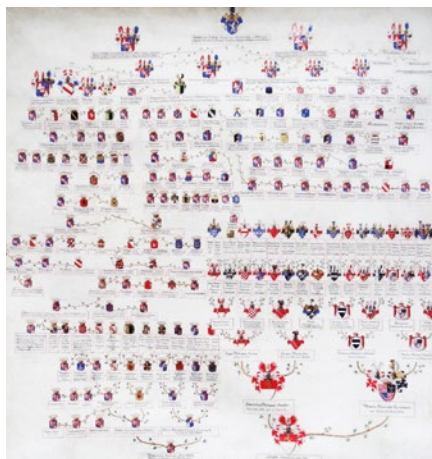
Rodokmen Schliků lze rovněž nově spatřit na zámku.

expozice o tyto unikátní sbírkové předměty chce Město Ostrov přispět k oslavám 500. výročí založení horního města Jáchymov a 490. výročí od smrti Štěpána Schlika v bitvě u Moháče r. 1526.