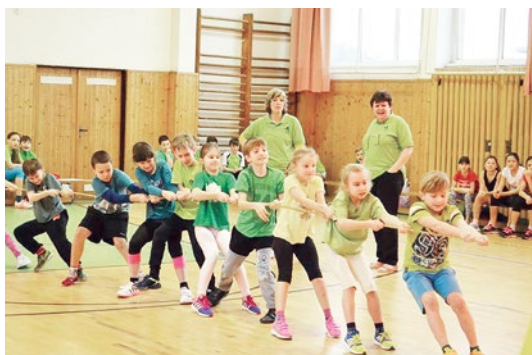
Žáci berou soutěž vážně.