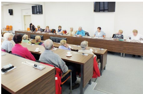
Na výroční schůzi se dostavilo 63 seniorů.