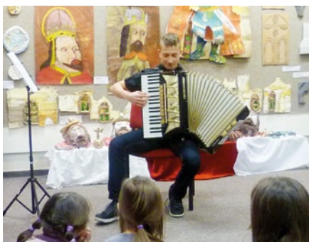
Vernisáž v Duhové paletě