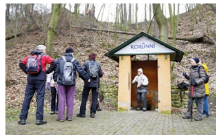
Stráž nad Ohří, obnovený odběr kyselky Korunní

Kalendář veřejných turistických akcí v dubnu