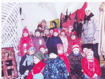
Ilustrační foto: Archiv MŠ Masarykova