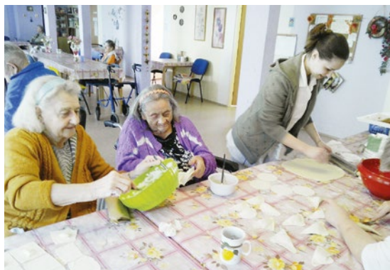
Klientky Domova připravují domácí pečivo.

Domov pro seniory se nachází v malebném podhůří Krušných hor, nedaleko centra města Ostrov. Naše soukromé zařízení poskytuje sociální a zdravotní služby pro osoby od 60 let s kombinovaným i zdravotním postižením a seniory se sníženou soběstačností s potřebou celodenní nepřetržité péče. Domov Květinka nabízí domácí prostředí a individuální péči klientům takovou formou, aby mohli žít běžným způsobem života a s podporou nabízených sociálních služeb prožít důstojné stáří i s účastí rodiny. Objekt, ve kterém