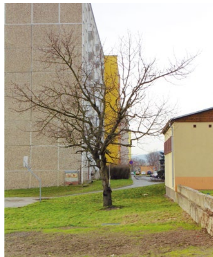
Poslední dochovaný ovocný strom v Zahradní ulici

V průběhu let 1976-79 byla v okolí Zahradní ulice postavena tzv. 18. etapa se 742 byty. Přimo v bezprostřední blízkosti rodinných domků v zahradách bylo r. 1979 otevřeno také nové nákupní centrum s lékárnou, dnes restaurace Placka, ale mnohý z vás si jistě vzpomene i na Mléčný bar, který na dlouhá desetiletí dal této nízkopodlažní budově přízvisko „Mlíčňák“. Výstavba však pokračovala neúprosně dál. Na místě bývalé kotelny se začalo se stavbou I. základní školy, která byla slavnostně otevřena 1. září 1982. Budování města nešlo zastavit. Rodinné domky v kdysi klidné Zahradní ulici musely nakonec ustoupit potřebám nových bytů. Roku 1986, tedy právě před 30 lety, došlo k demolici osmi domů v Zahradní ulici. Na jejich místě byly v letech 1987-89 postaveny dva nové panelové činžáky se 136 bytovými jednotkami.