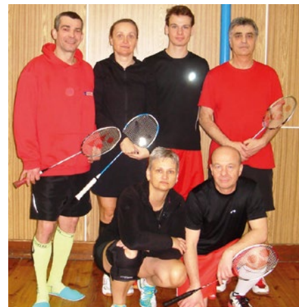
Ostrovská výprava

O celostátním turnaji GP C dospělých 26. března v 10.00 hod. v hale TJ Ostrov (v době uzávěrky OM teprve v přípravě) zjistíte více na: www.badostrov.estranky.cz