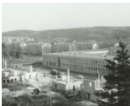
Demolice v Zahradní ul. počátkem května 1987

Ne každý dnes ví, kde tahle krátká ulička v našem městě vlastně leží. Vždyť na žádném nároží, na žádném domě její označení vidět není. Stačí však otevřít mapu Ostrova, a hle, krátká nenápadná ulička v plánech zakreslena opravdu je. Apřeci tomu kdysi bývalo jinak. Zahradní ulice byla oázou zeleně a klidu v moři polí a luk. První rodinné domky tam začaly vyrůstat již v letech 1913-14. Tehdy se však od města trochu vzdálené sídliště ještě nazývalo Am Quend, či Quend Straße, případně Gwend Straße. Časem však začali po r. 1948 na okolních loukách a polích místo zemědělců úřadovat stavaři. V okolí teď již Zahradní ulice vyrůstaly nové činžovní domy a dokonce vznikaly celé ulice, které se staly základem nového moderního města. Velkým kazem na krásu Zahradní ulice pak byla především centrální kotelna, postavená v 50. letech 20. stol. v bezprostřední blízkosti