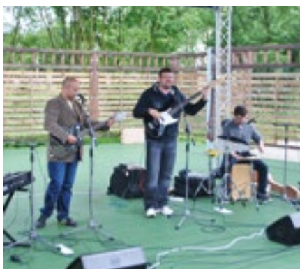
Skupina Slnovrat zavítá opět do Ostrova.

Římskokatolická farnost Ostrov zve příznivce folkové muziky na koncert pro Boží milosrdenství, který se koná 5. března v 19.00 hodin v kostele sv. Michaela a Panny Marie Věrné.