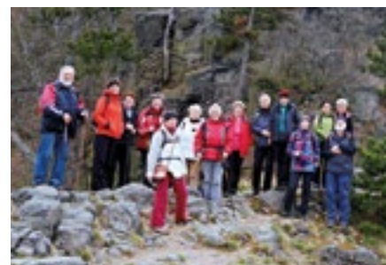
Bořeň u Bíliny

Bližší informace (doba odjezdu, počet km, org. propozice) budou k dispozici vždy od středy pro příslušný sobotní termín ve vitrině KČT na Mírovém náměstí u autobusové zastávky na K. Vary. Více na: www.turiste.webpark.cz