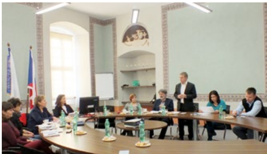
První jednání sdružení se uskutečnilo koncem ledna na zámku.

Ostrovský zámek poprvé hostil 28. ledna jednání regionální sekce členských měst a obcí Karlovarského kraje při Sdružení historických sídel Čech, Moravy a Slezska. Prvním bodem programu bylo hodnocení uplynulého roku, např. oceněné „Památky roku 2015“, „Historického města roku 2015“, ceny za nejlepší přípravu a realizaci Programu regenerace městských památkových rezervací (MPR) a městských památkových zón (MPZ) ad. Hlavní část byla především věnována zadání analýzy „Efektivita státních výdajů na péči