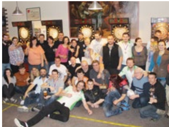
Letošní účast překvapila velkým počtem účastníků.

Na premiérovém loňském ročníku se sešlo 61 hráčů a hráček, zkušených šipkařů, amatérů, Milanových kamarádů i hrajících rodinných příslušníků. Ovšem letos byl tento počet navýšen a nový rekord má 67 hráčů! Včetně Milanovy nejbližší rodiny