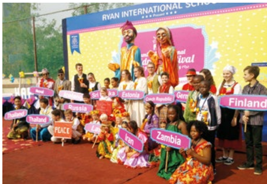
Soubor Hop-Hop navštívil festival v Indii. | Foto: Archiv ZUŠ Ostrov