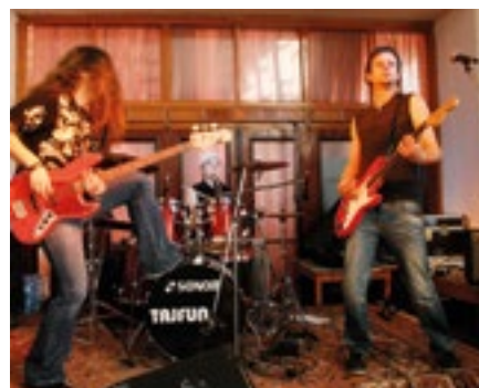
Z minulých ročníků Regionbeatu | Foto: Archiv DK

Vstupenky zakoupíte v infocentrech města Ostrov nebo online na: www.dk-ostrov.cz za velmi příznivou cenu 100 Kč.