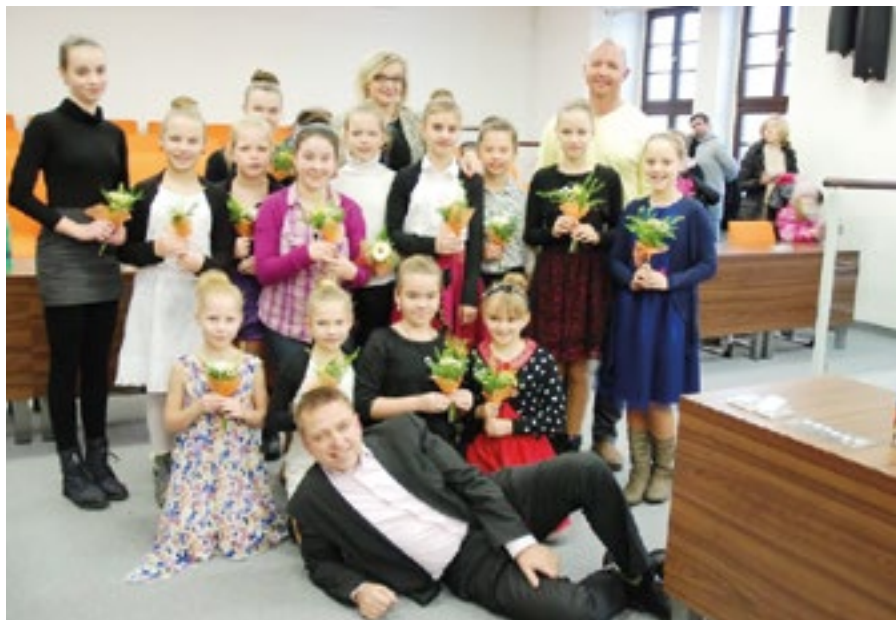
Tanečnice z Miráklu se svou vedoucí a zástupci města

Všem soutěžím předcházela před Mistrovstvím ČR regionální a zemská kola, vše jsou extraliga soutěže.