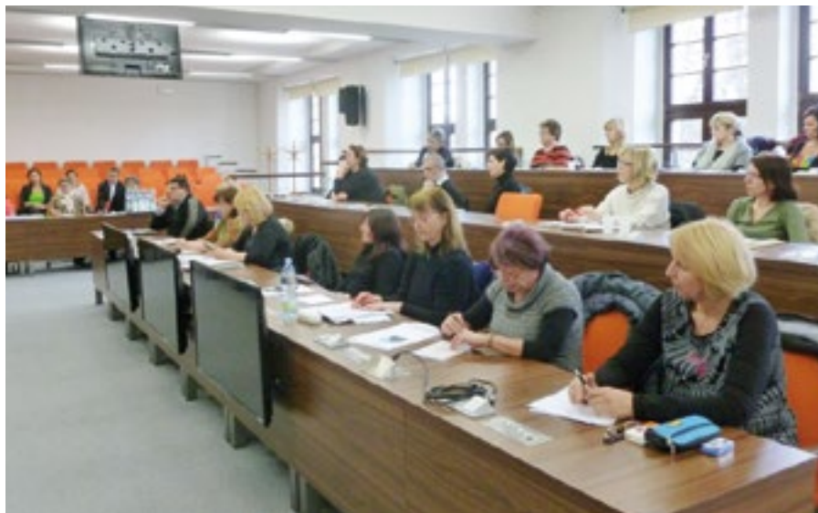
Porady se zúčastnilo 18 zástupců škol.

se problematiky společného vzdělávání, profesního rozvoje pedagogů, rovněž se podělila o důležitá témata, diskutovaná na poradách na MŠMT a přednesla aktuální změny ze školské legislativy (např. z platné novely zákona o pedagogických pracovnících, velmi živě diskutovaného § 16 novely školského zákona o podpoře vzdělávání dětí, žáků a studentů se speciálními vzdělávacími potřebami ad.). Příští porada by se měla konat na podzim letošního roku.