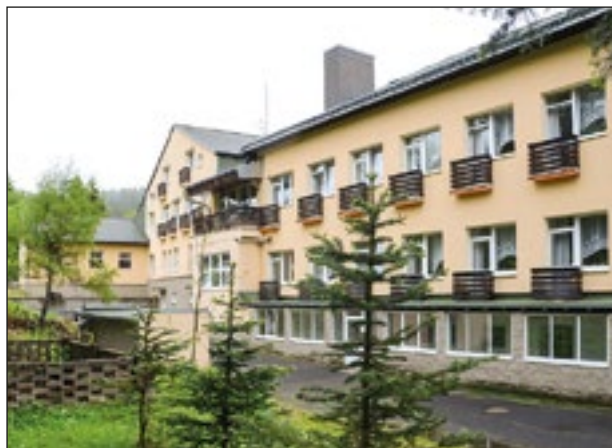
Domov pro seniory v Perninku

dagogický pracovník v soc. službách. Přikláním se k názoru, že pokud je to možné, měl by žít senior doma s podporou rodiny či jiné podpůrné služby. Někdy však život přináší situace, kdy potřebuje tak vysokou míru podpory (a nemá nikoho, kdy by mu ji poskytl), že je pro něj pobytové zařízení soc. služeb jediná možnost. Pro tyto případy budou, dle mého názoru, pobytové služby i v budoucnu nezbytné a snahou nás, zaměstnanců, by mělo být vytvoření takových životních podmínek, kde by lidé mohli důstojně a smysluplně strávit poslední roky života. Pevně věřím, že se nám to v Domově daří. Více na: www.domov-pernink.cz