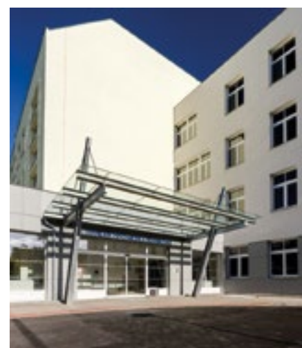
Pavilon B s lůžkovou i ambulantní částí je jediný svého druhu v kraji.

V lednu byl zahájen provoz pavilonu B, kde vzniklo moderní lůžkové pracoviště psychiatrického výzkumu a rehabilitace. Došlo tak k přesunu stávajících ambulantních a lůžkových částí předmětných oddělení do nových, kapacitně lépe vyhovujících prostor, které umožní zavedení nových léčebných metod, zajistí včasnou a efektivnější lékařskou péči a znamenají tak výrazný posun v oblasti zajištění komplexnosti péče pro klienty zdravotnického zařízení. Oddělení psychiatrie je jediným nemocničním zařízením s ambulantní i lůžkovou částí v kraji. Celková kapacita je 50 lůžek. Nově zřízené oddělení rehabilitace má 32 lůžek a je z hlediska nabídky a komplexnosti služeb rovněž zařízením krajského významu, jelikož v Karlovarském kraji prozatím zdravotní péče v takto požadovaném standardu a kapacitě chyběla.