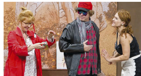
Ilustraci foto agentury