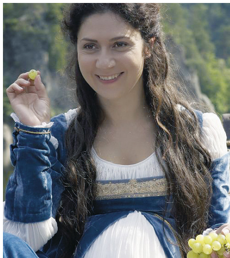
Sedmero krkavců

Děti mají prázdniny, užívají si léto u vody a v přírodě, ale festivalový štáb prázdniny nemá. V letních měsících finišují práce na dalším říjnovém festivalu. V letošním roce se bude 47. dětský filmový a televizní festival Oty Hofmana konat v termínu od 11. do 15. října a hlavní téma je: „KOUZLA