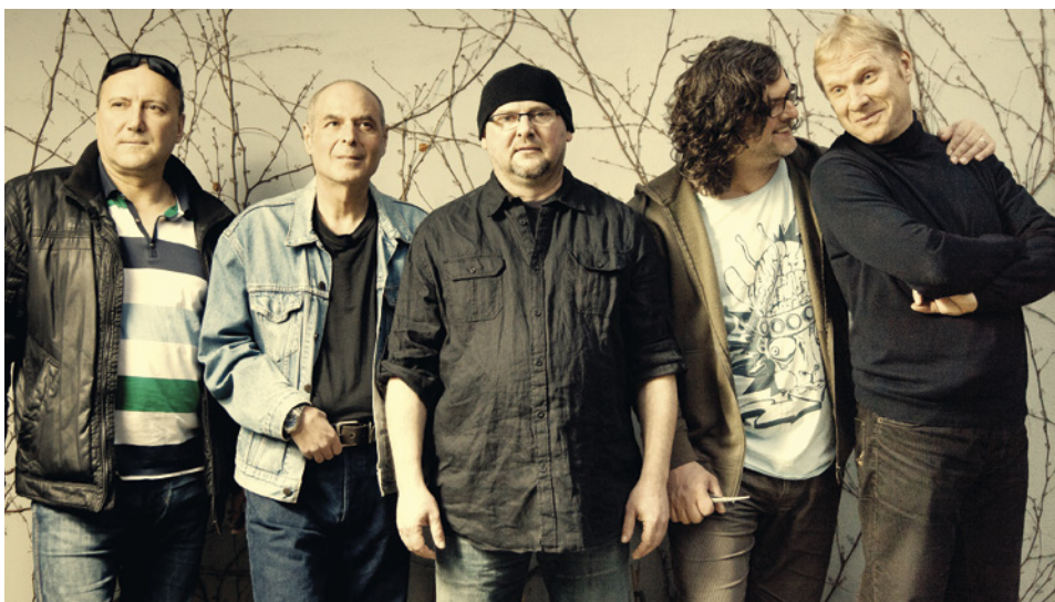
Voxel a kapela Buty uzavře letošní program.