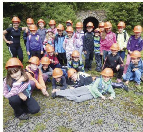
Příměstský tábor s Ekocentrem: z výletu do Štoly č. 1

Malý ráj zvířat v zahradě Klášterního areálu. Zažijete zde bezprostřední kontakt se zvířaty, který se vám jinde nenaskytne. Chováme přes 100 druhů