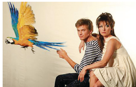
Bláznivý Petříček

Jsme moc rádi, že má festival svá partnerská města (Jáchymov, Pernink, Nejde, Kyselku, Kadaň, Klášterec nad Ohří, Planou u Mariánských Lázní,