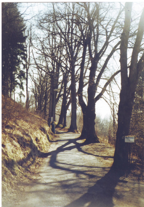
Císařskou alej vysadili Jáchymovští roku 1900.

Vyjdeme po žluté turistické značce z centra Božího Daru na jih přes areál lyžařských běžeckých tratí (vlevo), s výhledy na sjezdovky na Neklidu, kolem dávno nepoužívaného stožáru lyžařského vleku. Krátce nato už jsme v blízkosti žluté značené krátké odbočky vlevo na Hadí horu (pozor, nepřehlédnout). Kamenné moře, vyhlídka do údolí k Jáchymovu a v létě i bohatství borůvek nás odmění za vynaloženou námahu. Po návra-