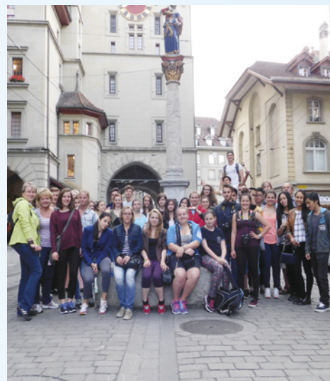
Výprava gymnazistů v Bernu