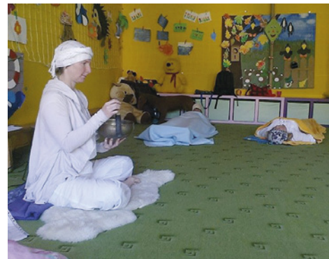
Jóga v prostorách RC Ostrůvek pokračuje i v létě.