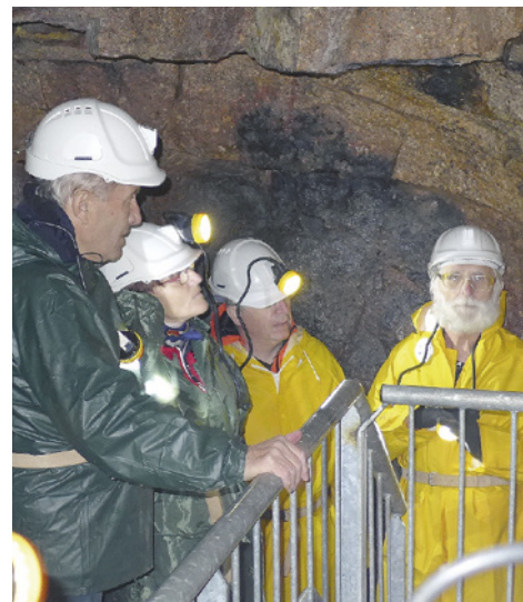
Abertamy, ve štole Mauritius

Bližší informace (doba odjezdu, počet km, org. propozice) budou k dispozici vždy od středy pro příslušný sobotní termín ve vitrině KČT na Mírovém náměstí u autobusové zastávky na K. Vary. Více na: www.turiste.webpark.cz