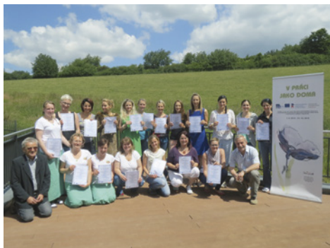
Díky kurzu vznikl výborný kolektiv.

dinách probíhala od 25. února do konce června v RC Ostrůvek, kde bylo zároveň zajištěno po dobu výuky hlídání dětí zdarma. Bezproblémový průběh kurzu zajišťovali kmenoví zaměstnanci firmy Attavena o.p.s. i externisté na vysoké profesionální úrovni. Skupina maminek, která se sešla v ostrovském kurzu, byla velmi různorodá, ale všechny měly společný cíl: něco nového se naučit. Kromě toho za čtyři měsíce vytvořily výborný kolektiv, naučily se spolupracovat, efektivně komunikovat a rovněž porozumět lépe nejen sobě, ale i potřebám ostatních.