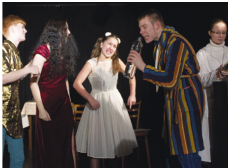
Z představení Tam, kde šplouná

V okresním kole v přednesu do 15 let Dětská scéna byli úspěšní tito žáci: