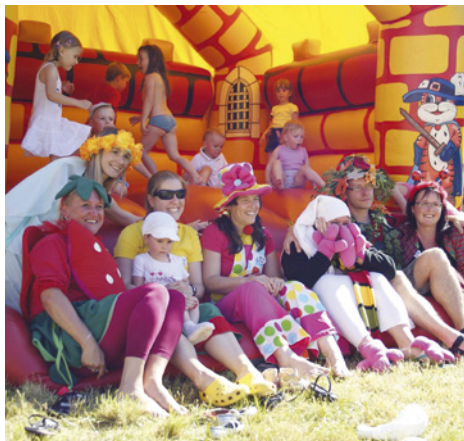
Den s RC Ostrůvek