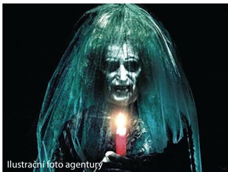
Ilustrační foto agentury

INSIDIOUS 3 – POČÁTEK: Novou kapitolu děsivé hororové série napsal a režíroval její spoluvůdce Leigh Whannell. Mrazivý prequel, situovaný do doby před strašidelnými zážitky rodiny Lambertů, odhaluje osudy nadané jasnovidky Elise Rainierové (Lin Shaye). Ta se po jistém váhání rozhodne pomoci svých schopností kontaktovat mrtvé, aby tak pomohla dospívající dívce (Stefanie Scott), již si za svůj cíl vybrala nebezpečná nadpřirozená bytost. Snímek v Ostrově uvidíte 11. a 13. června.