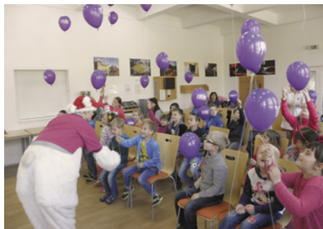
Děti se radují z darovaných balonků.

Právě probíhá celostátní průzkum „Nejlepší nemocnice ČR 2015“, pořádaný organizací HealthCare Institute, do kterého se i letos zapojila Nemocnice Ostrov. Průzkum potrvá do 31. srpna 2015; je zaměřen na sledování spokojenosti a bezpečnosti zaměstnanců a pacientů v českých nemocnicích. Za loňský rok získala naše nemocnice za Karlovarský kraj třikrát první místo v kategoriích: spokojenosti hospitalizovaných pacientů, spokojenosti zaměstnanců a finančního zdraví. Ocenění si velice vážíme, všem pacientům i zaměstnancům děkujeme za hlasy a důvěru v naši péči. Doufáme, že nás podpoříte i v letošním roce. Hlasovat můžete na: www.nemostrov.cz .