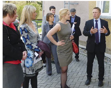
Na návštěvě seniorského zařízení