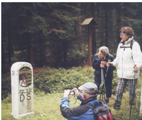
Turisté u historického hraničního milníku

Vydejme se tentokrát od potůčků k Potůčkům. Obec Potůčky (do r. 1945 Breitenbach) leží na hranicích, z největší části v hlubokém údolí říčky Černá. Ta sbírá ze strání četné potůčky, aby pak odtékala do Německa. K potůčkům patří rozsáhlá území kdysi devíti horských osad (Luhy, Háje, Stráň ad.), které po vysídlení původního obyvatelstva zanikly. Vznik Potůčků (17. stol.) spadá do období těžby rud, zejména stříbra a cínu. Ta vyvrcholila v 18. století, ale ještě po r. 1945 byly prováděny (už neúspěšné) průzkumné vrty. Z památek zasluží pozornost kostel, dokončený až začátkem 20. stol. Při silnici do Horní Blatné stojí budova dnes nevyužívaného hostince z roku 1850, Dreckschänke. Jeho majitel prý proslul značným okrádáním hostů (odtud i název).