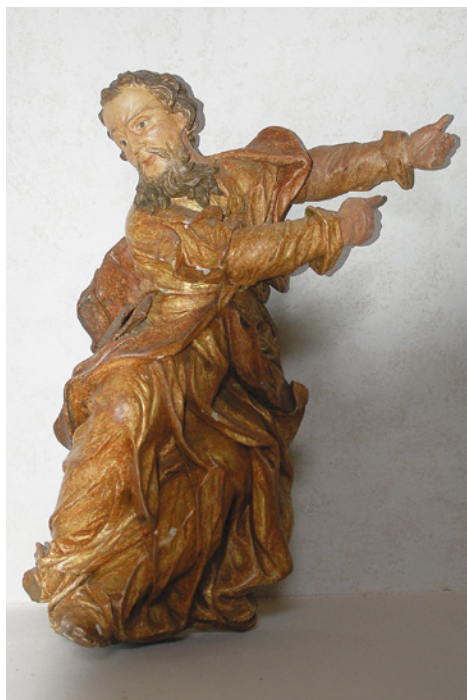
Socha Mojžíše bude zdobit klášterní kostel.

Město Ostrov získalo do zápůjčky poslední dosud známý zachovaný exponát z původního mobiliáře klášterního kostela Zvěstování Panny Marie v Ostrově. Je to původní dřevěná socha Mojžíše. Ta zdobila kazatelnu kostela od roku 1673-4 a jejím autorem je pravděpodobně ostrovský řezbář Martin Möckel. Socha, jež je v majetku Muzea Karlovy Vary, byla součástí tamní stálé expozice. Počátkem tohoto roku muzeum uzavřelo (z důvodu velké rekonstrukce) své sbírky veřejnosti