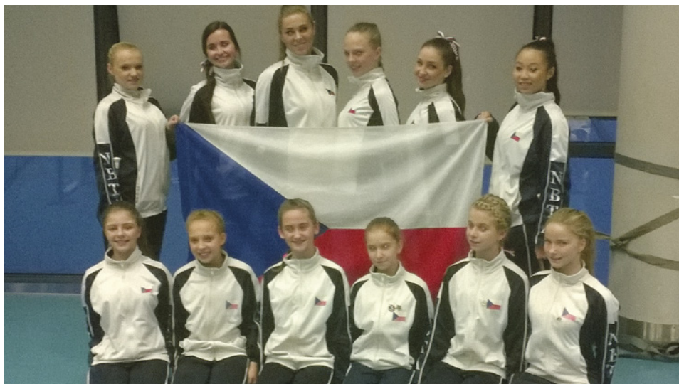
Oskarky v italském Lignan