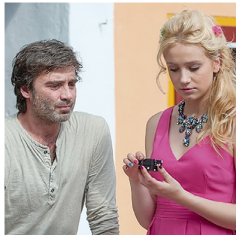
Ilustrační foto agentury

INSIDIOUS 3 – POČÁTEK: Novou kapitolu děsivé hororové série napsal a režíroval její spoluvůdce Leigh Whannell. Mrazivý prequel, situovaný do doby před strašidelnými zážitky rodiny Lambertů, odhaluje osudy nadané jasnovidky Elise Rainierové (Lin Shaye). Ta se po jistém váhání rozhodne pomoci svých schopností kontaktovat mrtvé, aby tak pomohla dospívající dívce (Stefanie Scott), již si za svůj cíl vybrala nebezpečná nadpřirozená bytost. Snímek v Ostrově uvidíte 11. a 13. června.