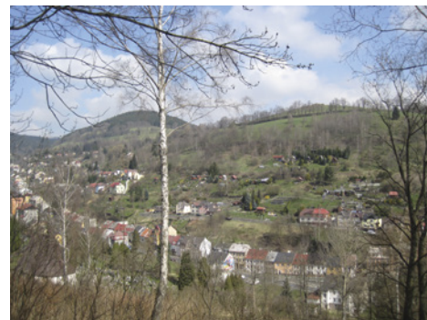
Výhled z Popova na Jáchymov

Tentokrát jsme se, opět v ženské sestavě, vypravily na výlet směr Popov. Rozhodly jsme se tak proto, že vzpomenout Dne Země a oslavit jej nemůžeme lépe, než se poklonit našim jedinečným stromům, které se po léta nacházejí pospolu na poměrně malém území, ale velmi malebném a pro nás zavazujícím. Uplynul už drahý čas, kdy jsme tu byly naposled. Počasí nám přálo, slunce nás provázelo po celou dobu, cesta radostně utíkala, a tak jsme se brzy dostaly z Jáchymova až na samotný vršek. Na zaniklou obec nás upozornila tabulka s označením Popov, ale také rozježděný terén, neboť i tam se těží dřevo. Bude následovat výsadba?