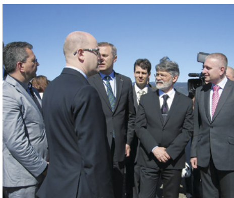
Delegace na Průmyslové zóně Ostrov