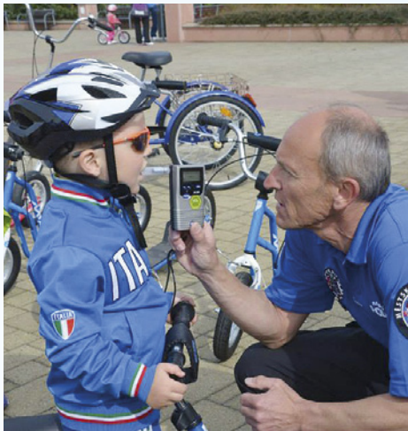
Jeden z malých řidičů hovoří s policistou.

Dočasné uzavření dopravního hřiště u ZŠ JVM nás neodradilo od uspořádání druhého ročníku akce „Malý řidič, také řidič“. Naložili jsme dopravní značky, překážky jízdy zručnosti, koloběžky, stoly i židle a převezli vše na náměstí. Křída vykouzila přechody pro chodce i jiné vodorovné značení. Kdo nevěří, může se podívat na internet nebo facebook, kde je vše zdokumentováno. Ačkoli v ten den proběhly i jiné zajímavé akce pro děti i dospělé, přijelo a přišlo dost malých řidičů a řidiček, aby si užili pěkné dopoledne. Viděli ukázkou kynologického klubu, zkusili si jízdu podle dopravních značek, navštívili stanici technické kontroly nejmenších dopravních prostředků. Jízda zručnosti prověřila jejich jízdní dovednosti, od strážníků MP obdrželi reflexní prvky, aby byli lépe vidět a opět byly k mání miniridičky. To vše se mohlo uskutečnit především díky strážníkům