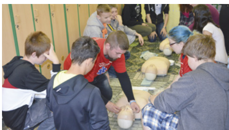
Děti navčívají první pomoc.

V naší škole se uskutečnil Peer program, který připravili studenti SZŠ Karlovy Vary pro naše osmáky a deváťáky (slovo „peer“ je převzato z angličtiny a znamená „vrstevník“). Jednalo se o interaktivní záležitost postavenou na aktivním zapojení všech účastníků, zejména našich žáků. Akce byla zaměřena na prevenci HIV a nácvik poskytnutí první pomoci. Peer program se ukázal být velice vhodný, protože v jeho rámci starší žáci (studenti SŠ) předstupují před mladší žáky, působí na ně, předávají jim zkušenosti a vedou s nimi dialog. Akci kladně zhodnotili nejen žáci, ale i učitelé. Tímto děkujeme hlavním aktérům programu.