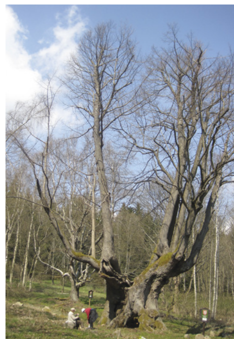
Horní popovská lípa (obvod 916 cm, výška 21 m)