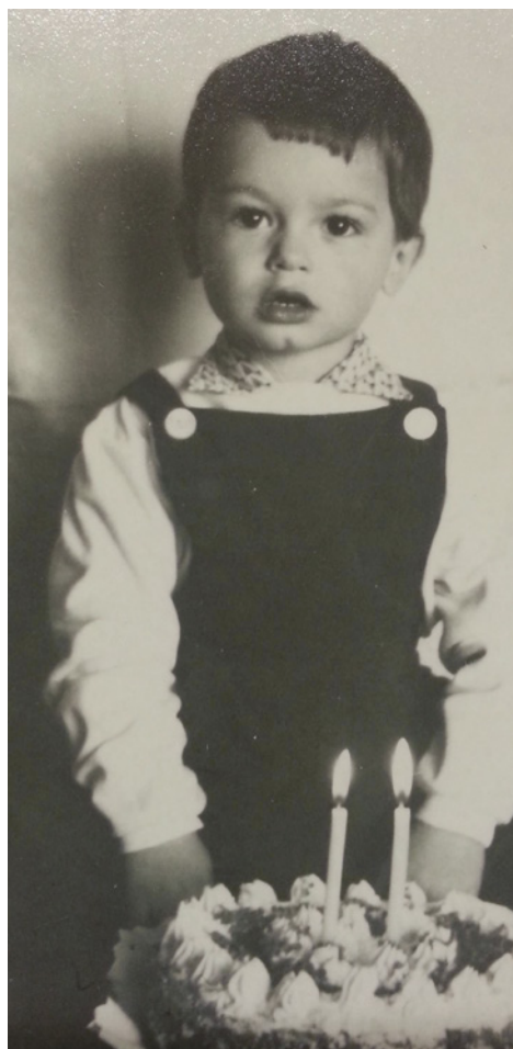
Kdo je to?