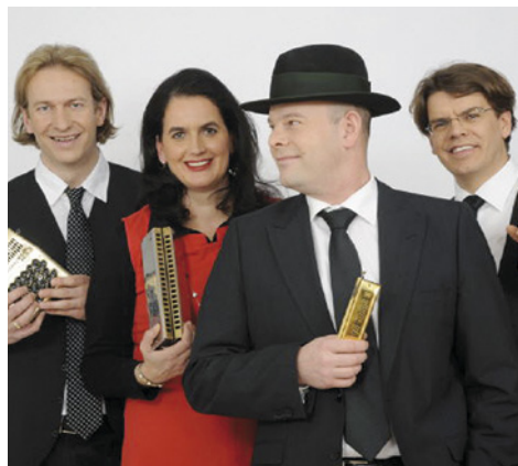
Fotka: Mundharmonika Quartett Austria

Mezinárodní Festival uprostřed Evropy – Mitte Europa připravuje svůj 24. ročník. Zahajovací koncert se koná 14. června v nově opraveném Národním domě v Karlových Varech a po vzoru předchozích let se jeden z festivalových koncertů uskuteční i v Ostrově. Klášterní kostel Zvěstování Panny Marie přivítá hudební soubor Mundharmonika Quartett Austria s programem Od klasiky k mezinárodnímu folklóru. Rakouské kvarteto, které si jako nástroje vybralo foukací harmoniky, slaví úspěchy po celém světě. Těmito nástroji docílí tak bohatého zvuku, jako by hrál celý orchestr.