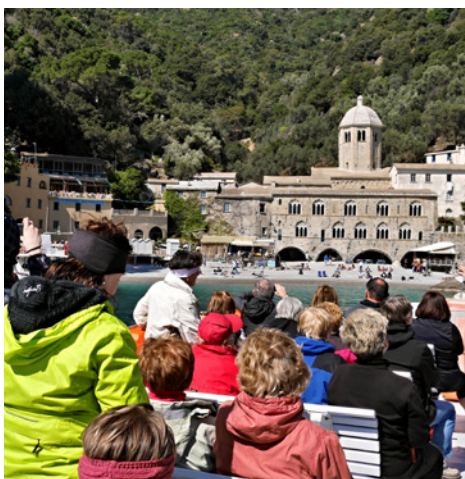
Itálie, klášter San Frutuoso u Ligurského moře

Bližší informace (doba odjezdu, počet km, org. propozice) budou k dispozici vždy od středy pro příslušný sobotní termín ve vitríně KČT na Mírovém náměstí u autobusové zastávky na K. Vary. Více na: www.turiste.webpark.cz