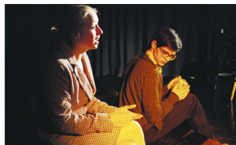
Záběr z vystoupení souboru HOP-HOP

27. června 14.00 hod., Zámecký park Den pro Ostrov – soubory TraXllety, EMA, After Party Band a Rockeři z II. patra