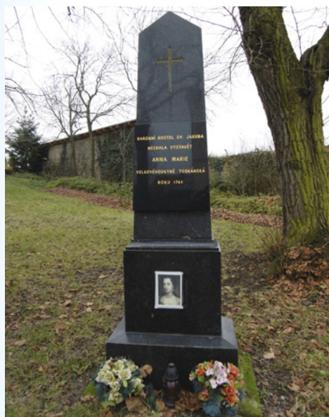
Velkovévodkyně toskánskou dnes připomíná i pamětní obelisk.

+420 477 101 531, nikola.strnadova@tgcz.cz, www.tgcz.cz