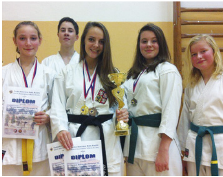
Vítězní ostrovští karatisté