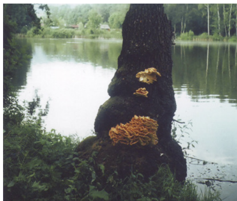
Choroš sírový (2012)