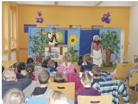
Pobyt v nemocnici příjemná pohádková představení.

z lenocha a hlupáka stal vzdělaným a pracovitým člověkem. Přitom se setká s řadou postav a postavíček, díky kterým nalézá odpovědi na to, co je správné a co naopak špatné, co je pravda a co lež, že lež má krátké nohy a žádný učený z nebe nespadá a bez práce nejsou koláče. Zkrátka pozná, že nejdříve se musí spoustu věcí naučit, aby ho v životě nikdo nemohl napálit, aby se stal „opravdovým člověkem“, pracovitým, chytrým a hlavně: aby mohl ostatním lidem pomáhat, protože to je v životě nejdůležitější. Herci podali skvělé výkony a rozesmáli nejen malé děti, které se do představení zapojily. Zpříjemnili tak pobyt malým pacientům v nemocnici a školákům školní den.