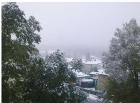
Letos napadl v Ostrově první sníh nečekaně 14. října.