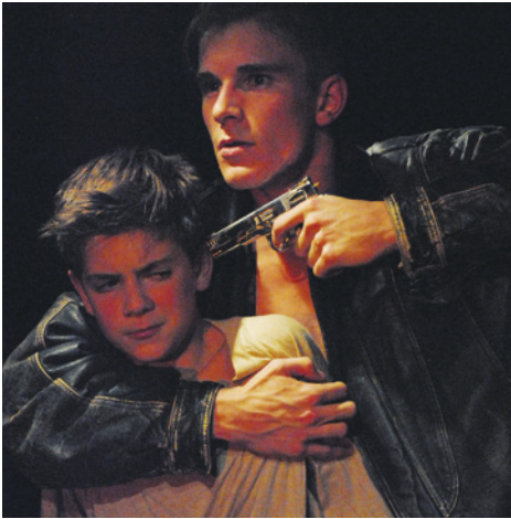
Záběr z představení „Útěk“ souboru HOP-HOP