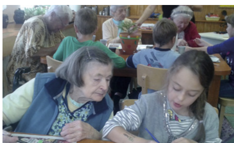
Děti a senioři společně tvoří.