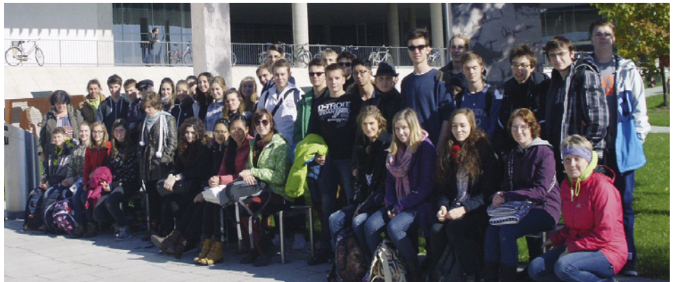
Gymnazisté v Salzburgu