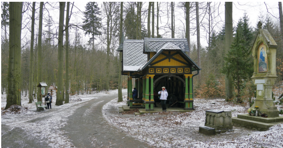
Karlovy Vary – zima v lázeňských lesích