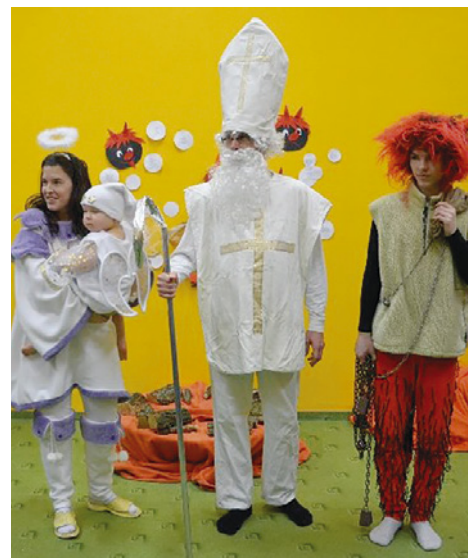
Ilustrační foto: Pavlína Blattnerová