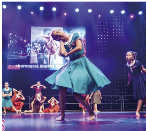
Z vystoupení Wintonovy vlaky

Taneční skupina Mirákl při ZUŠ Ostrov má od září za sebou spoustu akcí, některé na mezinárodní úrovni. Do školního roku vstoupila soustředěním v Čestlicích, které vyhrála v rámci tour Taneční skupina roku. Týden v pražském Aquapalace ale nebyla jen zábava, tanečníci se věnovali přípravě pod vedením špičkových lektorů na balet, jazz a současný moderní tanec. Začátkem října pak skupina reprezentovala ČR na Mistrovství Evropy v show dance na Gibraltar. I když ve startovní listině ostrovští tanečníci patřili mezi nejmladší,