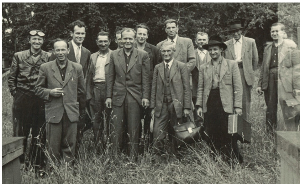
Včelaři v roce 1953