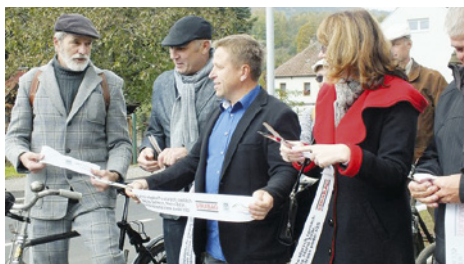
Ze slavnostního otevření nové trasy cyklostezky