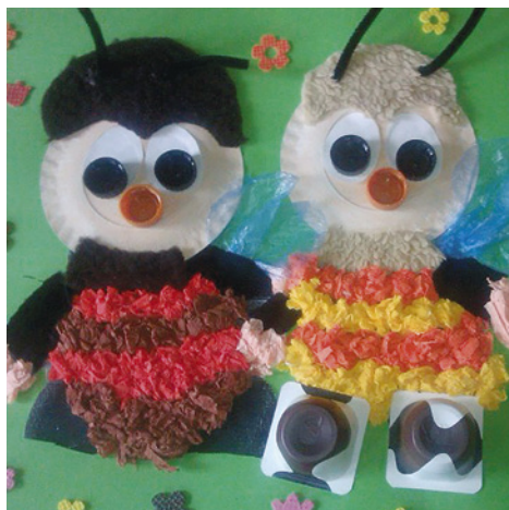
Dětská tvorba v soutěži „Hrajeme si s odpady“

Pomáhejme společně těm, kteří to potřebují! Naše škola se zapojila do projektu Dobrý anděl a spolu s rodiči žáků i ostatními návštěvníky, kteří navštíví „Den otevřených dveří“, přispěje finanční částkou na Konto Dobrého anděla. Každá třída vyrobila různé andělíčky a nabídne je k prodeji právě v Den otevřených dveří, který se koná 4. prosince. Nadační fond Dobrý anděl podporuje rodiny s dětmi, které se vlivem rakoviny nebo jiné vážné nemoci dostaly do finanční tísně. Přes 30 tisíc dárců – Dobrých andělů – tak od vzniku nadačního fondu r. 2011 pomohlo více než 1800 rodinám. Je úžasné, kolika lidem není lhostejné, co prožívají rodiny kolem nás, které postihlo onemocnění, jenž je postrachem. Děkujeme všem za návštěvu a zakoupení andělka. Žáci tříd 1.A a 2.C se zapojili do výtvarné soutěže, projekt Karlovarského kraje a společnosti EKO-KOM, a.s. Tématem je „Hrajeme si s odpady“. Kategorie mají definovaný návrh na výtvar, který musí být vytvořen z odpadů. Obě naše třídy měly téma „Včelí medvídky“ a vy se můžete podívat na jejich výtvary. Držíme palce, ať se kolektivy skvěle umístí! Celý kolektiv ZŠ Májové přeje krásné a pohodové Vánoce a šťastný nový rok 2016. Více na www.3zsostrov.cz