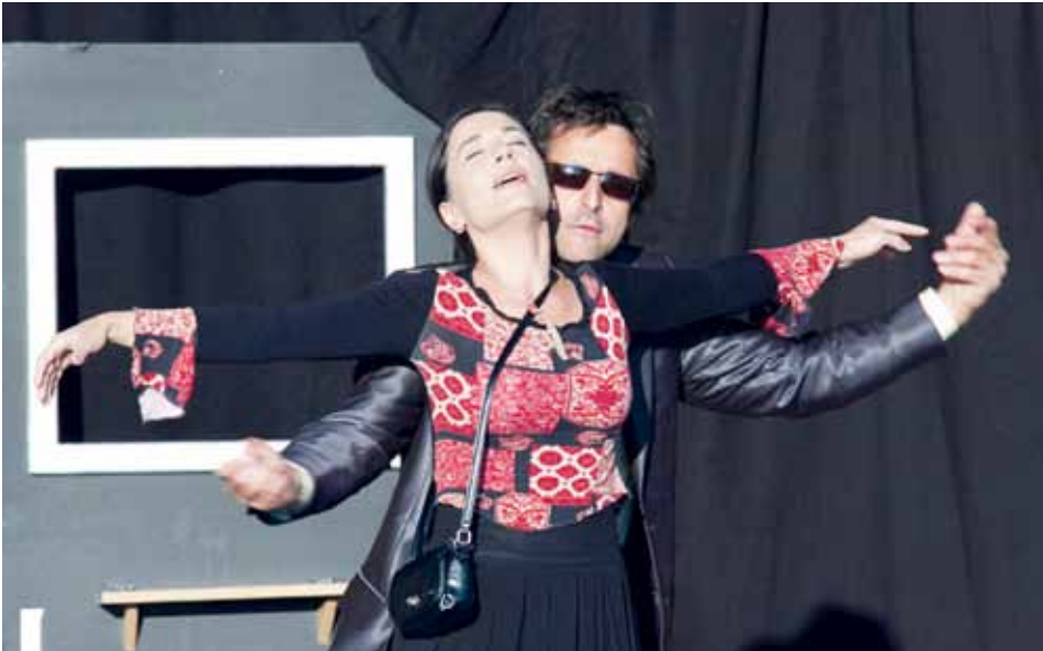
Tři v Háji (zdroj: archiv Divadla Artur).