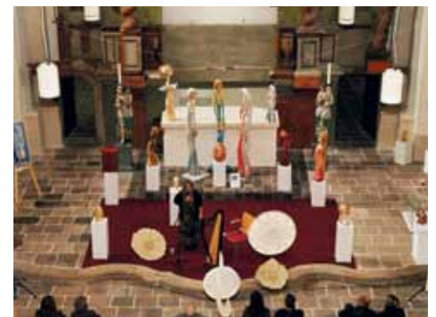
Vernisáž výstavy skupiny PAMPEKLEC.

V tomto měsíci ovšem nezůstaneme pouze u nečinného pozorování výstavy. V rámci celonárodní akce Brány památek dokořán 2014, při které se členská města připojují k Mezinárodnímu dni památek a sídel, jsme připravili ojedinelý doprovodný program v podobě výtvarných dílen, které se uskuteční v sobotu 5. dubna a v sobotu 19. dubna vždy od 14.00 do 17.00 hod. Přijďte se svými ratolestmi na prohlídku výstavy a zapojte se na jedno odpoledne jako její spoluvytvořitel. Připraven bude materiál a barvy pro vytvoření vlastních uměleckých děl, které budou představeny veřejnosti v prostorách kostela Zvěstování Panny Marie jako součást výstavy PAMPEKLEC . Kromě předvedení práce s dřevem a barvami přijdou obohatit tyto dílny i pracovníci z obecně prospěšné společnosti Pomoc v nouzi ukázkou výroby skleněných vinutých perli. Nechodte se pouze dívat, přijďte zároveň i tvořit!