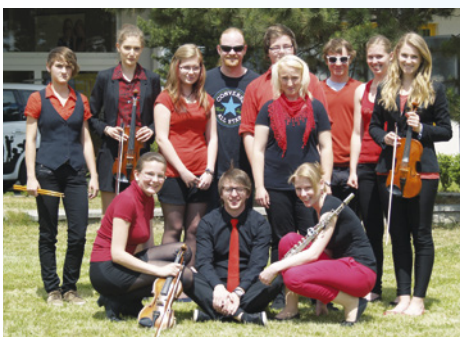
After Party Band.