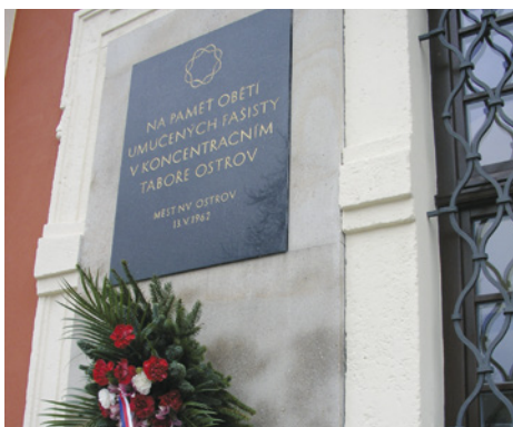
Pamětní deska na budově zámku.