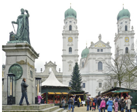
Vánoční trhy v Pasově.