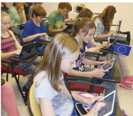
Žáci z partnerských škol ve 3D laboratoři.